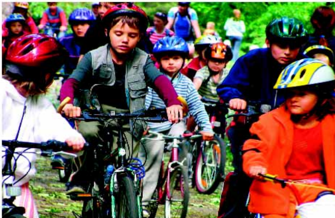
Kam se ubírá doprava našich městech? Bude zde více prostoru pro lidi či auta?

Doprava je fenomén, bez kterého se dnešní společnost neobejde a dotýká se všech – i těch, kteří se nikdy ve svém životě nezvezli