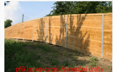
příklad oplocení železniční dráhy