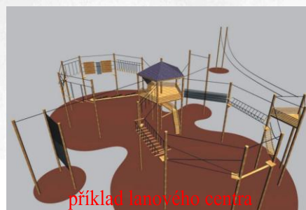
příklad lanového centra