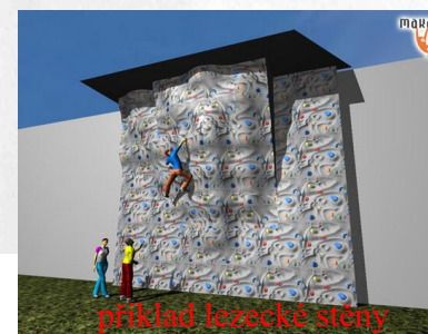
příklad lezecké stěny