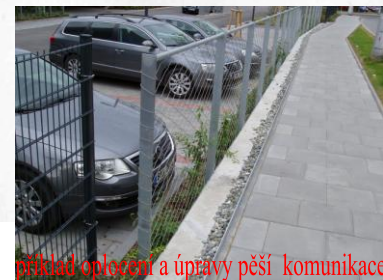
příklad oplocení a úpravy pěší komunikace