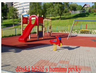
dětská hřiště s herními prvky