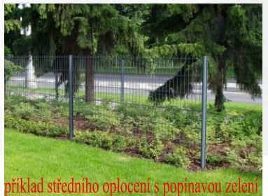
příklad středního oplocení s poplavou zelení