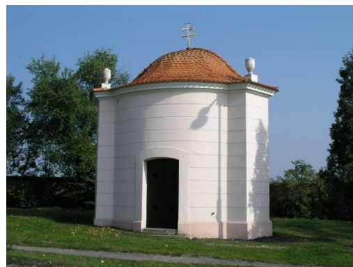
kaple sv. Rozálie na kraji Roudnice