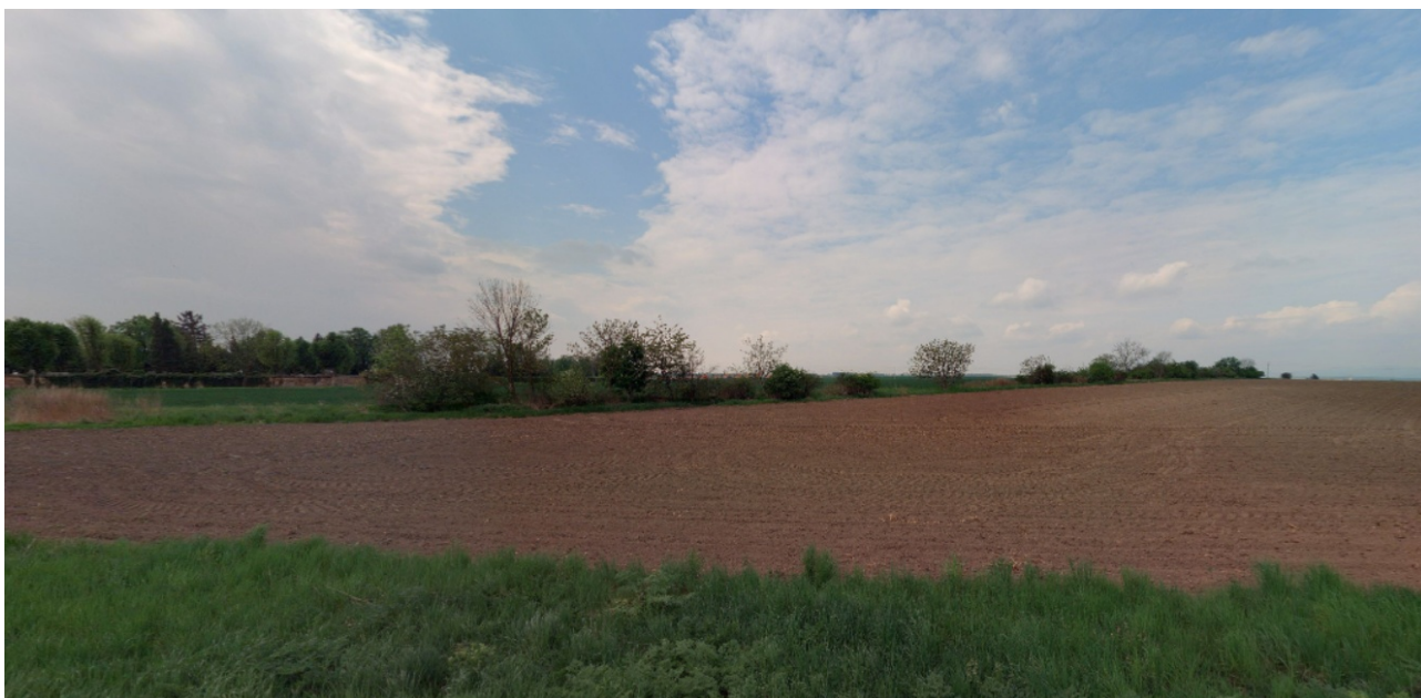
Stávající počátek poutní cesty připomínající remízek v poli

A) Historický začátek cesty z Roudnice do Doksan je dán. Vlastně je dosti pozapomenutý. Jedná se o zarostlou cestu částečně v úvozu, částečně na horizontu, zarostlou keři a stromy. Nyní je stěží průchozí pouze pěšinou a zdálky připomíná spíše remízek v poli. Tento stav se dá samozřejmě údržbou a prořezem změnit. Trochu problematický je počátek cesty, v dnešní době přístupný z komunikace III. Třídy směrem na Židovice. Toto napojení směrem od města je nevýhodou. V současné době se realizovaly některé úseky chodníků kolem kaple sv. Rozálie. Je nutné prověřit možnost vytvořit přístupový chodník podél komunikace na pozemku Ústeckého Kraje.