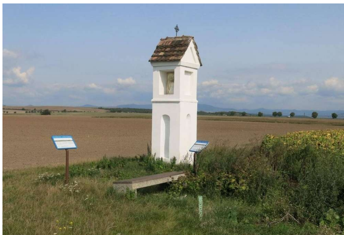
Jirchářská kaple na křížení cest

Poutník z Roudnice směrem do Doksan prošel dnešní ulicí Havlíčkovou a Třebízského ul., minul kapli sv. Rozálie a ocitl se na kraji Roudnice, kde začínala Doksanská cesta. U křížení s „Travní cestou“ se nacházela dodnes dochovaná Jirchářská kaple. A právě zde se už otevíral horizont s výhledy na České středohoří a z určitých míst, za dobrého počasí byly vidět i věže doksanského kostela.