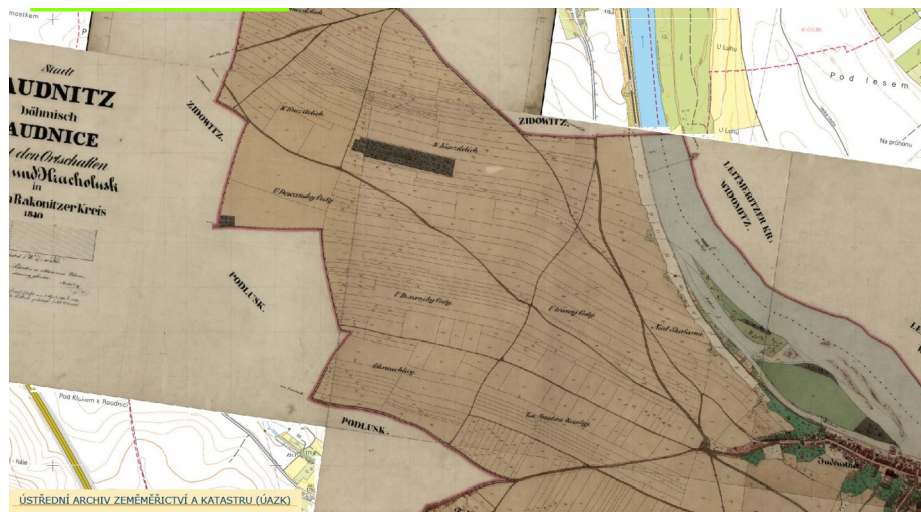
Poutní cesta na katastru Roudnice n.L. v historické mapě z r.1840

Poutní místa jsou cílem putujících a právě od zájmu poutníků pochází jejich označení. To platí i o cestách, které je spojují. Poutníci se i v našich časech vydávají na cestu směřující k místům s mimořádným duchovním obsahem a tradicí a na své pouti prohlubují nejenom svůj vztah k Bohu, ale též porozumění podobě a smyslu vlastního života. I ten je totiž poutí, cestou mající svůj počátek, průběh a cíl. Proměňující se krajina a počasí, obtíže a námahy spojené s putováním i radosti z milých setkání a projevů přátelství a pohostinnosti se stávají připomínkou prožitých událostí a vztahů. Putování tak dopřává příznivý čas a podmínky k zamyšlení, zhodnocení i přehodnocení životních postojů a událostí, k novému nasměrování a též k načerpání potřebného odhodlání a síly.