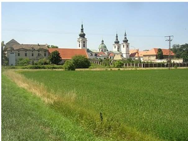
Kostel Narození Panny Marie v Doksanech

V Doksanech se nachází ženský premonstrátský klášter, bývalé opatství premonstrátek u kostela Narození Panny Marie. V Roudnici nad Labem se nachází také kostel Narození Panny Marie, ke kterému přiléhá bývalý klášter augustiniánů kanovníků.