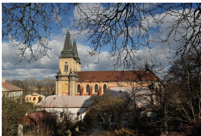
Kostel Narození Panny Marie v Roudnici nad Labem

Silný genius loci, bohatá historie i současnost definuje obě tato místa vzdálená od sebe cca 7,5 km. Doksany historicky bývaly a stále jsou významným mariánským poutním místem vyhledávaným nemalým počtem roudnických poutníků.