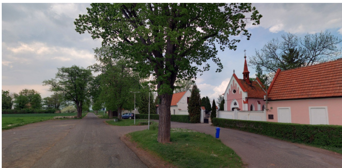
Cesta podél hřbitova, na kterou naváže nový nástup na poutní cestu.

V Roudnici, která je spojena touto poutní cestou s mariánským poutním místě v Doksanech, tak může vzniknout ojedinělá poutní cesta připomínající radosti a bolesti Panny Marie. Jednotlivá zastavení budou obohacením obnovené cesty. Je možno uvažovat variantně o cestě se 7 zastaveními a sice sedmi radostech Panny Marie anebo doplnit i o cestu sedmi bolestí Panny Marie. Tady se nabízí, vzhledem k nástupu na cestu za hřbitovem realizovat z tohoto místa právě tuto „bolestnou“ cestu. A v rámci okruhu by na ni navázala cesta radostná, která by mohla být zakončením putování v opačném směru od Doksan. Obě cesty se pospolu vyskytují vzácně. V tomto ohledu by mohla být poutní cesta s mariánskými zastaveními u Roudnice jedinečná.