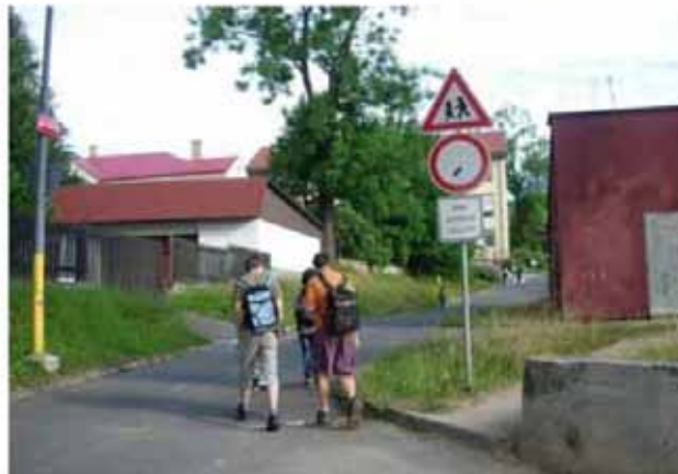
Cesta zónou bez aut a přes přechody