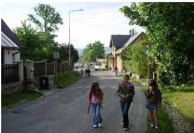
Komunikace bez chodníkové úpravy