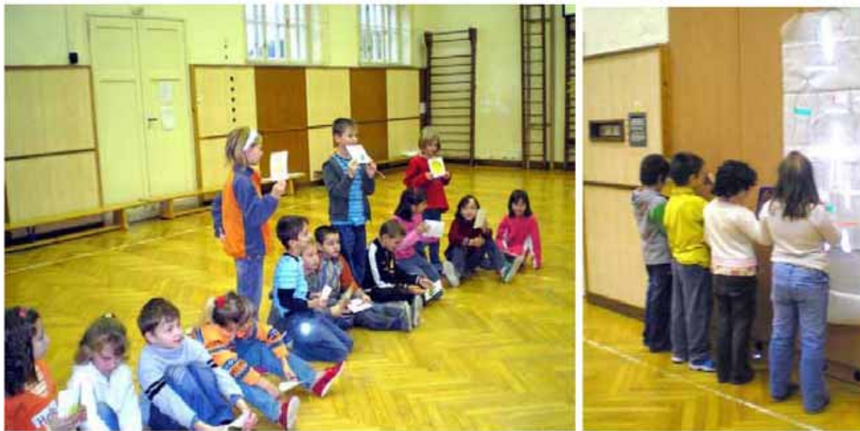
Zpětné zrcátko a mrtvý úhel řidiče