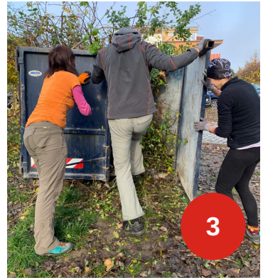
1 Velká Měcholupská, 2 Uklidme Dolní Měcholupy a Malý háj, 3 Kultivace prostoru a sousedské opékání špekáčků V Osíkách