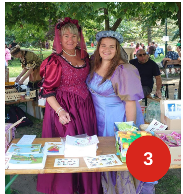
1 Velikonoční stezka, 2 Měcholupská pohádka, 3 Pohádkové Setkání za školou