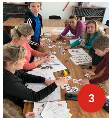
1 Nová zastávka školního autobusu, 2 Školní parlament, 3 Výuka ČJ pro cizince