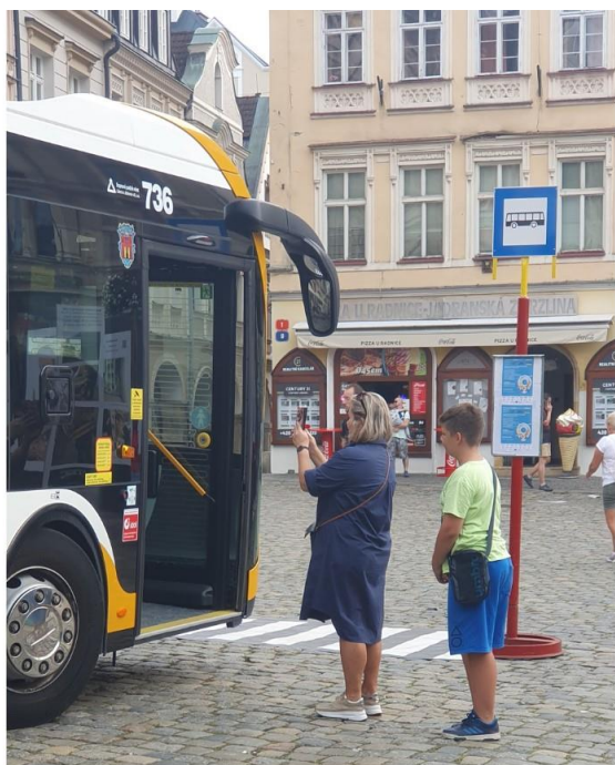
Příloha č. 7.1 – Evropský týden mobility