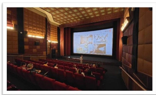
Obrázek 17: Fotografie z akce Kulatý stůl na téma nové prostory městské knihovny

Zazněl také požadavek na rozšíření parkování o další místa u dětského hřiště a instalaci kamerového systému pro zvýšení bezpečnosti. Současně byl projednán návrh optimalizace stanovišť odpadových nádob s cílem zefektivnit svoz a snížit dopravní zátěž, přičemž byla podpořena varianta se zřízením dvou sběrných míst – v lokalitě „u hodin“ a ve stávajícím prostoru v ulici Ambrožova, kde zároveň zůstane umístěna nádoba na směsný komunální odpad. Setkání jasně ukázalo, že podobné akce mají velký smysl — propojují vedení města s občany a umožňují sdílet názory přímo v terénu a často i vysvětlovat a osvětlovat daná řešení.