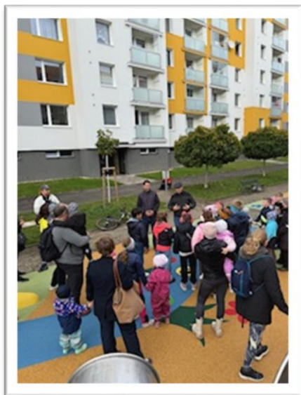
Obrázek 19: Fotografie k akci otevření hřiště Ambrožova

V ulici Ambrožova proběhlo slavnostní otevření nově vybudovaného hřiště, které přilákalo obyvatele všech věkových kategorií. Atmosféra byla i přes chladnější počasí příjemná a přátelská, rodiče si prohlíželi herní prvky a děti se okamžitě pustily do zkoušení prolézaček i sportovních koutů. Akce se konala za přítomnosti starosty a místostarosty, kde ve svém krátkém projevu zdůraznil význam kvalitních veřejných prostor pro život v městské části. Událost zároveň zaznamenala i televize RTM, která přinesla reportáž o tom, jak se podařilo proměnit v příjemné místo pro setkávání.