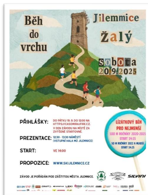
Obrázek 14: Plakát k akci Běh do vrchu

Součástí ETM byl také 58. ročník veřejného běhu do vrchu Jilemnice – Žalý, který pořádal Český krkonošský spolek SKI Jilemnice. Nejmladší sportovci si navíc zaběhli lízátkový běh na náměstí. Během celého týdne probíhala také iniciativa Pěšky do školy, doplněná o oblíbenou razítkovací hru, do které se zapojila řada dětí i rodičů.