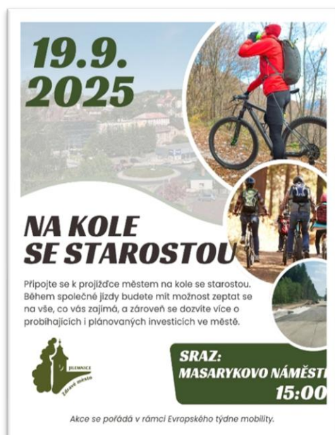
Obrázek 13: Plakát k akci Na kole se starostou

Páteční odpoledne zakončila akce: Na kole se starostou , projížďka městem na kole se starostou úspěšně nabídla víc než jen společnou jízdu. Účastníci měli možnost získat maximum informací a ptát se na vše, co je zajímavá, a zároveň se dozvědět více o aktuálních i plánovaných investicích ve městě.