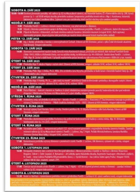
Obrázek 4: Program