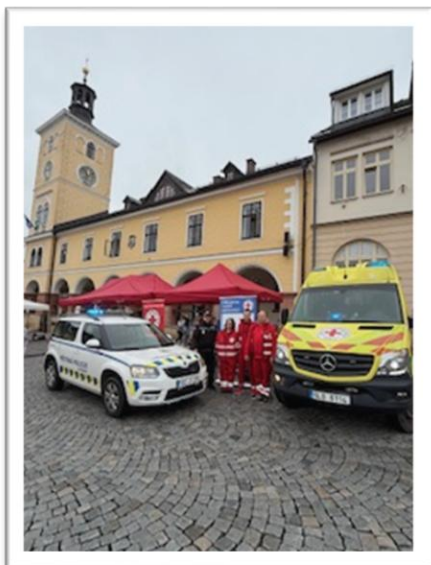
Obrázek 10: Fotografie z akce Den bez aut

Čtvrtek byl zároveň Dnem bez aut. Část Masarykova náměstí a nově také část ulice Komenského (úsek mezi školami) byla uzavřena dopravě a proměnila se v prostor určený dětem. Na náměstí nechyběla ani reprezentační stanoviště Českého červeného kříže OS Semily, který zajistil důležitou osvětu v oblasti prevence a první pomoci.