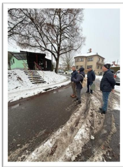
Obrázek 20: Fotografie z pochůzky se členy STP ZO Jilemnice