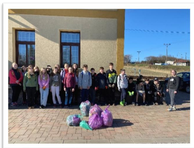
Obrázek 1: 7.třída

Po dobu akce byl pytlomat dostupný na třech místech: v podloubí radnice, u vstupu do SD Jilm a na autobusové zastávce v Hrabačově. Účastníci mohli uklízet individuálně podle vlastních možností. Součástí uklízacího týdne byla také fotosoutěž s kategoriemi Děti a mládež, Co vše se nevyhodí a Stejně místo, jiné prostředí. Vítězové jednotlivých kategorií získali hodnotné ceny.