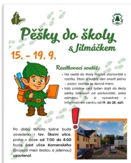
Obrázek 15: Plakát k akci Pěšky do školy

Na jedenácti stanovištích po celém městě si děti mohly nechat orazítkovat svou kartičku. Kdo během týdne nasbíral alespoň pět razítek (jedno za každý den), získal malou odměnu v informačním centru. Stanoviště byla umístěna na hlavních trasách vedoucích ke školám. Kromě podpory chození pěšky měla akce také přispět ke zklidnění dopravy v okolí škol. Proto jsme se během Dne bez aut rozhodli uzavřít ranní průjezd mezi školami, abychom ukázali, že do školy lze bezpečně dojet i z nedalekých parkovišť. Do akce se zapojilo přibližně sto dětí a díky pozitivním ohlasům od nich i od rodičů ji hodnotíme jako velmi úspěšnou.