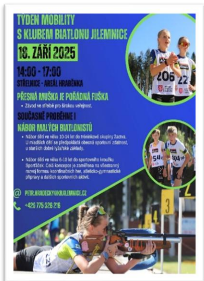
Obrázek 8: Plakát k akci Muška – pořádná fuška

Ve čtvrtek si občané mohli ověřit, zda je „muška opravdu pořádná fuška“, a to na tradiční akci Klubu biatlonu Jilemnice. Závodníci si vyzkoušeli střelbu z biatlonové vzduchové zbraně a zasoutěžili si v přesnosti.