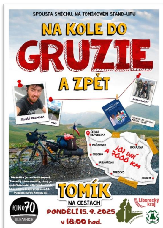
Obrázek 6: Plakát k akci Na kole do Gruzie a zpět

zemí, jejich tradicích, kultuře i nečekaných setkáních. Publikum provedl celou škálou zážitků – od humorných po ty dojemnější. Akci uspořádal SD Jilm.