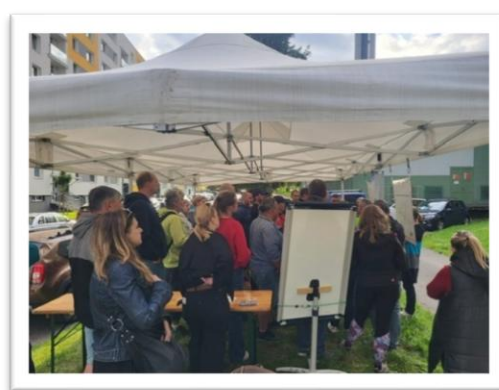
Obrázek 16: Fotografie z akce Kulatý stůl na téma parkování na Sídlišti