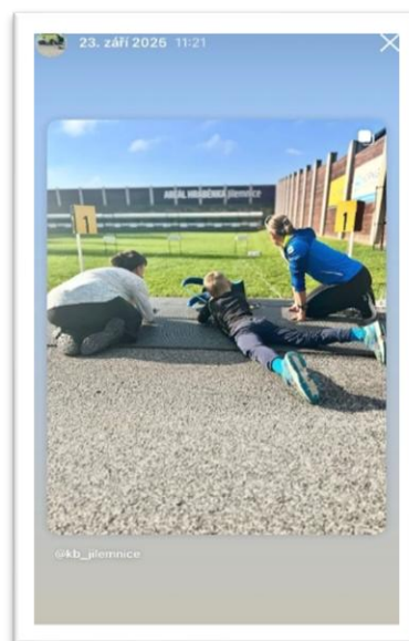
Obrázek 7 : Fotografie z akce Muška – pořádná fuška

Čtvrtek byl zároveň Dnem bez aut. Část Masarykova náměstí a nově také část ulice Komenského (úsek mezi školami) byla uzavřena dopravě a proměnila se v prostor určený dětem. Na náměstí nechyběla ani reprezentační stanoviště Českého červeného kříže OS Semily, který zajistil důležitou osvětu v oblasti prevence a první pomoci.