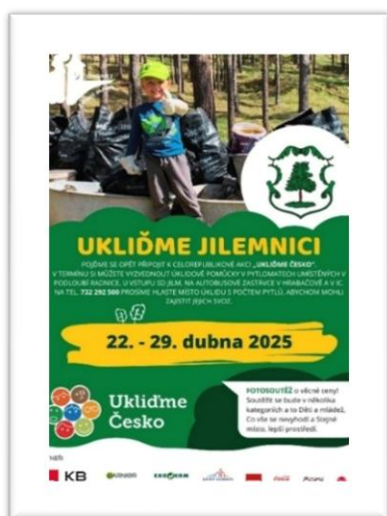
Obrázek 2: Plakát k akci: Uklid'me Jilemnici