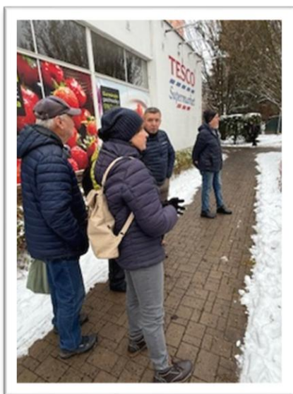
Obrázek 21: Fotografie z pochůzky se členy STP ZO Jilemnice

Při terénní pochůzce města z iniciativy komise, na autobusovém nádraží a v přilehlých ulicích byly členy STP ZO Jilemnice identifikovány překážky omezující bezpečný pohyb osob se sníženou pohyblivostí, zejména nerovnosti a poškozené části chodníků či rizikové kombinace listí a sněhu. Účastníci ocenili pozitivní vývoj jednání o obnovení přechodu z ulice Textilní ke schodům na autobusové nádraží. V oblasti údržby veřejných prostranství byly zaznamenány nedostatky v úklidu listí na autobusovém nádraží, neudržovaný pás zeleně na trase od vlakového nádraží a zanedbané trvalkové záhony v okolí gymnázia, u nichž byla doporučena údržba a doplnění výsadeb. Podněty vycházely z dlouhodobé zkušenosti účastníků s každodenním užíváním těchto míst.