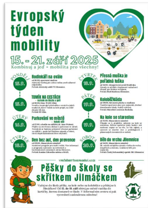
Obrázek 5: Plakát k akci Evropský týden mobility

Evropský týden mobility, vlajková iniciativa Evropské komise, probíhá každoročně od 16. do 22. září. Jeho cílem je zvýšit povědomí o udržitelné dopravě, upozornit na problémy, které automobilová doprava přináší, a ukázat způsoby, jak se lze pohybovat šetrněji ke klimatu životnímu prostředí. Během týdne mají obyvatelé možnost vyzkoušet si různé alternativní způsoby dopravy a zažít město bez aut.