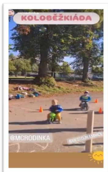
Obrázek 11: Fotografie z akce Koloběžkiáda

Závěr týdne patřil těm nejmenším – na asfaltovém hřišti vedle stadionu se konala tradiční Koloběžkiáda pořádaná MC Rodinka. Atmosféra byla živá a program přilákal mnoho malých závodníků i diváků.