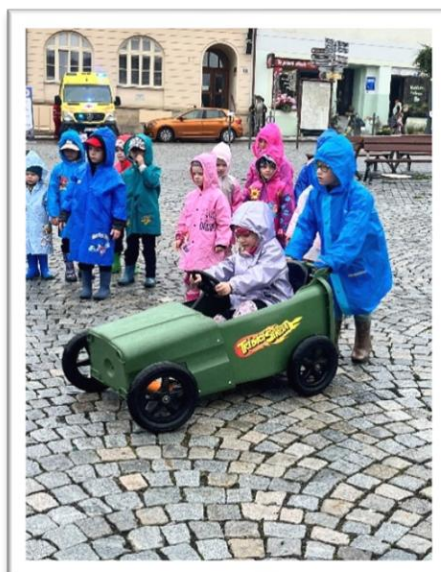
Obrázek 9: Fotografie z akce Den bez aut