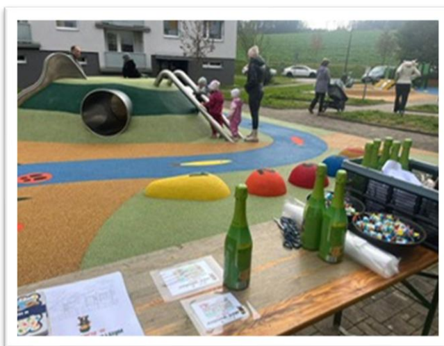
Obrázek 18: Fotografie k akci otevření hřiště Ambrožova