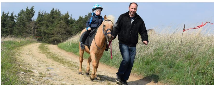
Ilustrační foto z r. 2019