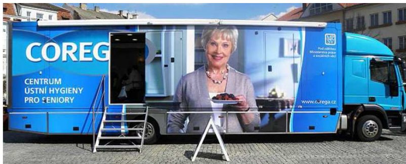
Centrum ústní hygieny

O rok později, v roce 2010, se uskutečnilo 16 akcí a 2 soutěže. Oživením kampaně bylo Centrum ústní hygieny , které jeden den poskytovalo služby seniorům na Velkém náměstí