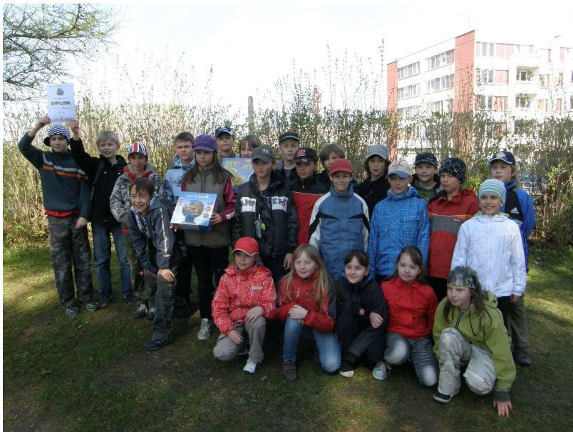
Vítězná třída Odpadové olympiády

Den Země ve Strakonici uskutečnil v Centru ekologické výchovy na Podskalí a již tradičně jej pro strakonické děti pořádá DDM Strakonice. Akce byla v roce 2009 podpořena z Příspěvkového programu Zdravého města a MA21 a v roce 2010 z Revolvingového fondu MŽP ČR.