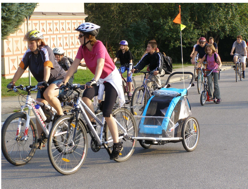
Účastníci jízdy Strakonice na dopravním prostředku poháněném vlastní silou

V roce 2010 program kampaně, která proběhla ve stejném termínu, nejen kopíroval akce z předchozího roku, ale zároveň přibylly dvě novinky. V rámci týdne mobility byl zahájen preventivní program propagující užívání reflexních prvků u nejmenších dětí s názvem Vidíš mě? a pro ceny si přišli vylosovaní cyklisté, kteří jezdili na kole bezpečně, tj. s helmou. Nejšťastnější byl výherce, který si v rámci kampaně Na kole jen s helmou! odvezl nové kolo. Kampaň Vidíš mě? byla realizována s mateřským centrem Beruška, kampaň Na kole jen s helmou! ve spolupráci s Městskou policií Strakonice a obě se uskutečnily díky podpoře z Revolvingového fondu MŽP.ČR.