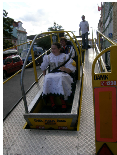
Trenažér nárazu si mohl vyzkoušet každý i dudáci