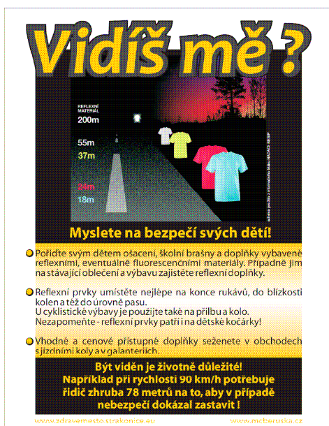
Plakát propagující používání reflexních prvků na oděvech dětí v dopravě