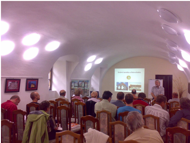
Seminář o obnovitelných zdrojích se uskutečnil v sále Šmidingerovy knihovny

V rámci daného tématu proběhl ve Strakonících 21. května 2009 seminář Solární energie, biomasa a další obnovitelné zdroje pro obyvatele Strakonicka . Tento seminář pořádalo Energy Centre České Budějovice a byl podpořen z příspěvků zdravého města pro rok 2008.