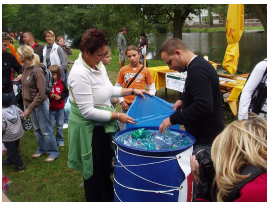
Ekorekord - nezbytná kontrola z agentury Dobrý den