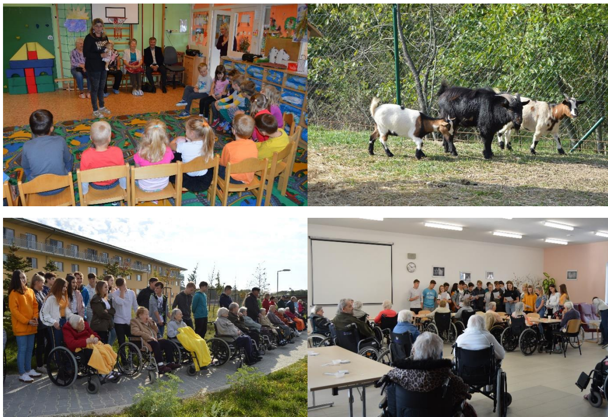
Obr. č. 19: Den seniorů

V rámci doprovodného programu Dne seniorů zazpívala v úterý 25. září seniorům Krojovaná skupina z Tasovic a Znojemské Grácie v klubu seniorů na Vančurově ulici a stejně jako v loňském roce pro zájemce proběhl kurz práce s počítačem na Gymnáziu v ulici Pontassievska a to 3. října.