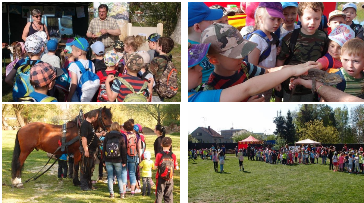
Obr. č. 6: Den Země

Kampaně se stejně jako v loňském roce ujala příspěvková organizace Městské lesy Znojmo společně s partnery a Zdravým městem Znojmem. Dopolední program byl připraven pro děti z místních mateřských a základních škol, odpoledne se pak otevřel pro širokou veřejnost. Děti mohly navštívit hned několik stanovišť a dozvědět se zajímavé informace o lese, ochraně přírody, dravých ptácích, koních, včelách, vodním hospodaření a rybníkářství. Mohly se podívat na práci stromolezců, fyzikální pokusy či si pohladit nejrůznější zvířátka, například i hady. Celým programem provázel moderátor Milan Jonáš.