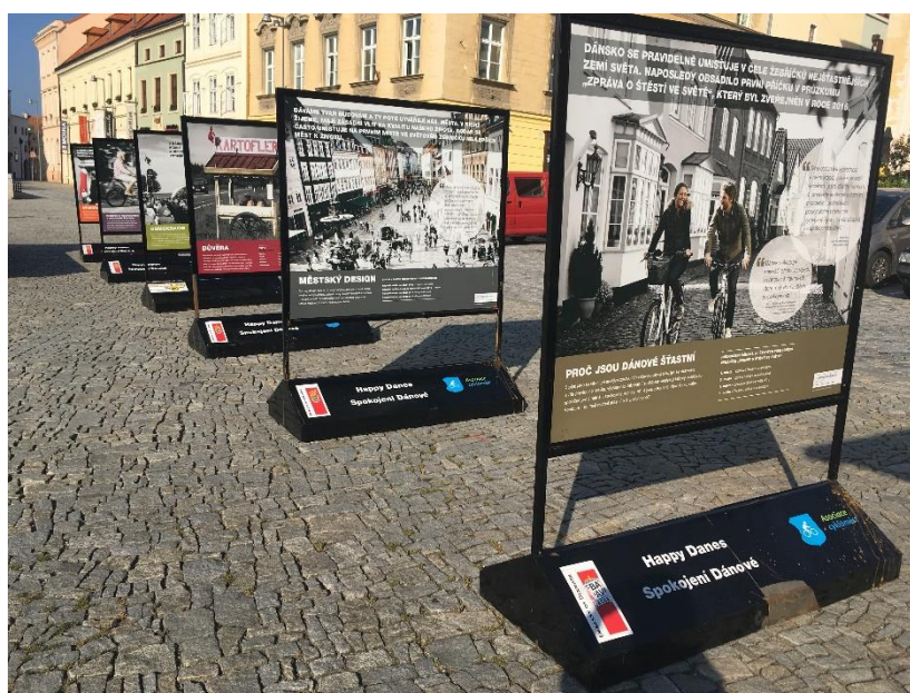
Obr. č. 5: Výstava spokojení Dánové

Dánsko se pravidelně umísťuje v čele žebříčku nejšťastnějších zemí světa. Tato výstava ukazuje recept na spokojený život, který mnohé inspiruje. Ke spokojenosti Dánů přispívá především silná občanská společnost a demokracie, vysoká míra důvěry, svobody a rovnováhy mezi osobním a pracovním životem. Jízda na kole není pro Dány nutnost, ale volba, kterou pravidelně využívá 48 % obyvatel. Rozsáhlá síť cyklostezek k tomu Dány přímo vybízí, zároveň si Dánsko udržuje jedno z nejkvalitnějších životních prostředí v Evropě, a to i v hlavním městě Kodani. Udržitelný rozvoj totiž přispívá ke zvyšování kvality života, a tudíž ke spokojenosti.