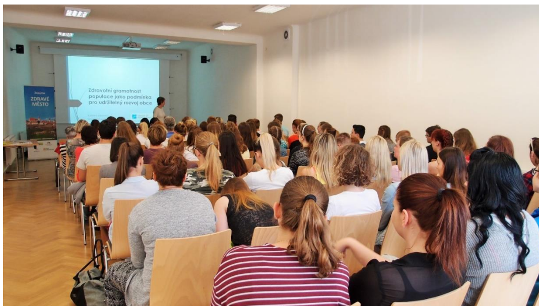
Obr. č. 4: Zdravotní gramotnost populace jako podmínka pro udržitelný rozvoj

Odborná část byla zaměřena na zdraví obyvatelstva a tomu, jak předcházet nemocem, i těm civilizačním, a jak si uchovávat zdraví. Zdravotní gramotnost je totiž zásadní nejen pro udržení a posilování zdraví každého člověka, ale také pro udržitelný rozvoj obcí a celé společnosti.