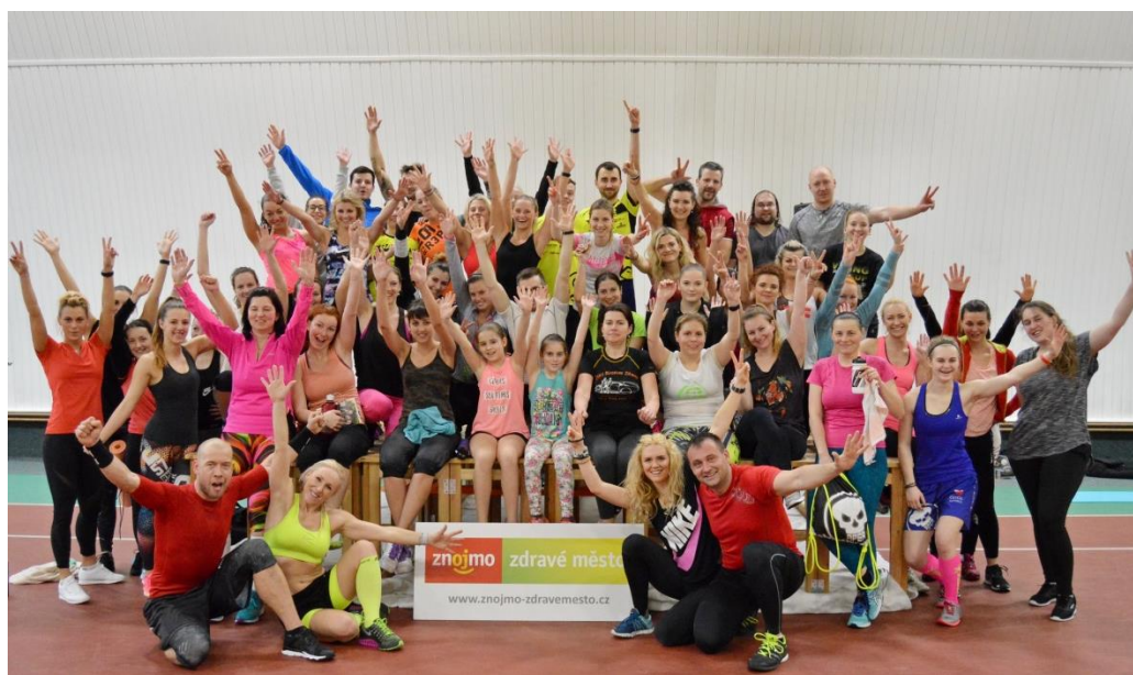
Obr. č. 7: Jarní dny zdraví

Ke Dnům zdraví neodmyslitelně patří i odborné přednášky, tentokrát na téma problematika dětské výživy a význam otužování pro zdraví člověka. Své brány dětem opět otevřelo i Středisko volného času Znojmo, vybrané kroužky si mohli zdarma vyzkoušet děti, mládež, anebo i dospělí.