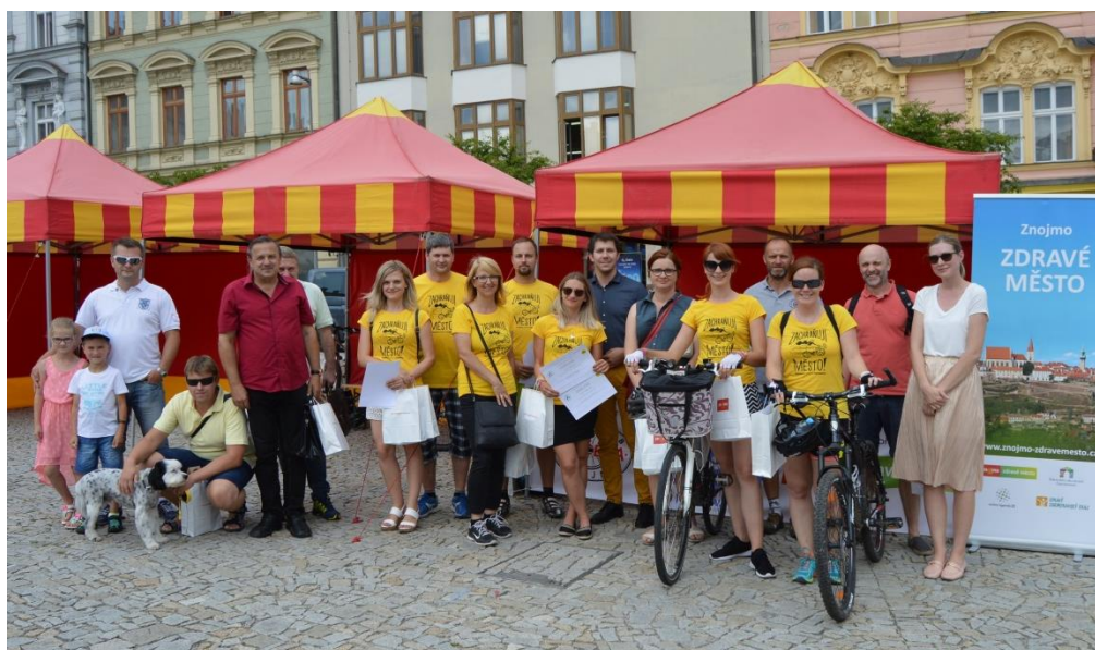
Obr. č. 2: Do práce na kole