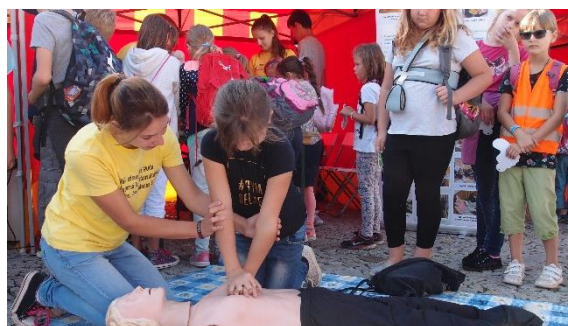
Obr. č. 10: Den bez aut