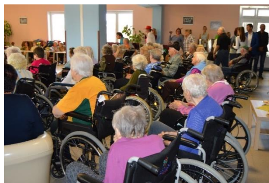
Obr. č. 16: Týden sociálních služeb