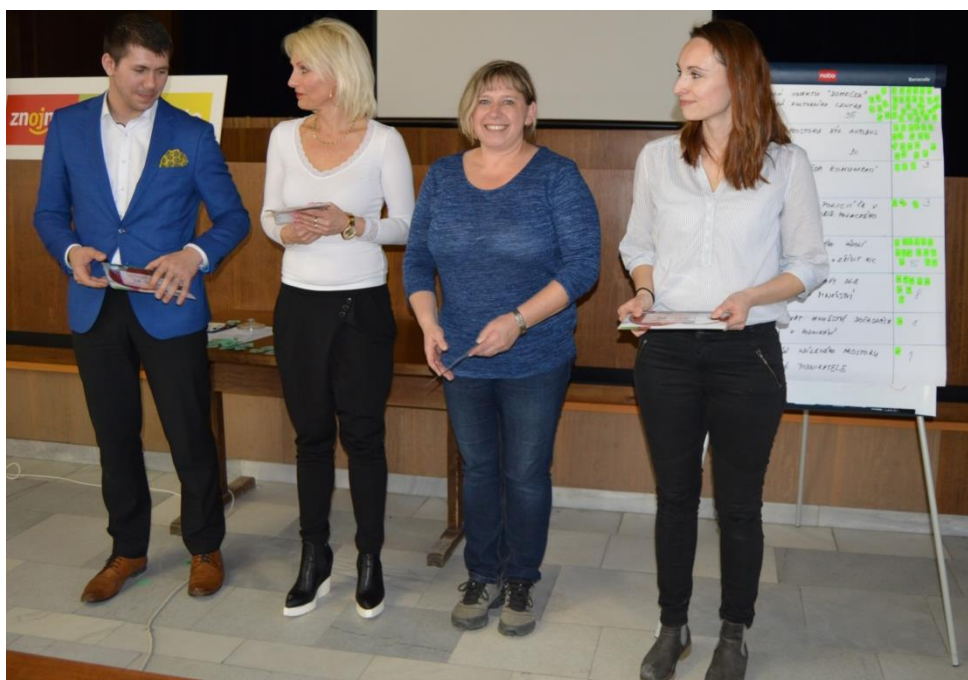
Obr. č. 13: Fórum Zdravého města Znojma

Tohoto projektu se zúčastnilo 5 znojemských mateřských škol, a to MŠ náměstí Republiky, MŠ Rudoleckého, MŠ Pražská 80, MŠ Dělnická a MŠ Holandská. První místo za svůj projekt si odnesla MŠ Dělnická.