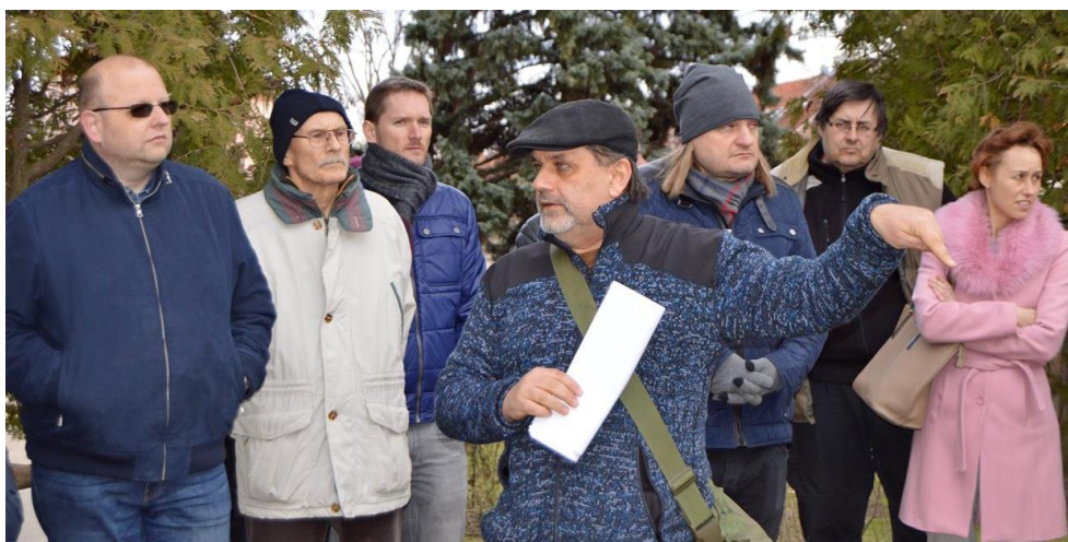
Obr. č. 1: Veřejná prezentace

První etapa revitalizace byla dokončena na podzim. Slavnostní tečkou projektu bylo odhalení busty T. G. Masaryka, a to v neděli 28. října při příležitosti 100. výročí vzniku Československé republiky.