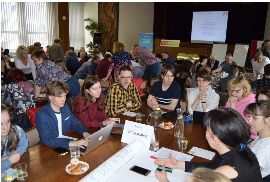
Obr. č. 11: Fórum Zdravého města Znojma