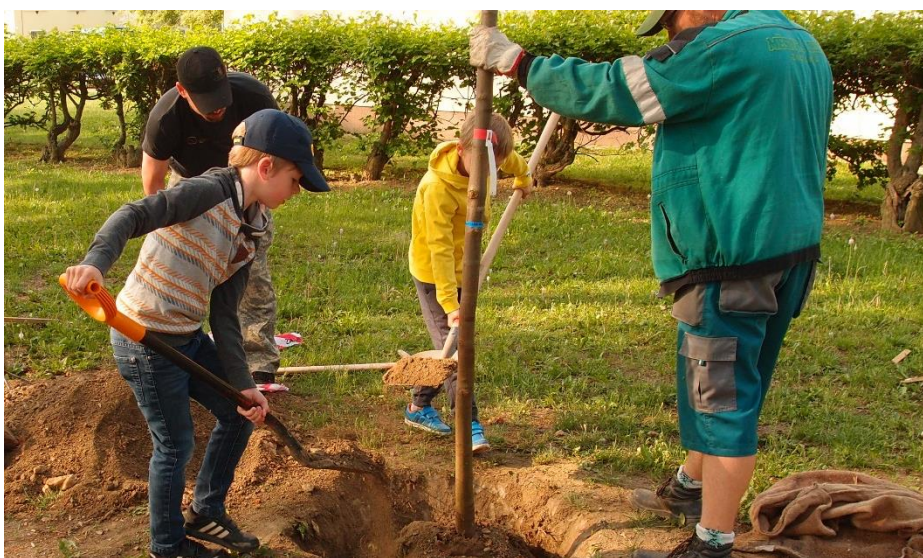
Obr. č. 3: Adopce stromů Kolonka

Tím ale práce v Kolonce nekončí, další se tu plánují v roce 2019, kdy budou opraveny cestní síť, opěrné zídky, přidán vodní prvek a zavedena automatická závlaha středního parteru.