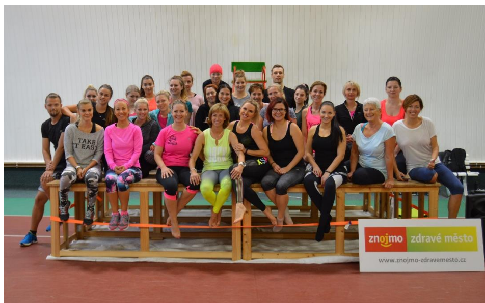
Obr. č. 8: Podzimní dny zdraví

Své brány již tradičně otevřelo i Středisko volného času, které nabídlo možnost vyzkoušet si vybrané kroužky zdarma.