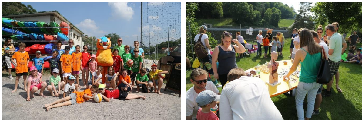
Obr. č. 18: Týden pro rodinu

Oficiální zakončení Týdne pro rodinu bylo „Diamantbraní“, o kterém je zmínka výše.