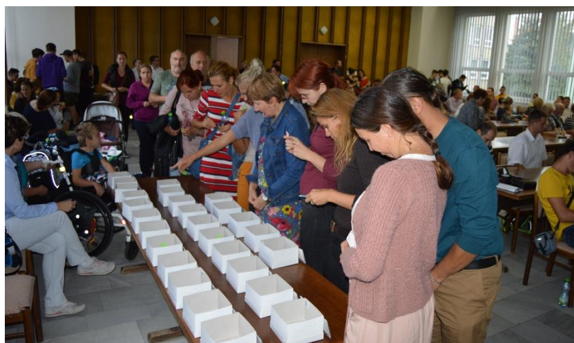
Obr. č. 14: Veřejná prezentace Tvoříme Znojmo