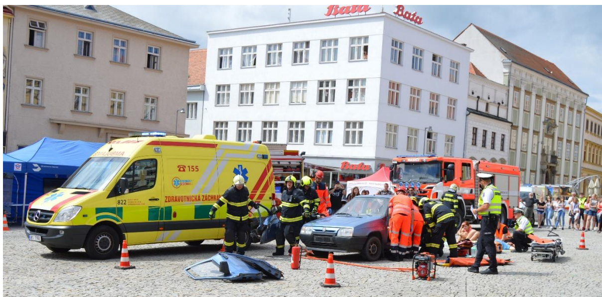
Obr. č. 9: Den bez úrazu

Návštěvníci se také mohli seznámit s výbavou záchranného hasičského a sanitního vozu nebo s vybavením a technikou PČR. Studenti Střední zdravotnické školy a Vyšší odborné školy zdravotnické Znojmo (SZŠ a VOŠZ) předvedli, jak správně poskytnout první pomoc. BESIP nabídl preventivní program pro děti i dospělé a každý měl možnost si na simulátoru nárazu na vlastní kůži vyzkoušet dopravní nehodu nanečisto a připomenout si důležitost zádržných systémů ve voze. Pestrý program doplnila Vojenská zdravotní pojišťovna ČR (VOZP) s nabídkou měření tlaku, dále Cyklo Klub Kučera, u jehož stánku byly k zapůjčení například koloběžky ,či zástupci z Cyklo Kučera, s. r. o. Znojmo, kteří návštěvníkům rozdávali drobné dárky.