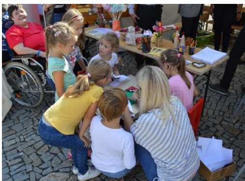
Obr. č. 15: Den sociálních služeb

Odbor sociální na náměstí Armády 8 nabídl 9. října od 14:00 hodin konzultační hodiny pro ty, kteří se chtěli dozvědět informace o poskytování dotací, a to z dotačního programu Podpora sociálních služeb v roce 2019 a Podpora rodinných aktivit. Do programu se zapojili i organizace mimo Znojmo. Bylo možné navštívit Zámek Břežany, Chráněné bydlení v Šanově nebo Domovy pro seniory Hostim, Jevišovice, Plaveč a Bořice.