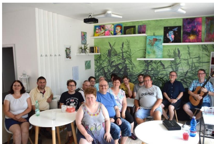
Obrázek 8 Spolu nad knihou ve Fokusu Turnov

Projekt Spolu nad knihou se zabývá biblioterapií, aktivizuje pomocí hudby a knih. Hlavním cílem byly nejen pořady a setkávání nad knihou a zajímavými hosty pro klienty Fokusu Turnov,