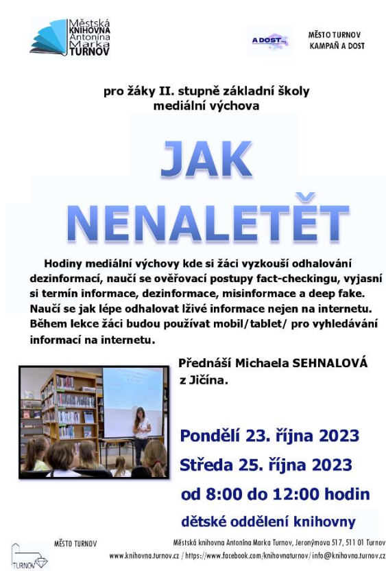
Obrázek 9 Akce městské knihovny

Ve spolupráci s odborem životního prostředí, který zaštiťuje akce v rámci projektu Uklidíme Česko, se v knihovně pravidelně koná akce Duben – měsíc pro planetu Zemi. Přináší tematické dílny, přednášky i čtení v oblasti environmentální výchovy.