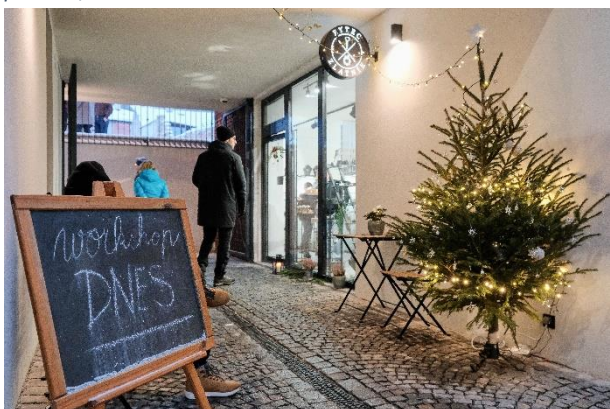
Obrázek 29 Zahájení adventu v Uličce řemesel