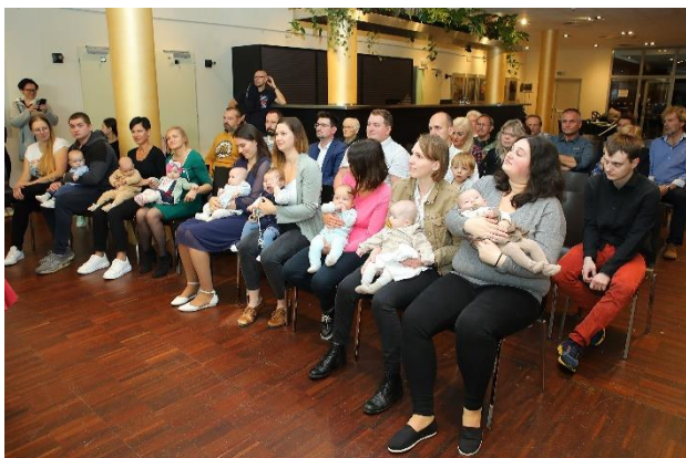
Obrázek 15 Vítání občánků probíhá ve foyer KC Střelnice

Vítání občánků pořádá město Turnov, správní odbor matrika ve spolupráci s Městskou knihovnou Antonína Marka Turnov, Centrem pro rodinu Náruč a Spolkem rodáků a přátel Turnova. Dárky od města Turnova, Náruče i SRPT (hračka, pamětní list a mince, pletené bačkůrky i další drobnosti) byly doplněny dárkovým setem s knížkou, protože součástí slavnosti je také projekt S knížkou do života – Bookstart. Maminka je obdarována ještě kytičkou a rodiče si vždy odnášejí i poukaz na tisk fotografií z vítání.