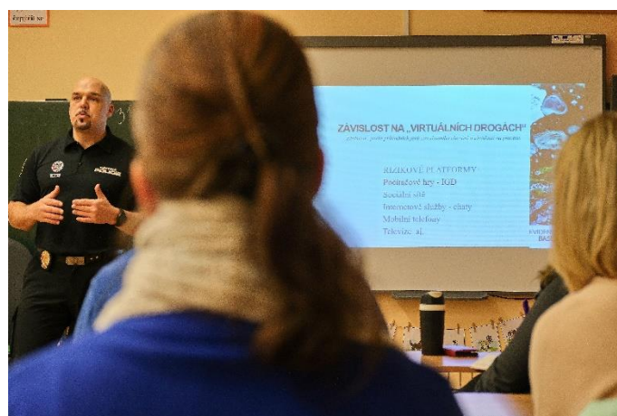
Obrázek 16 Přednáška pro rodiče na prvním stupni ZŠ Skálova

Kampaň si kladla za cíl v průběhu roku 2023 oslovit všechny věkové skupiny obyvatel Turnova různými aktivitami a projekty. Cílí také na podporu a úzkou spolupráci se školami v oblasti prevence rizikového chování. V první polovině roku se kampaň zaměří především na děti a žáky, třídní kolektivy, učitele, školy i rodiče. Cíli rovněž na seniory.