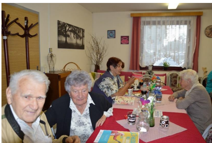
Obrázek 7 Program cyklu Aktivně ve stáří jsou mezi seniory velmi oblíbené

Pro seniory knihovna pravidelně chystá programy cyklu Aktivně ve stáří. Jedná se o projekty pro aktivizaci seniorů, které se konají v Klubu aktivní senior v penzionech Žižkova, Výšinka a Domově důchodců Pohoda.