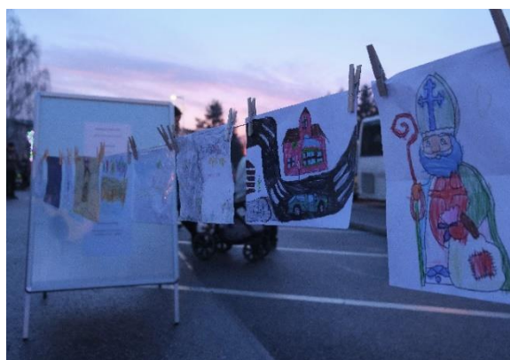
Obrázek 21 K Novoročnímu ohňostroji tradičně patří výtvarná soutěž pro děti

Majáles POSTAPOKALYPSA (17. 5. 2022) - parlament mládeže uspořádal Majáles s průvodem na téma postapokalypsa, vernisáží výstavy Příběhy z Ukrajiny i podvečerní akcí v letním kině.