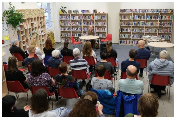
Obrázek 19 Meditace jako lék - jedna z přednášek kampaně A dost... pro veřejnost

nové preventivní programy na turnovských základních školách.