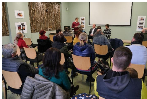
Obrázek 11 Setkání s obyvateli Dolánek, Kobylky a Bukoviny