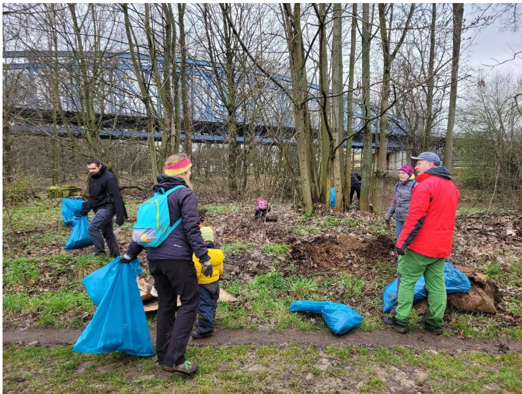
Obrázek 4 Akce Uklidme Česko – Uklidme Turnov v roce 2023 proběhla v Nudvojevicích