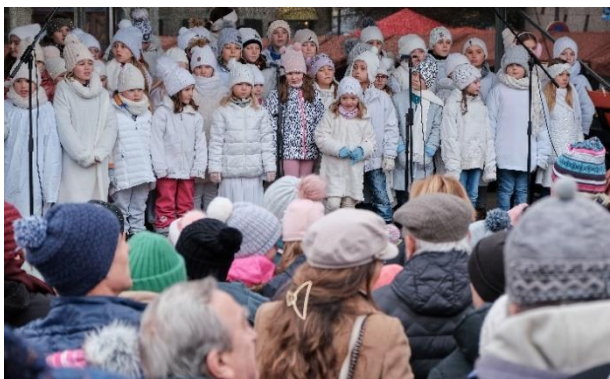
Obrázek 32 Vánoční řemeslnické trhy a vystoupení turnovských škol

Centrum pro rodinu Náruč uspořádala kampaň na sociálních sítích i setkání pro zájemce o náhradní rodinnou péči. Centrum pro rodinu Náruč oslavilo deset let od doby, kdy se mohlo stát pověřenou osobou pro podporu náhradní rodinné péče.