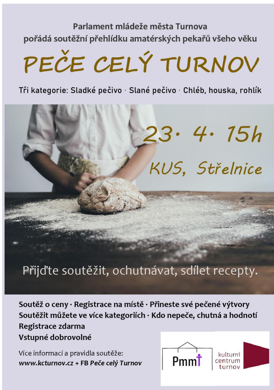
Obrázek 12 Plakát akce Peče celý Turnov

Parlament se zapojil také do přípravy městské kampaně A dost..., členové pomáhali s nastavením vizuálu kampaně. Členové se pravidelně scházeli a plánovali i menší akce jako například čištění mostu přes Jizeru v Dolánkách u Turnova.