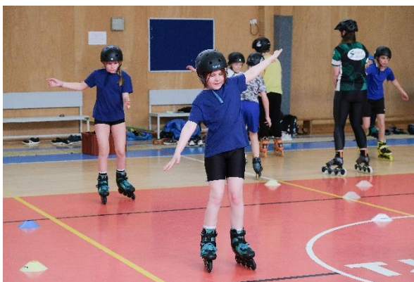
Obrázek 33 Programy pro turnovské školáky zaštiťuje odbor školství, kultury a sportu