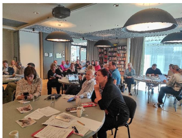
Obrázek 13 Aktivity projektu Zapojení veřejnosti do rozvoje obce

Po studijním pobyt koordinátorky Zdravého městě Turnov v norské municipalitě Fredrikstadt, a workshopech v roce 2022 následovaly další setkání realizátorů projektu v Kutné Hoře a v Říčanech u Prahy. V rámci projektu se rozběhla komunikační kampaň k tématu nových škol v Turnově. Proběhlo facilitované setkání rodičů i učitelů s tématem nové školy v Turnově II, odehrálo se anketní šetření k nové škole a na začátku roku 2024 se uskutečnilo komplexní šetření pro zjištění priorit obyvatel ORP v oblasti rozvoje škol v Turnově. Vyhodnocení proběhne v březnu 2024.