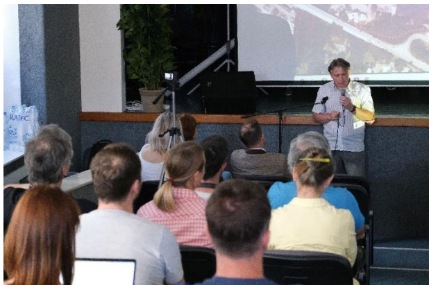
Obrázek 10 Veřejné setkání na téma budoucího rozvoje Koňského trhu