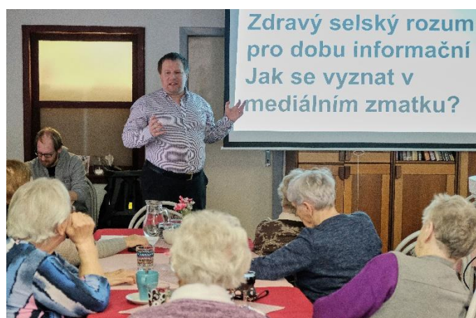
Obrázek 18 O mediální gramotnosti v Turnově - projekt městské knihovny a ICM

V rámci kampaně se odehrály jednorázové akce, byly podpořeny projekty neziskových organizací (Hlava v pohodě, OMG O mediální gramotnosti v Turnově), město Turnov finančně zaštitilo preventivní programy ve školách. Začala fungovat Kancelář prevence kriminality nebo Únikový východ Fokusu Turnov. Preventista městské policie Turnov realizovat přednášky pro rodiče, žáky i učitele turnovských škol.