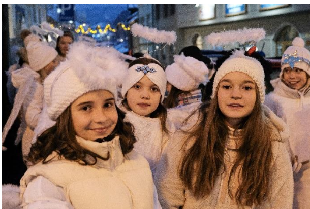
Obrázek 31 Rozsvícení vánočního stromku