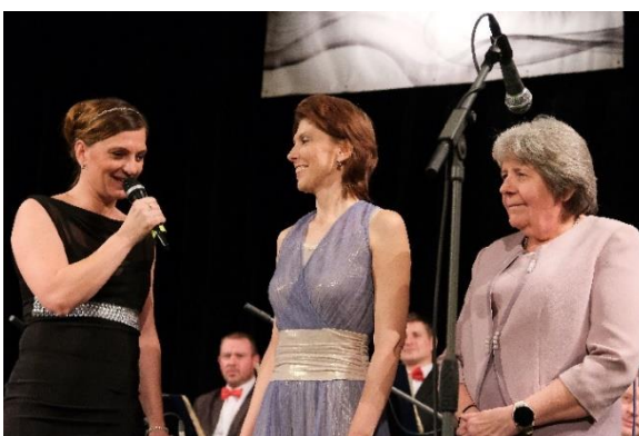
Obrázek 22 Městský ples 2023