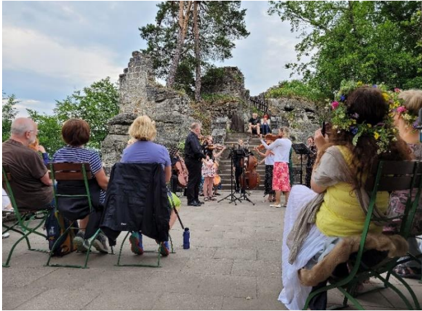
Obrázek 25 Evropský den hudby 2023 - na Valdštejně

Hravě jak žít zdravě (19. 5. 2023) - akce byla inspirována podobnou aktivitou Libereckého kraje, který se také stal hlavním partnerem turnovské verze. Stanoviště, která nabízela měření ukazatelů zdravotního stavu nebo velmi užitečné informace pro dobrou péči o vlastní zdraví, zaplnila Polyfunkční komunitní centrum Fokusu Turnov a jeho nejbližší okolí. Příjemnou atmosféru doplňovaly doprovodné přednášky nebo hudební produkce.