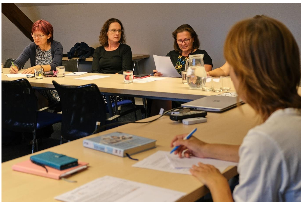
Obrázek 20 Setkání s metodiky prevence turnovských škol