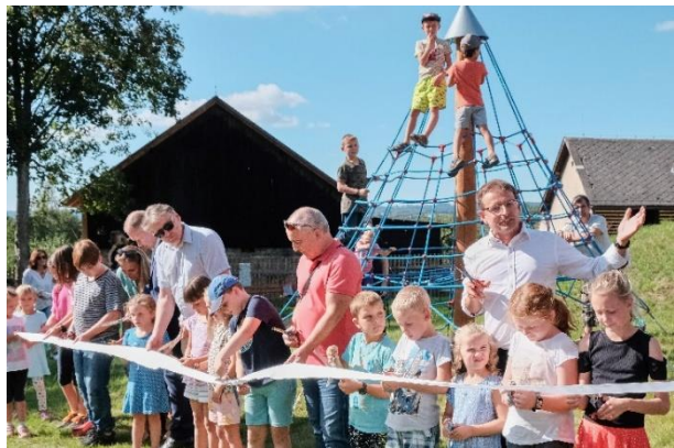
Obrázek 27 Zahradní slavnost v ZŠ Mašov

Evropský den hudby 2023 (21. 6. 2023) – první letní den hudebně odstartoval Turnovské kulturní léto. Po celém Turnově po celý den bylo možné zažít různé hudební žánry a často velmi netradičně prožít zajímavá vystoupení.