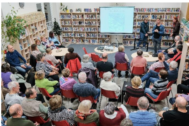
Obrázek 30 Sto let Nudvojevic v Turnově - přednáška, dílny pro děti, setkání místních