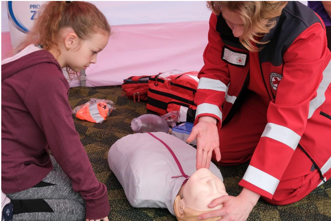
Obrázek 5 Místní skupina Českého červeného kříže na akci Hravě jak žít zdravě