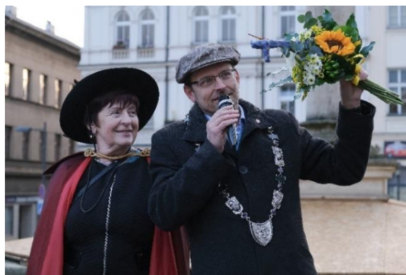
Obrázek 23 Předání klíče od města na Noci s Andersenem