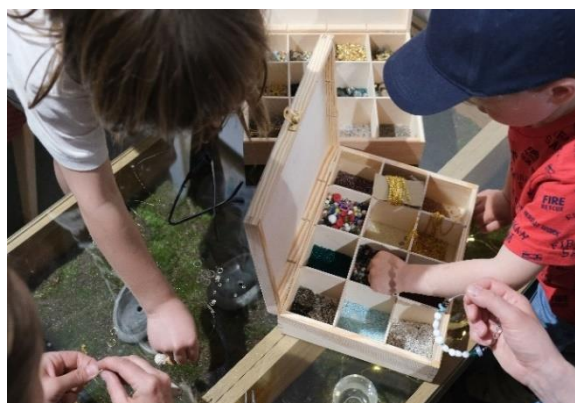
Obrázek 24 Workshopy v Uličce řemesel – slavnostní otevření rekonstruované pasáže