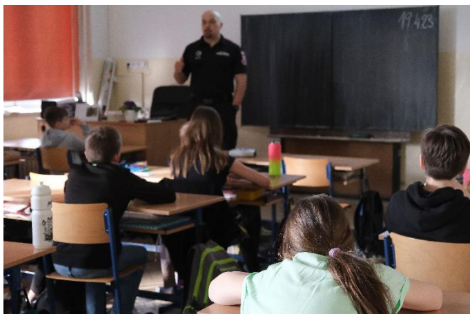
Obrázek 17 Přednáška preventisty MP Turnov pro žáky ZŠ

Jedná se o kampaň města Turnova pro rok 2023, která je zaměřená na aktuální témata závislostí a psychického zdraví. Zrodila se ve spolupráci výboru pro rodinnou politiku, odboru školství, kultury a sportu, odboru sociálních věcí Městského úřadu Turnov, Městské policie Turnov i turnovských organizací, základních a středních škol nebo Parlamentu mládeže města Turnov.