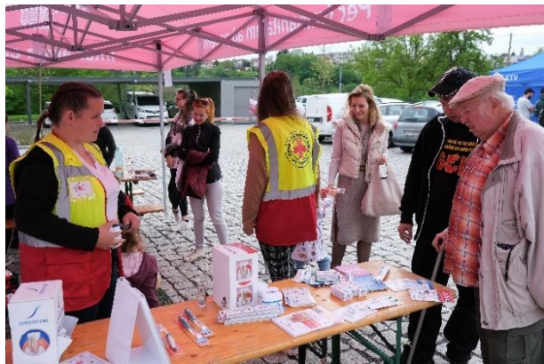
Obrázek 26 Hravě jak žít zdravě - stánek o dentální prevenci

Hravě jak žít zdravě (19. 5. 2023) - akce byla inspirována podobnou aktivitou Libereckého kraje, který se také stal hlavním partnerem turnovské verze. Stanoviště, která nabízela měření ukazatelů zdravotního stavu nebo velmi užitečné informace pro dobrou péči o vlastní zdraví, zaplnila Polyfunkční komunitní centrum Fokusu Turnov a jeho nejbližší okolí. Příjemnou atmosféru doplňovaly doprovodné přednášky nebo hudební produkce.