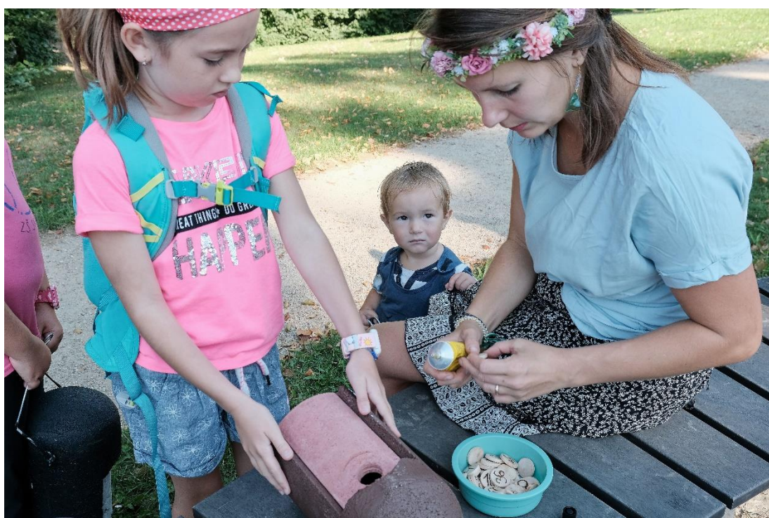
Obrázek 14 Věšení ptačích budek v městských sadech proběhlo komunitně