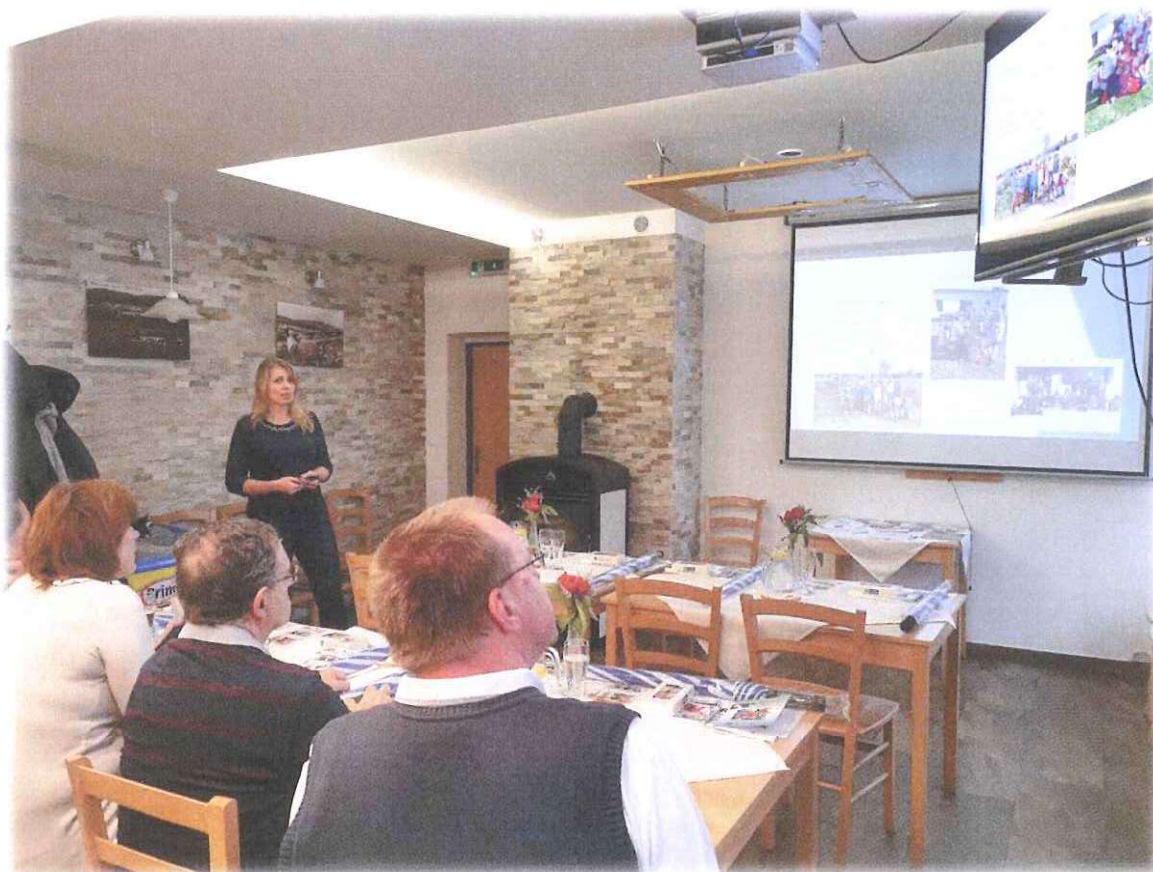
Fotografie z Obhajoby a kontroly na místě

Obec i v tomto roce realizovala řadu zajímavých projektů a aktivit (viz dále). Po kontrole na místě a obhajobě v získaly Křižánky opět kategorií B v hodnocení MA21.