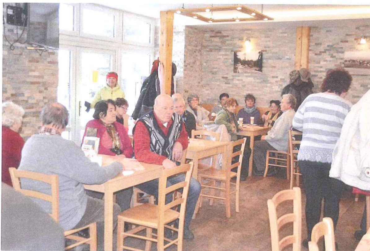
Kavárnička dříve narozených