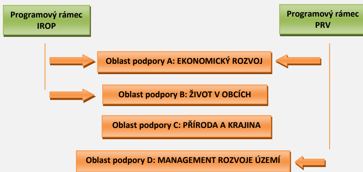
Obr. 1 Přehled programových rámců oblastí podpory SCLLD

Pro každý relevantní operační program pro období 2014 - 2020 podporovaný z Evropských strukturálních a investičních fondů, může být na základě rozhodnutí aktérů v území zpracován samostatný Programový rámec. MAS Střední Vsetínsko, z.s. zpracovala Programový rámec IROP a Programový rámec PRV. Celkem 8 opatření (resp. 5 fichí a 3 opatření) programových rámců naplňuje cíle a opatření Strategie komunitně vedeného místního rozvoje MAS Střední Vsetínsko, z.s. 2014 - 2020 „ Střední Vsetínsko kráčí správným směrem. “ V rámci aktivit SCLLD bude na území MAS realizován také Místní akční plán rozvoje vzdělávání ve správním obvodu obce s rozšířenou působností Vsetín.