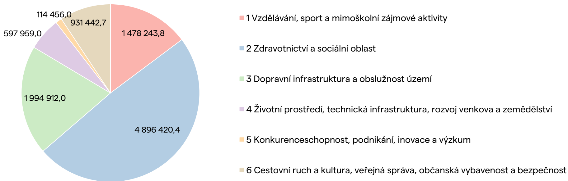
Graf 1 Financování jednotlivých prioritních os v AP SRJMK 2024–2025 - celkový rozpočet (v tis. Kč)

Stejně jako v předchozím AP SRJMK z let 2022–2023 se nejvyšší finanční plnění očekává v prioritní ose 2: Zdravotnictví a sociální oblast, téměř 5 mld. Kč. Druhou finančně nejnáročnější prioritní osou je Dopravní infrastruktura a obslužnost území s téměř 2 mld. Kč. Bližší rozpis včetně finanční alokace na jednotlivé specifické cíle se nachází v Tabulka 7.