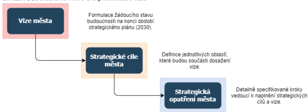
Obrázek 2 Struktura návrhové a implementační části

Strategické vize, programové cíle a strategická opatření jsou dále v tomto dokumentu tříděna dle nadřazených strategických oblastí, respektive prioritních os. Následující schéma zobrazuje přehled prioritních os a strategických oblastí města Hlučína pro období 2020-2030. Z níže uvedeného je zřejmé, že se strategický plán opírá o sedm prioritních os rozvoje města Hlučína, která jsou rozdělena do dvou tematických oblastí. První oblast tvoří témata Doprava a infrastruktura a životní prostředí, kultura a sport, bydlení školství, zdravotní a sociální služby a poslední oblast, bezpečnost.