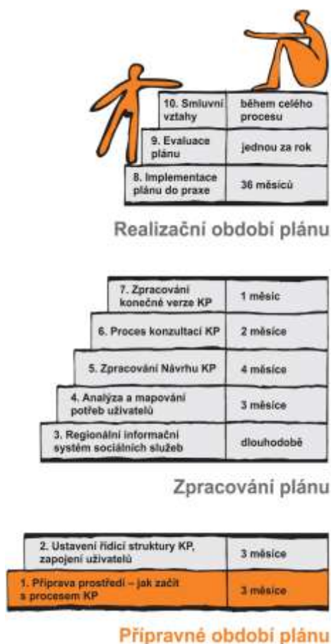
Obrázek 2: Deset kroků komunitního plánování