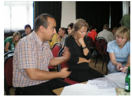
I. Veřejné setkání 17.dubna 2007

Dokument se stane součástí Strategického plánu rozvoje města Mladá Boleslav a bude podkladem pro vytvoření efektivního plánování a zkvalitňování potřebných sociálních služeb. Podporovány by měly být i služby související.