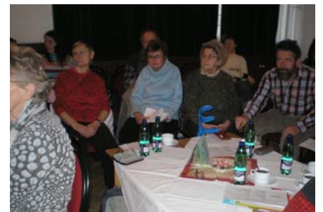
II. Veřejné setkání 28. listopadu 2007