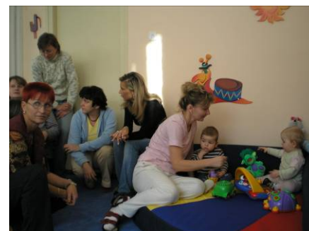
Pracovní skupina Rodina, děti a mládež