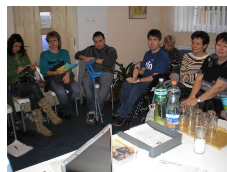
Pracovní skupina v Centru pro zdravotně postižené