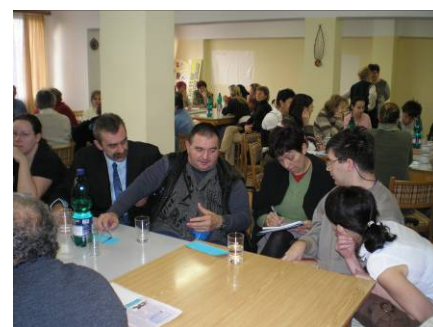
SWOT analýza ze dne 16.ledna 2007