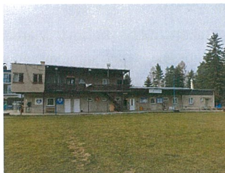
Provozní budova v areálu SK Vyžlovka