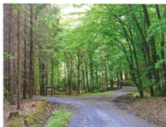
NPR Voděradské bučiny