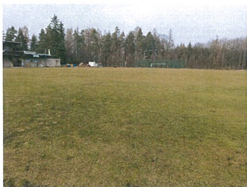
Travnaté hřiště SK Vyžlovka