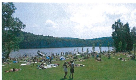
Pláž s molem v areálu koupaliště Vyžlovka