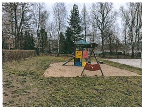
Dětské hřiště v areálu koupaliště Vyžlovka