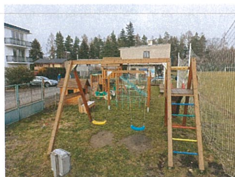
Dětské hřiště v areálu SK Vyžlovka