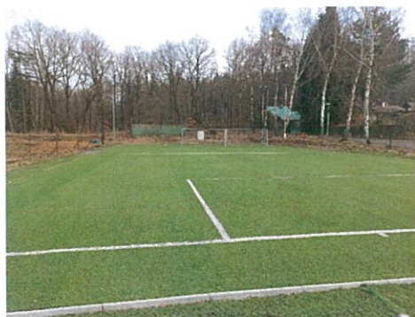
Hřiště s umělým povrchem SK Vyžlovka