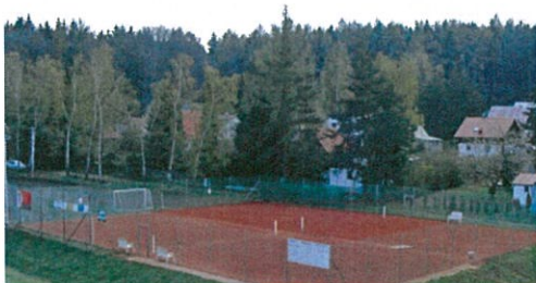
Tenisové kurty v areálu SK Vyžlovka