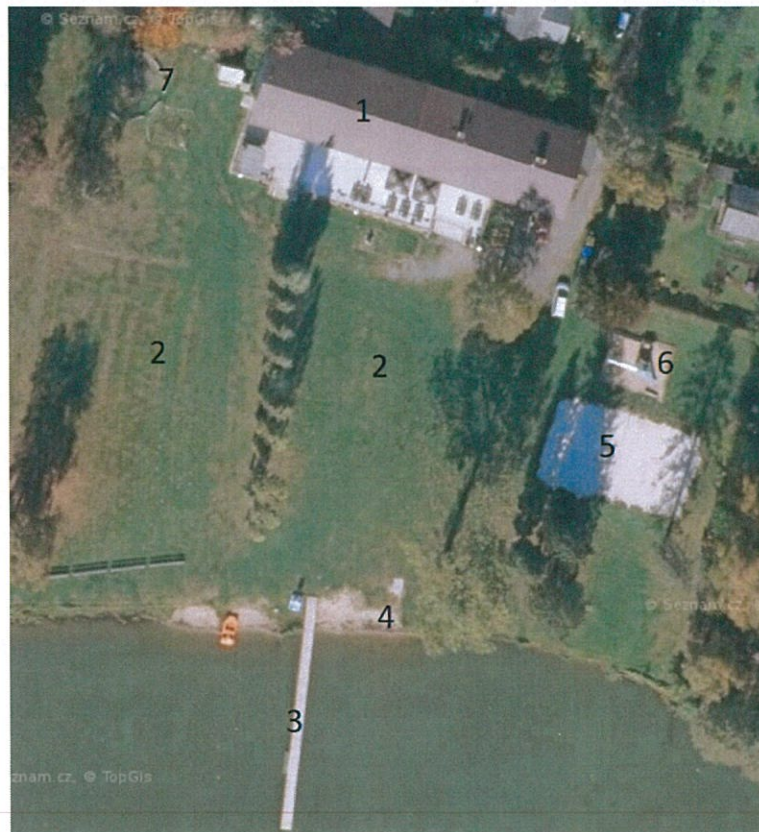
Letecký snímek areálu koupaliště Vyžlovka – zdroj: www.mapy.cz , upraveno