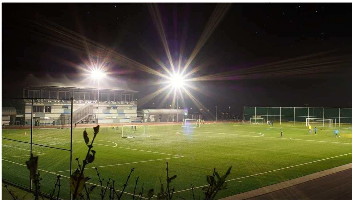
Obr. č. 3 Fotbalový stadion