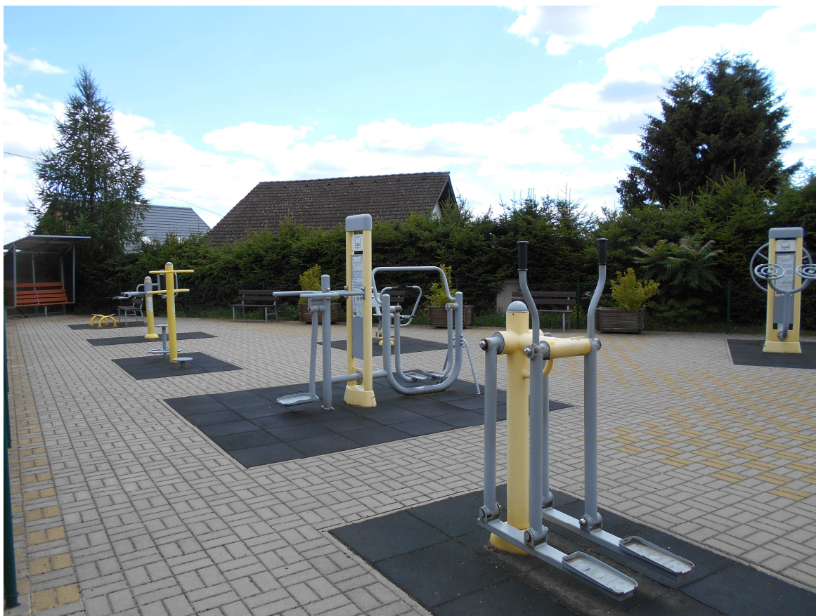
Obr. č. 2 Hřiště pro seniory

Vrchlabí má dlouholetou tradici ve výchově a vedení dětí a mládeže ke kladnému vztahu ke sportu, která vyústila výchovou talentů. Sportovci naše město reprezentují i na světové úrovni. Tuto tradici má zájem město dále rozvíjet. Další prioritou města Vrchlabí je podpora aktivit všech občanů, kteří chtějí sport provozovat rekreačně, a to bez ohledu na věk či handicap.