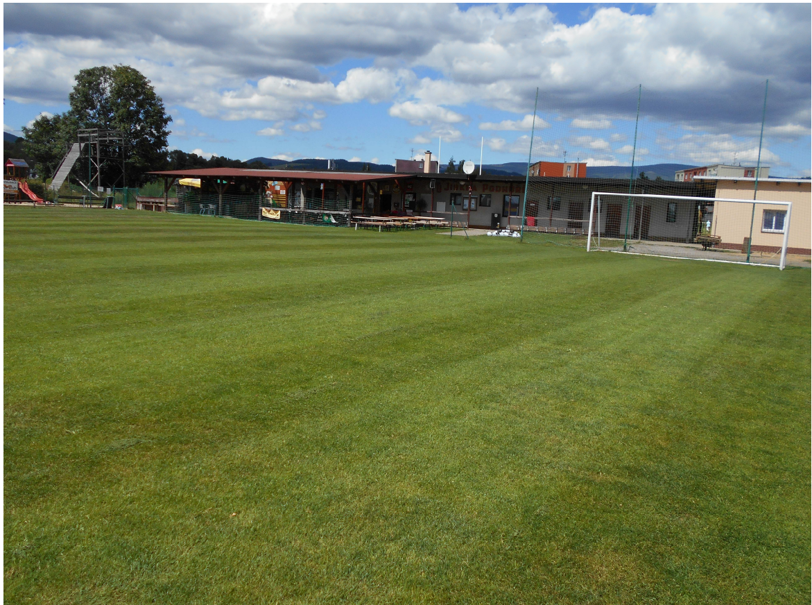
Obr. č. 6 Fotbalové hřiště Podhůří

Orientační běh - Český pohár, Mistrovství ČR, Mistrovství Evropy v LOB, Mistrovství ČR v nočním orientačním běhu, krajské soutěže Powerlifting – národní a mezinárodní soutěže Rugby – republikové soutěže, účast v repre týmech Sjezdové lyžování – vrcholné závody mládeže na všech úrovních, Mistrovství ČR, účast na mezinárodních závodech Sport pro všechny – pětiboj, čtyřboj - krajská úroveň, republikové soutěže Sportovní gymnastika – okresní soutěže, krajské soutěže, Mistrovství ČR Střelba – vrcholné závody mládeže na všech úrovních Kušelky – 1. liga ČR, Krajský pohár Stolní tenis – regionální úroveň Šachy – okresní soutěže, krajské soutěže Tenis – krajské soutěže Volejbal – regionální úroveň Zimní a letní Olympiáda dětí a mládeže – sportovci z Vrchlabí se pravidelně zúčastňují a reprezentují Královéhradecký kraj