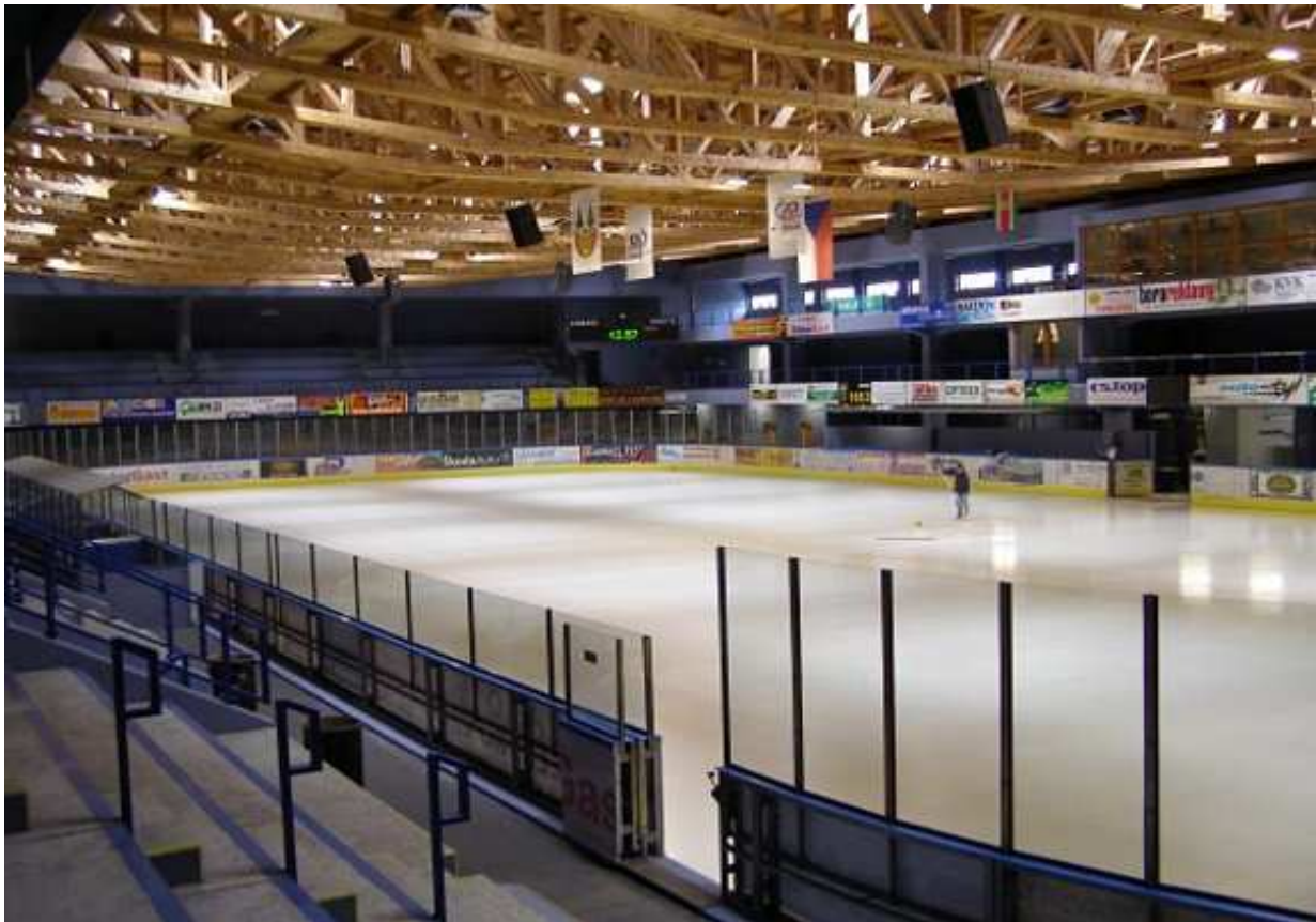
Obr. č. 4 Hokejový stadion