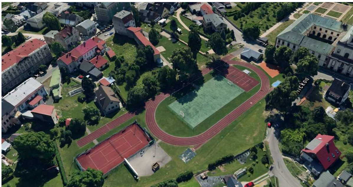
Obr. č. 9 Sportovní areál manželů Zátopkových

Dotčené subjekty: mládež, obyvatelé města a okolních obcí, turisté