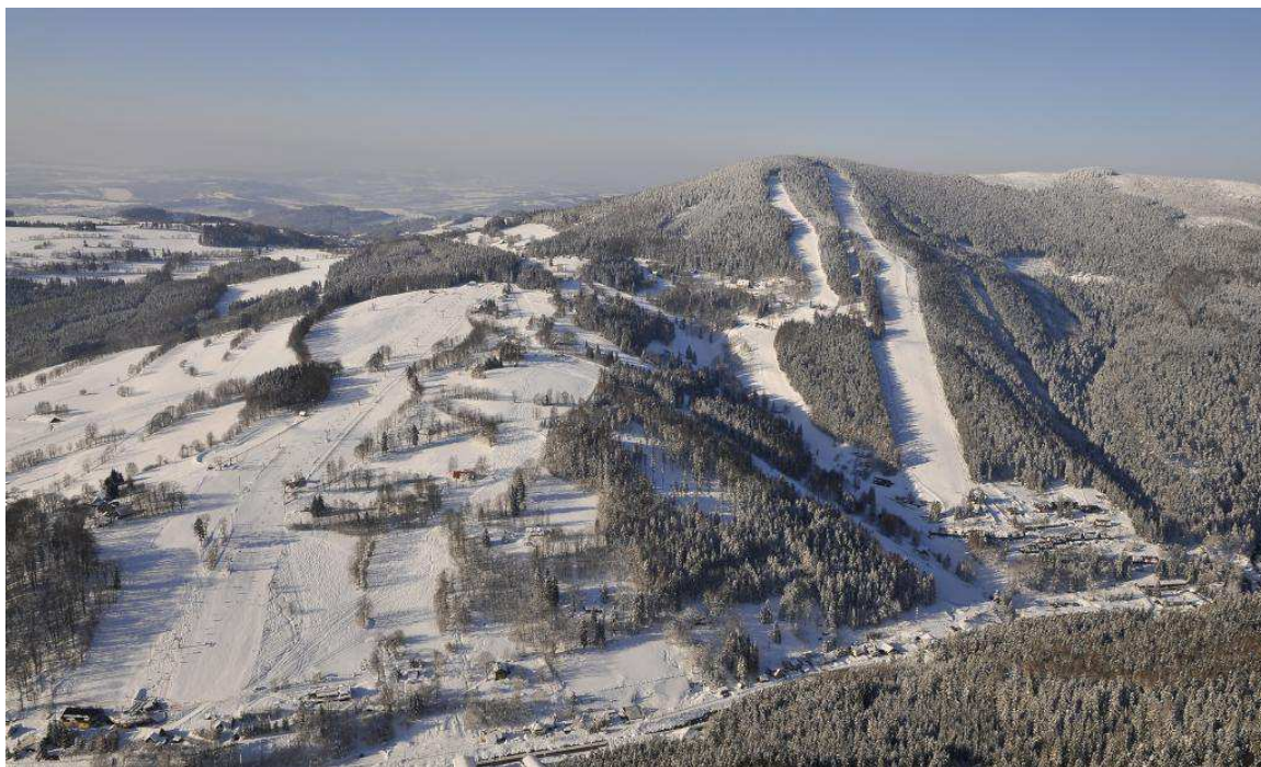
Obr. č. 11 Lyžařský areál Herlíkovice

Město Vrchlabí mimo to spolupracuje s místními firmami v oblasti rekonstrukcí sportovišť, včetně těch školních. Podařilo se takto podpořit rekonstrukci hřiště na Liščím kopci, v letošním roce vznikne v areálu za podpory místního podniku workoutová sestava. Další sponzor zainventoval výstavbu speciálních posilovacích strojů pro naše seniory. Za podpory sponzorů se vybudoval i nový fotbalový areál.