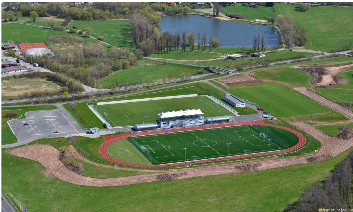
Obr. č. 1 Sportovní areál Vejsplachy

Vytváření podmínek pro sport patří mezi hlavní úkoly obce. Legislativa upravuje podmínky pro rozvoj sportu zákonem č. 115/2001 Sb., zákon o podpoře sportu, ve znění pozdějších předpisů.