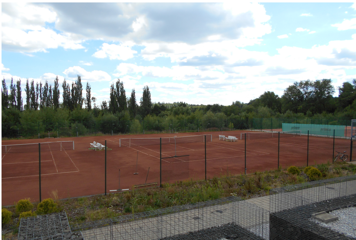
Obr. č. 7 Tenisové kurty Vejsplachy

* Tabulka byla sestavena na základě podkladů k žádostem o dotace