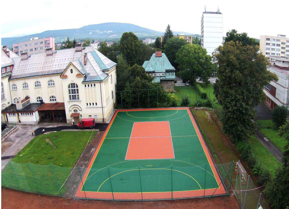
Obr. č. 8 Hřiště v areálu Gymnázia

Oblast Krkonoš je velmi specifická. Samy hory nabízejí možnost sportovního vyžití. V minulosti nebylo třeba více lidem nabízet. Dnešní doba však chce daleko více, než turistiku po horách. Lidé jsou zvyklí na určitý komfort. Obec, která toto nabízí, je i turisticky zajímavá a sportovní zázemí tvoří spolu s kvalitním ubytováním a stravováním ucelený nedílný celek.