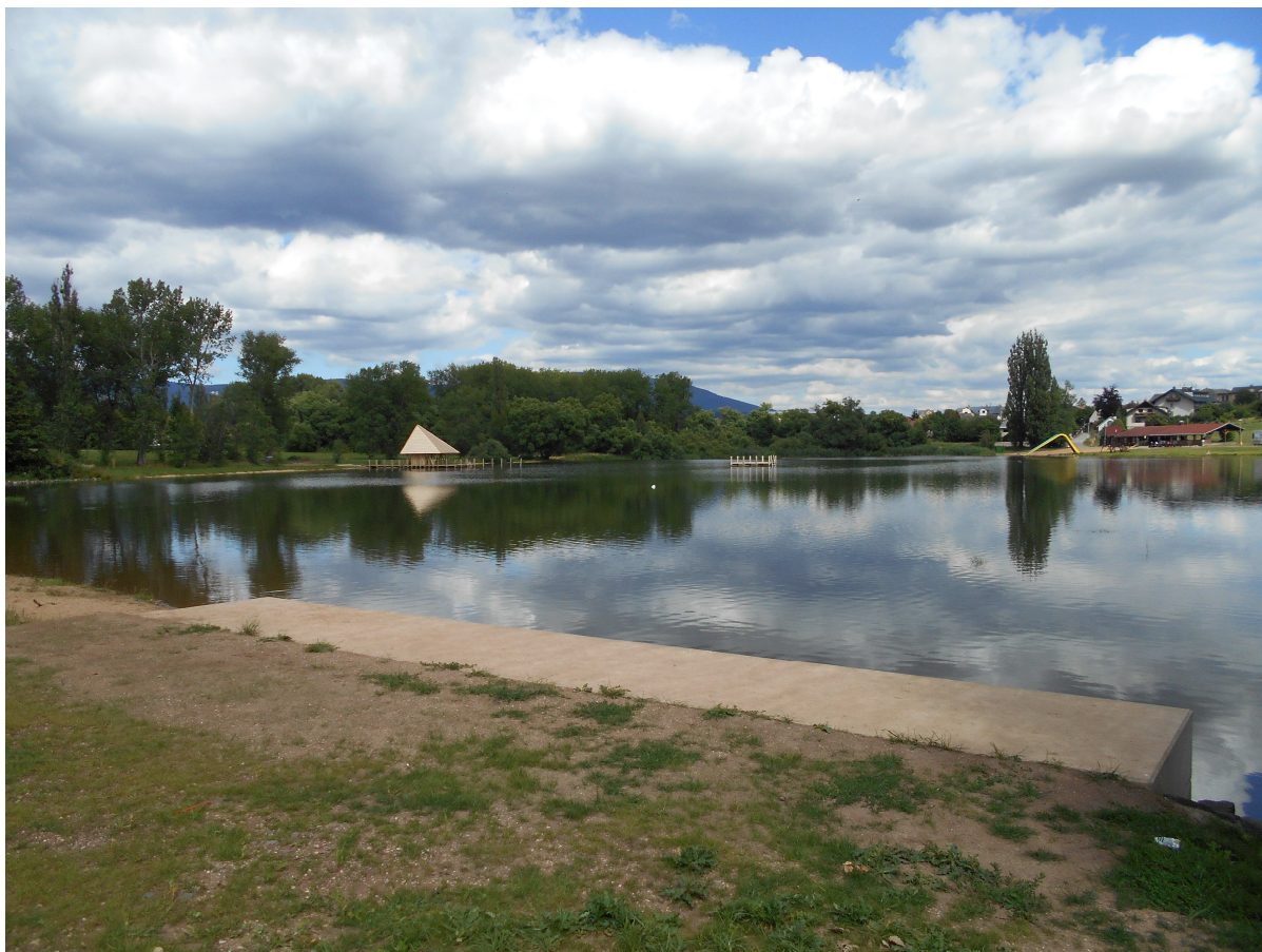
Obr. č. 5 Rybník Kačák

Michal Krčmář – stříbrný olympionik v biatlonu