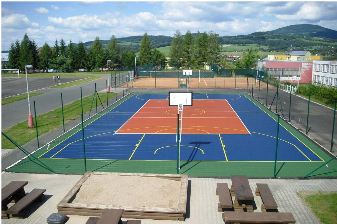
Obr. č. 10 Sportovní areál Liščí kopec

Dotčené subjekty: handicapovaná mládež, obyvatelé města a okolních obcí