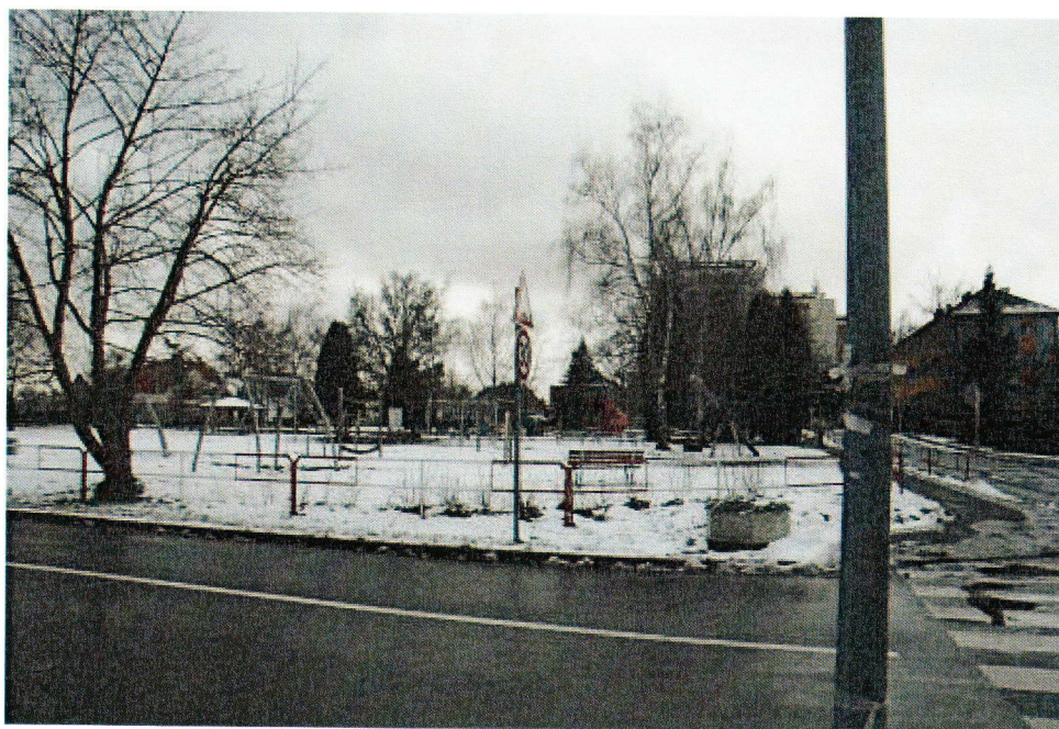
Předpokládaný záběr kamery

Návrh na umístění: kamera by mohla být umístěna na sloupu veřejného osvětlení n č. 915380;