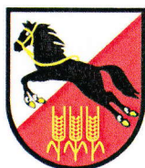
Městská část Praha 20 - Odbor sociálních věcí a školství

Zástupce MO Policie ČR je členem Bezpečnostní rady MČ Praha 20. Dále jsou zástupci MO PČR v pravidelném kontaktu se sociálními pracovníky odboru sociálních věcí a školství. V rámci prevence kriminality se realizují přednášky a besedy o této problematice na místních školách. MO Policie ČR také poskytuje analytická data týkající se trestné činnosti a pro potřeby programu prevence kriminality MČ Praha 20 vyhotovuje analýzu trestné činnosti.