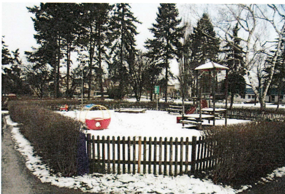
Objekt zabezpečení kamerovým systémem

Návrh na umístění: kamera by mohla být umístěna na sloupu veřejného osvětlení;