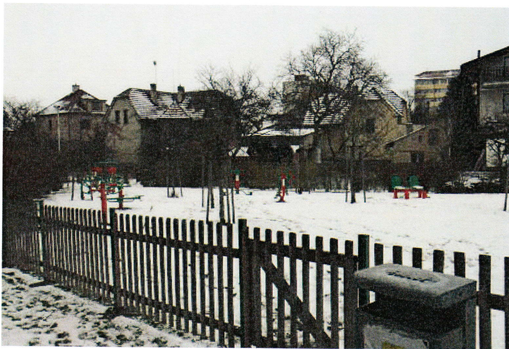
Objekt zabezpečený kamerovým systémem

Návrh na umístění: kamera by mohla být umístěna na objektu zdravotního střediska;