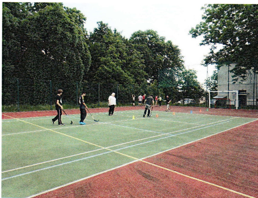
Objekt zabezpečení kamerovým systémem