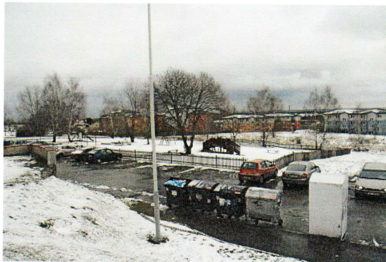
Objekt zabezpečení kamerovým systémem

Návrh na umístění: kamera by mohla být umístěna na sloupu veřejného osvětlení;