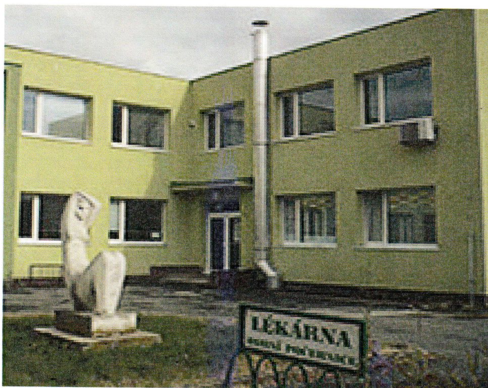
Předpokládaný záběr do areálu Zdravotnického střediska