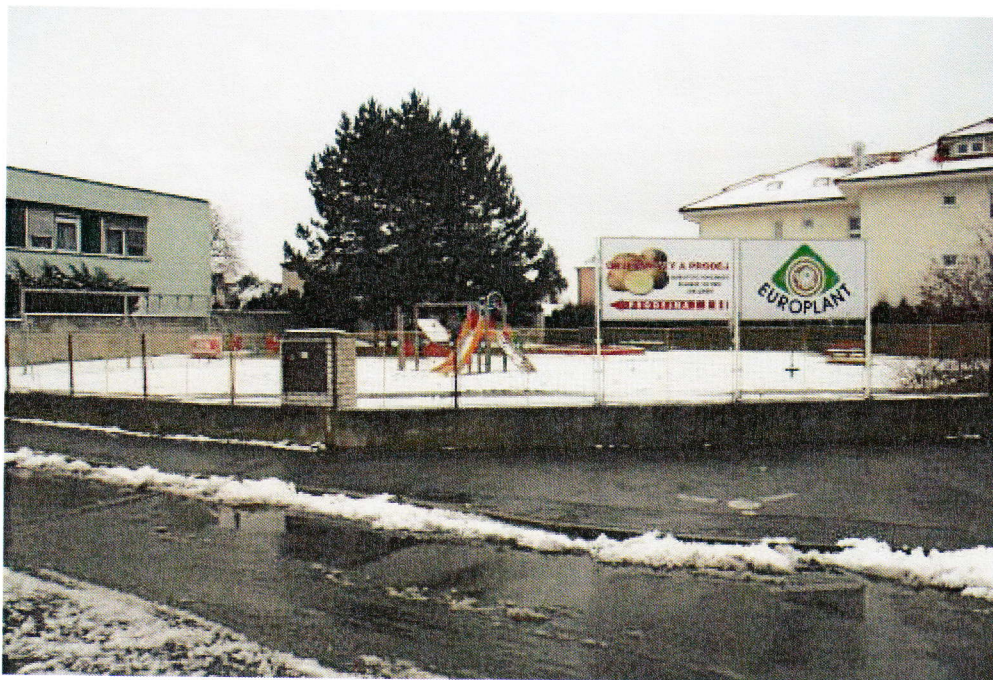
Objekt zabezpečený kamerovým systémem

4) Umístění kamery: Běluňská x Jívanská;