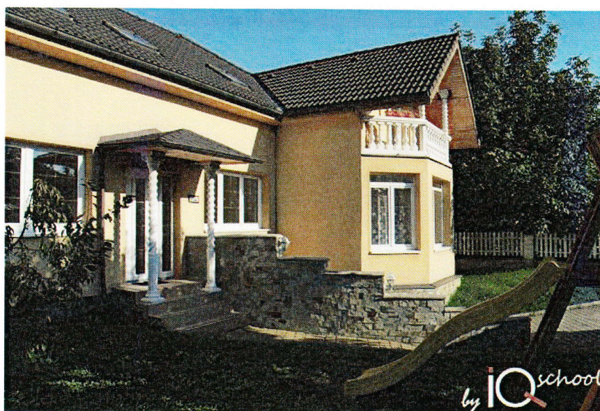
Objekt zabezpečení kamerovým systémem

Návrh na umístění: kamera by mohla být umístěna na sloupu veřejného osvětlení;