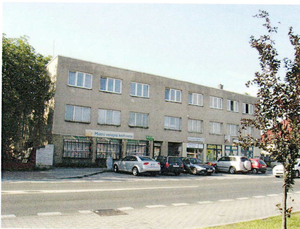
Objekt zabezpečení kamerovým systémem

Návrh na umístění: kamera by mohla být umístěna na sloupu veřejného osvětlení;