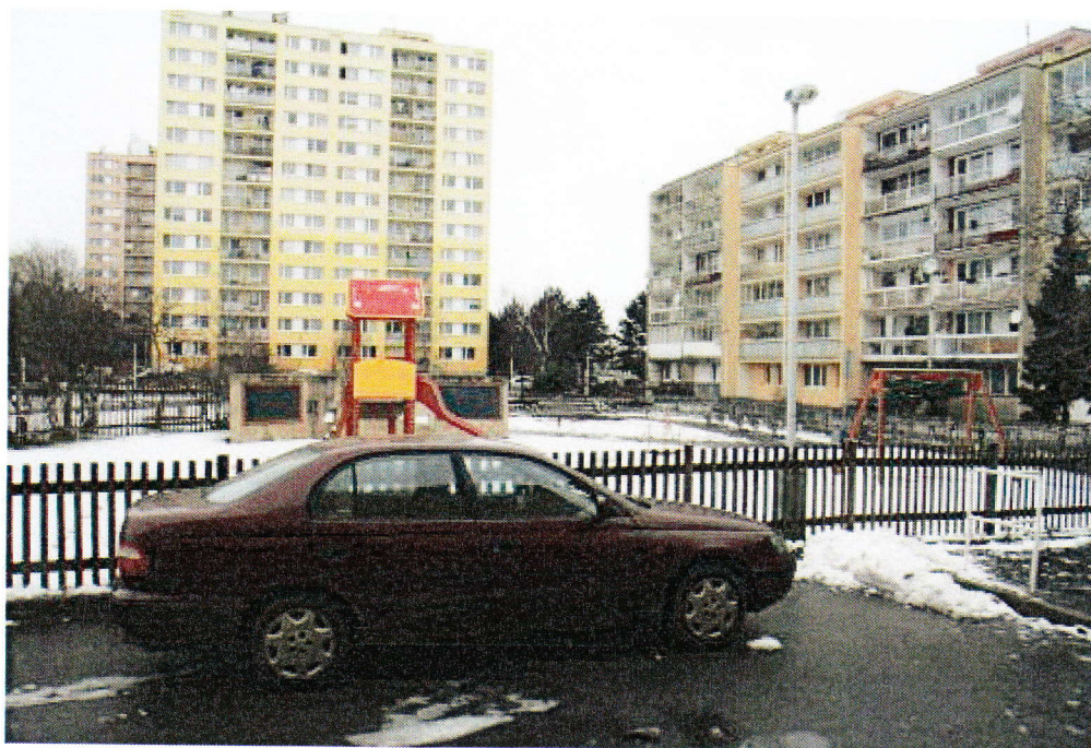
Předpokládaný záběr kamery na hřiště