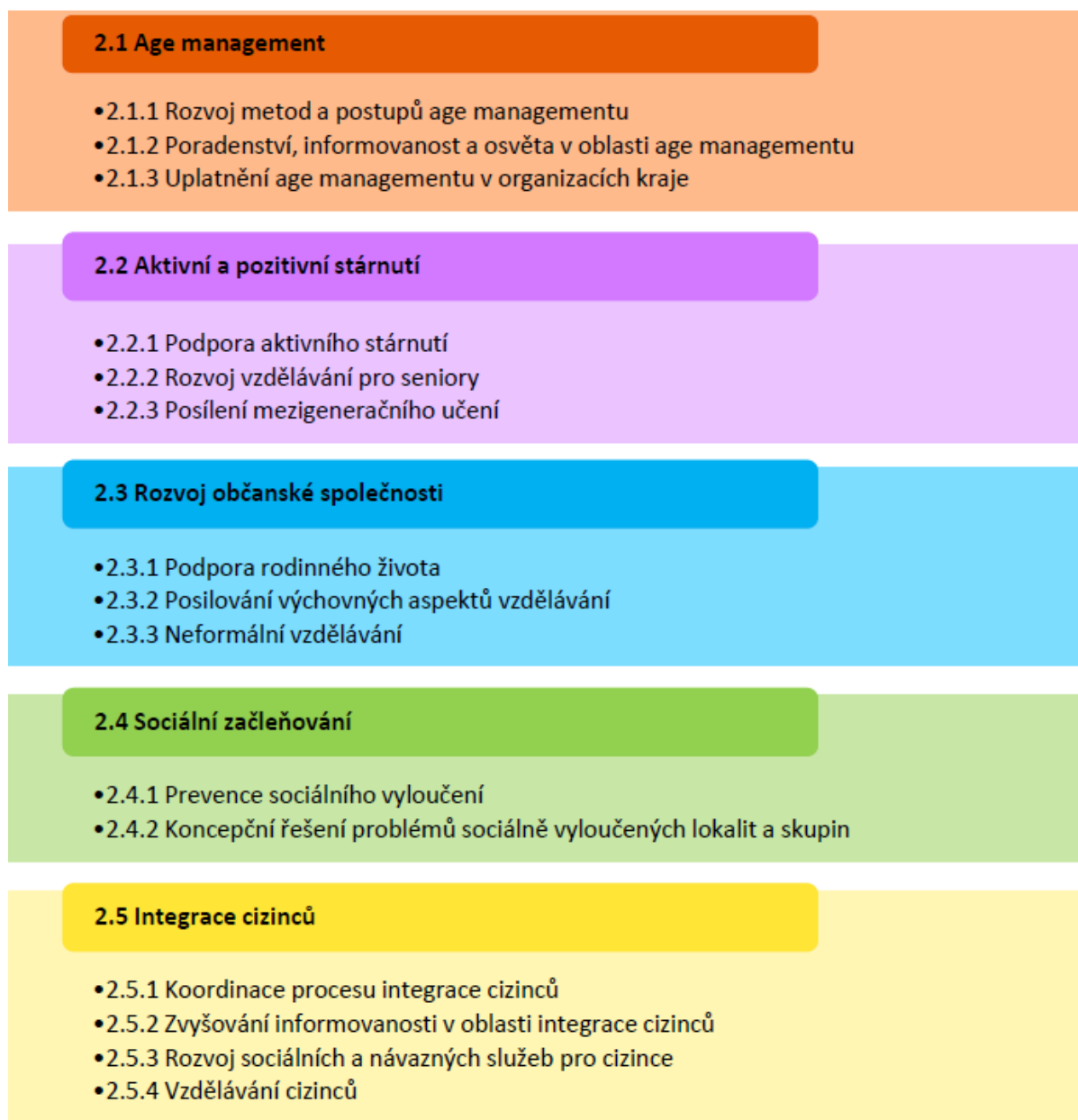
Obrázek 2: Okruhy a strategická opatření prioritní osy 2. Rozvoj lidského potenciálu a sociální začleňování