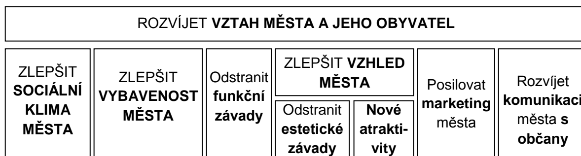
Schéma: Principy rozvoje města Dobřany

Podobně jako v předchozím Programu jsou uplatněny principy zaměřené na vzhled města, jeho fungování a vybavenost, a také marketing. Jak již bylo řečeno, tyto principy se osvědčily a lze předpokládat, že také pro rozvíjení vztahu města a jeho obyvatel jsou nezbytnými předpoklady.