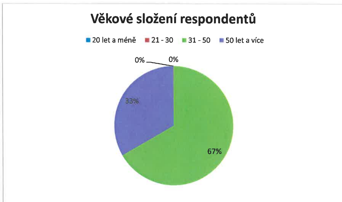
Obrázek č. 2 Věkové složení respondentů