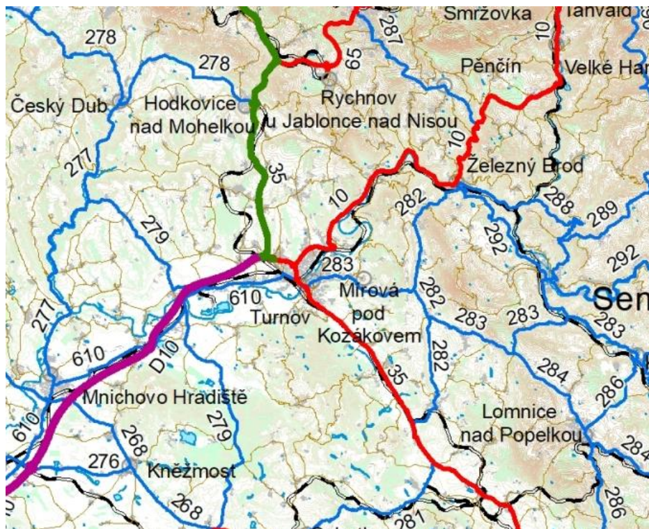
Obrázek 2: Mapa silniční sítě