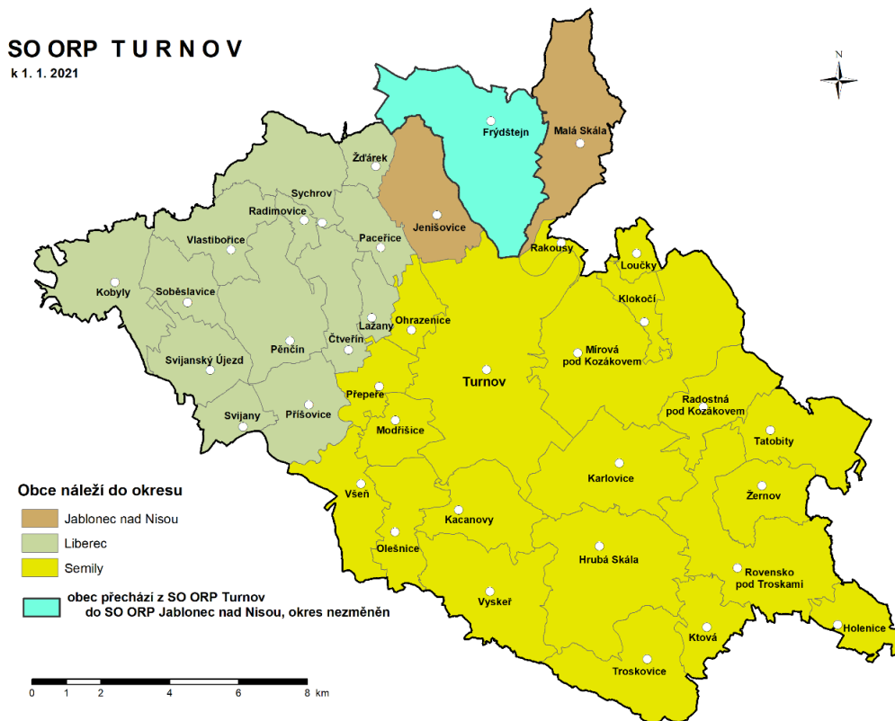
Obrázek 1: Správní obvod ORP Turnov

V rámci Libereckého kraje je správní obvod ORP Turnov se svými 33,8 tis obyvateli na čtvrtém místě po Liberci, České Lípě a Jablonci nad Nisou. Přehled obcí je uveden v Tab.