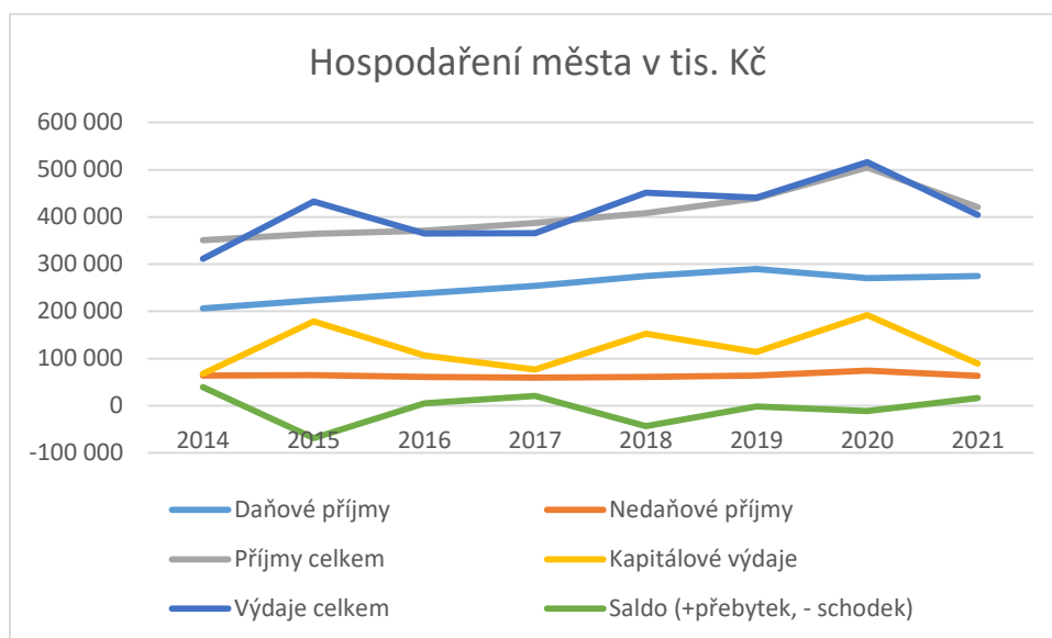
Graf 3: Vývoj hospodaření města v období 2014-2021