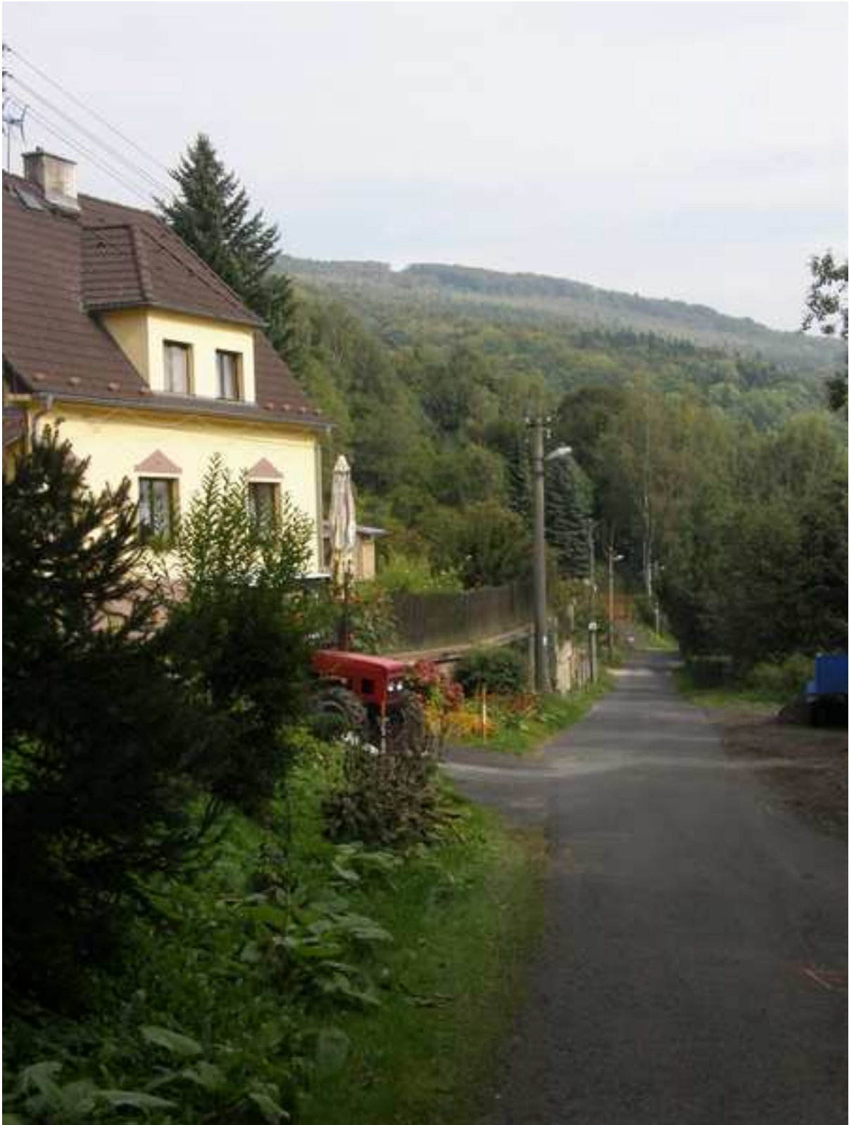
12 – místní část Liboňov