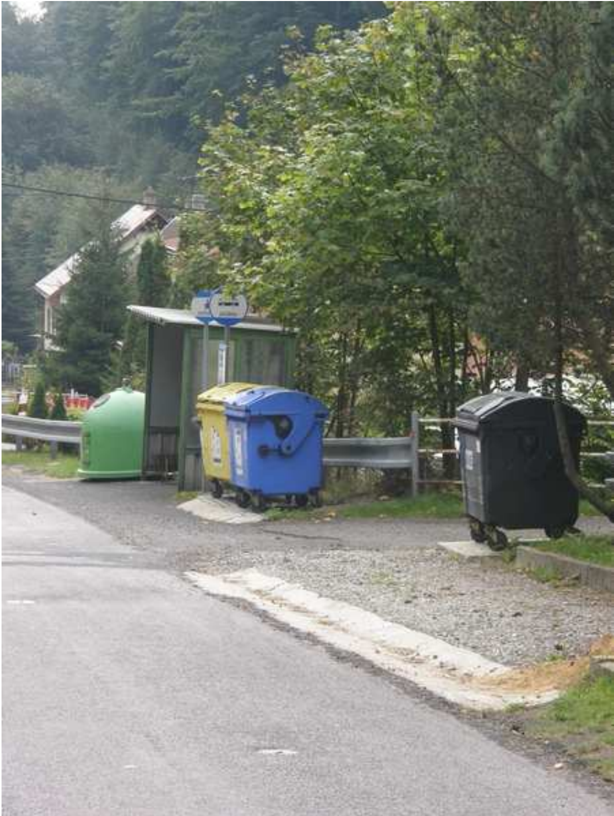
4 – prostor u autobusové zastávky