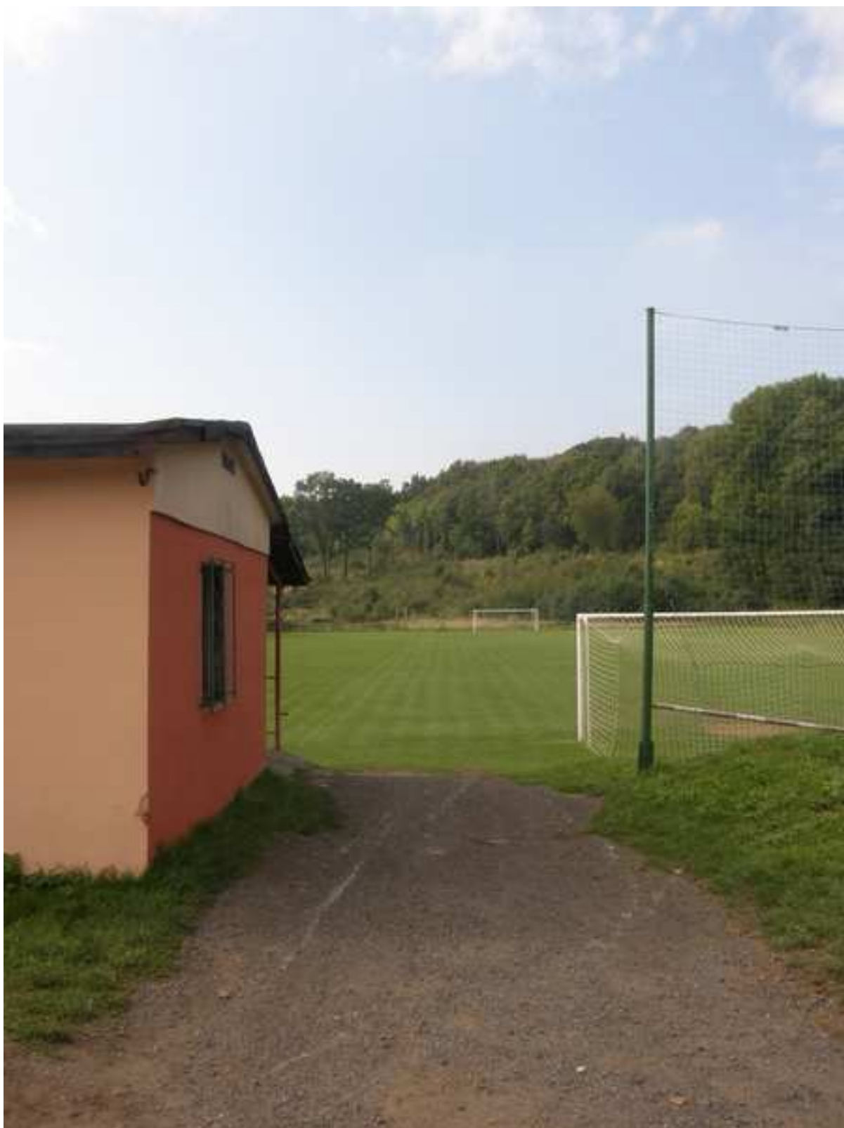
17 – fotbalové hřiště