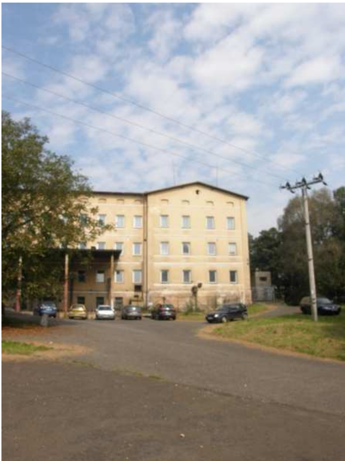
21 – největší zaměstnavatel v obci