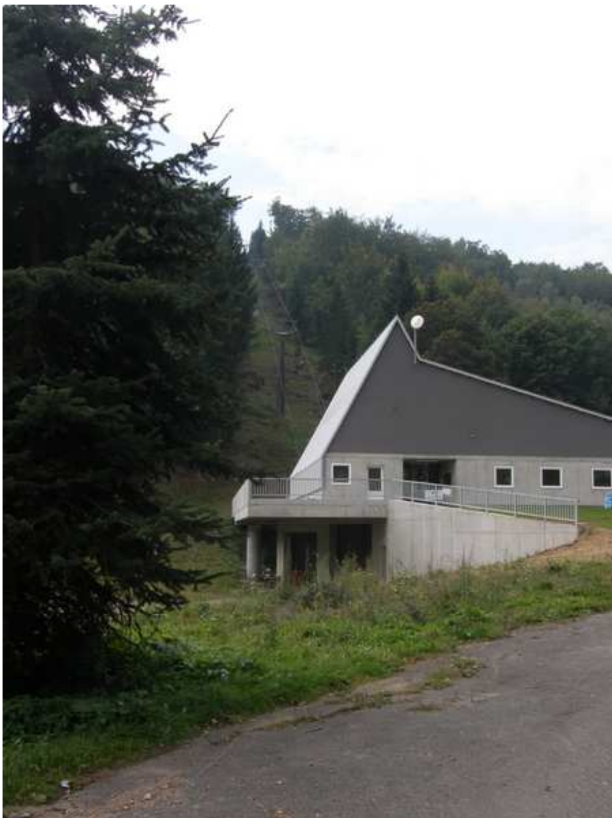
1 – areál zimních sportů