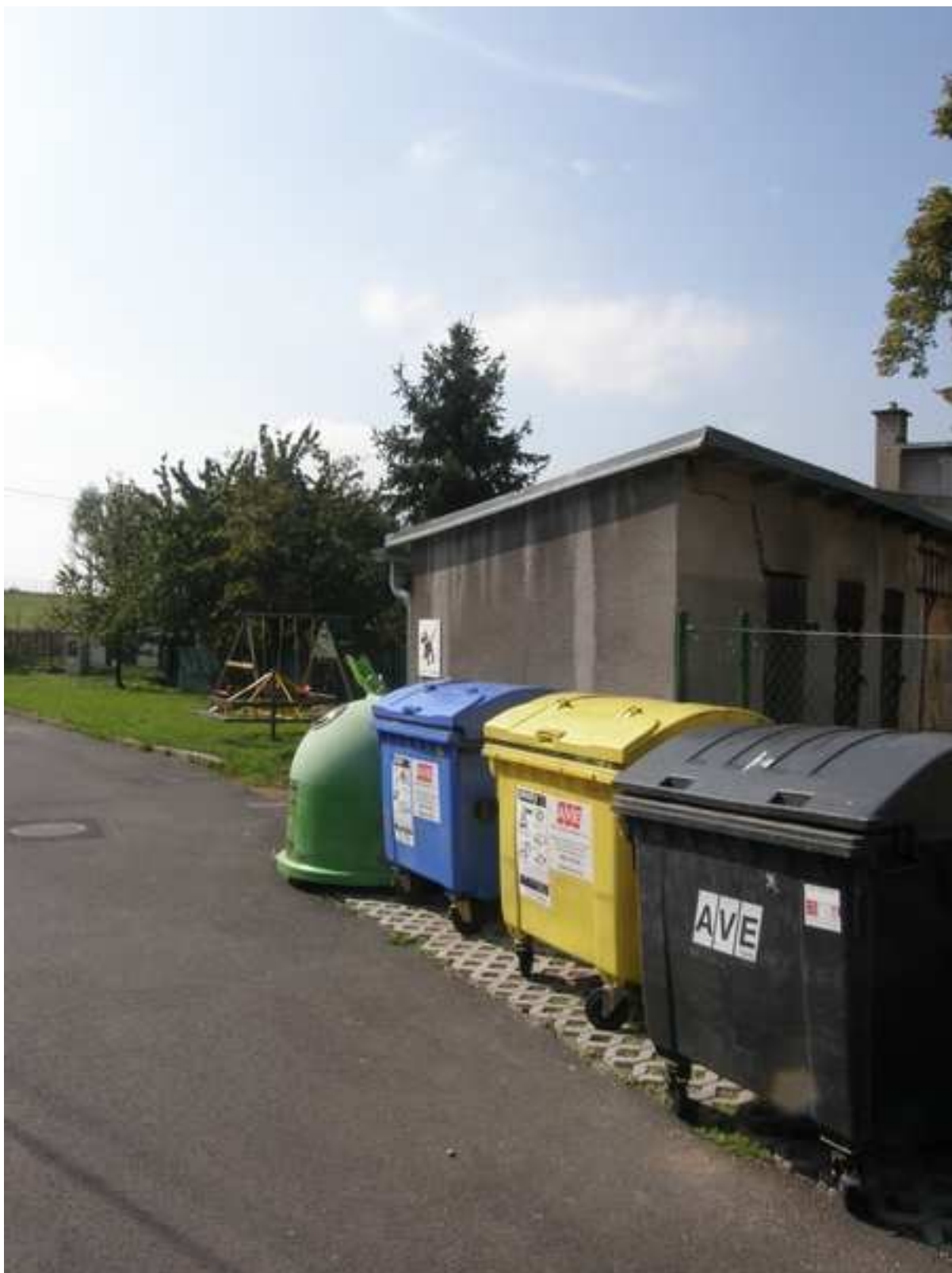
27 – odpadové hospodářství v okrajové části obce