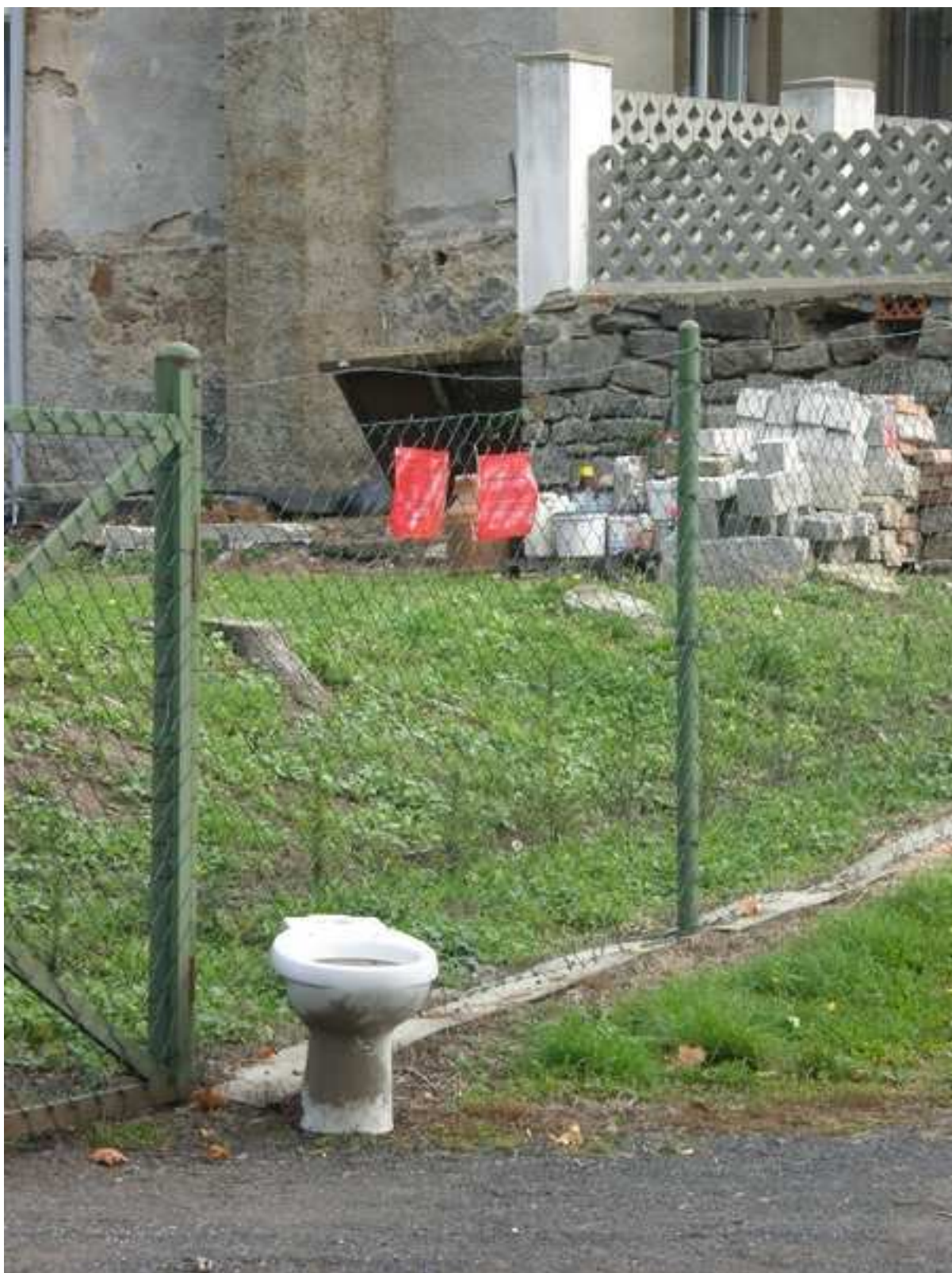
14 – sběrný dvůr