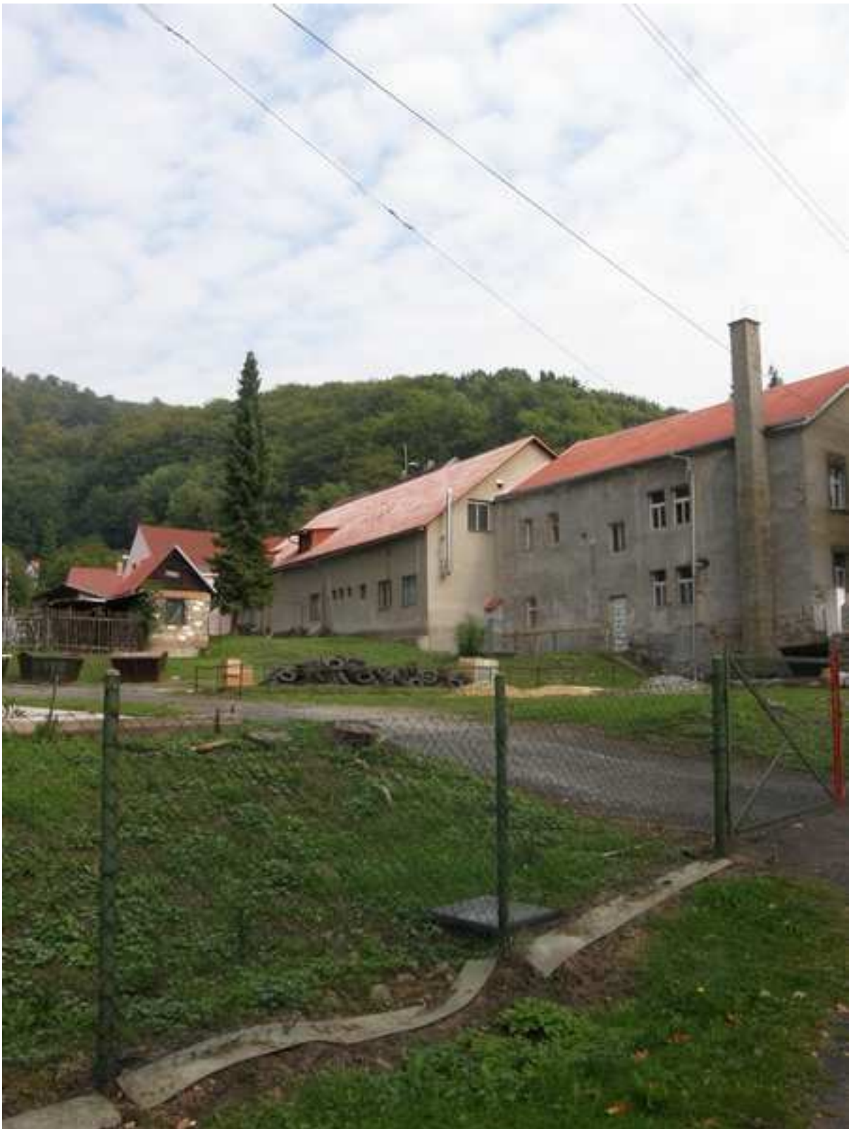
13 – sběrný dvůr