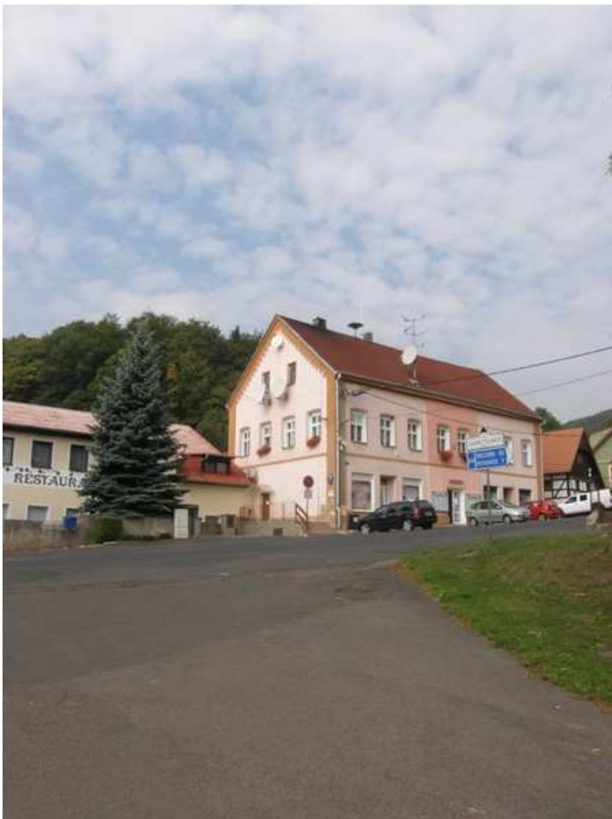
8 – prostor před obecním úřadem