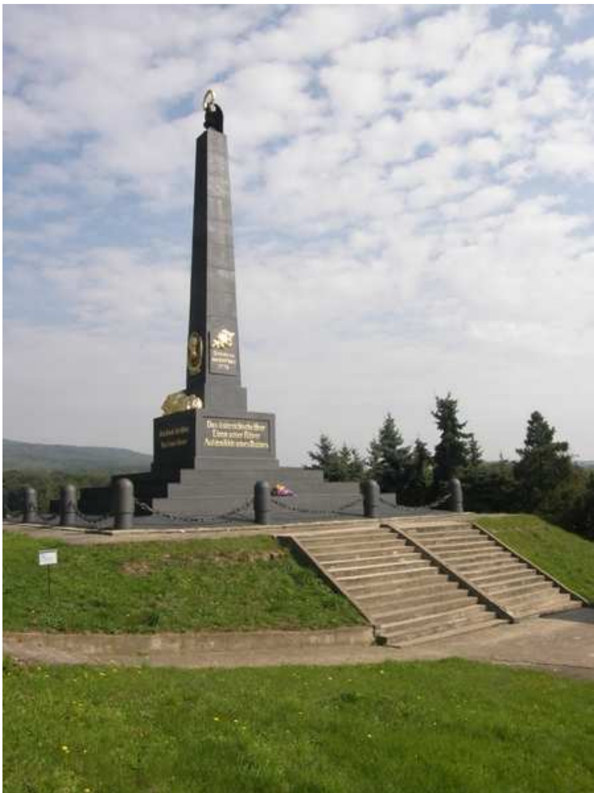
24 – turisticky významný objekt v obci