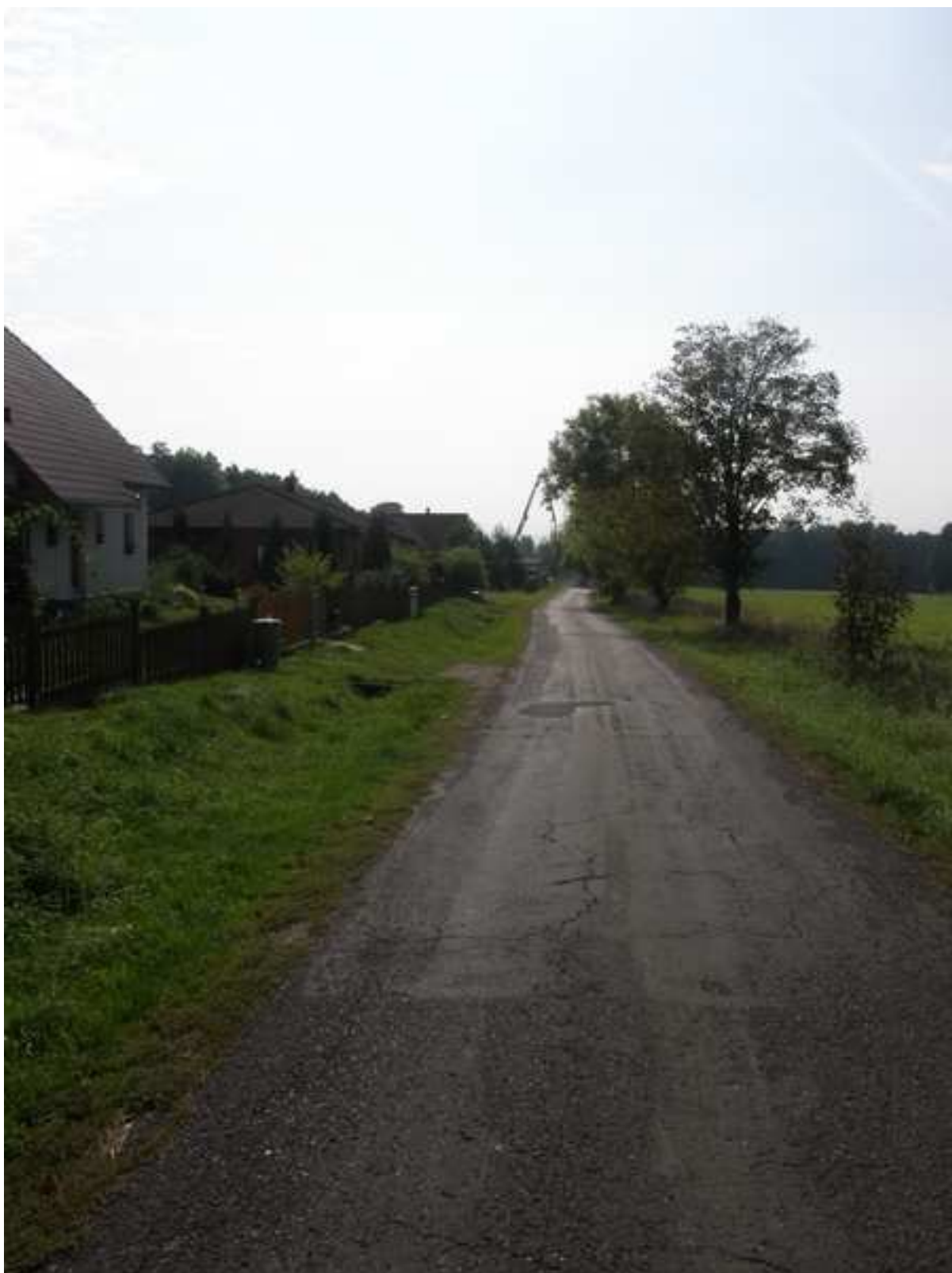
22 – prostor pro územní rozvojové aktivity