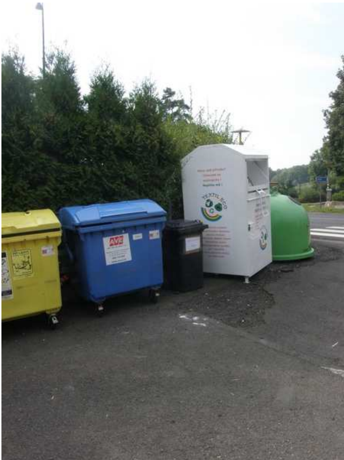
11 – odpadové hospodářství