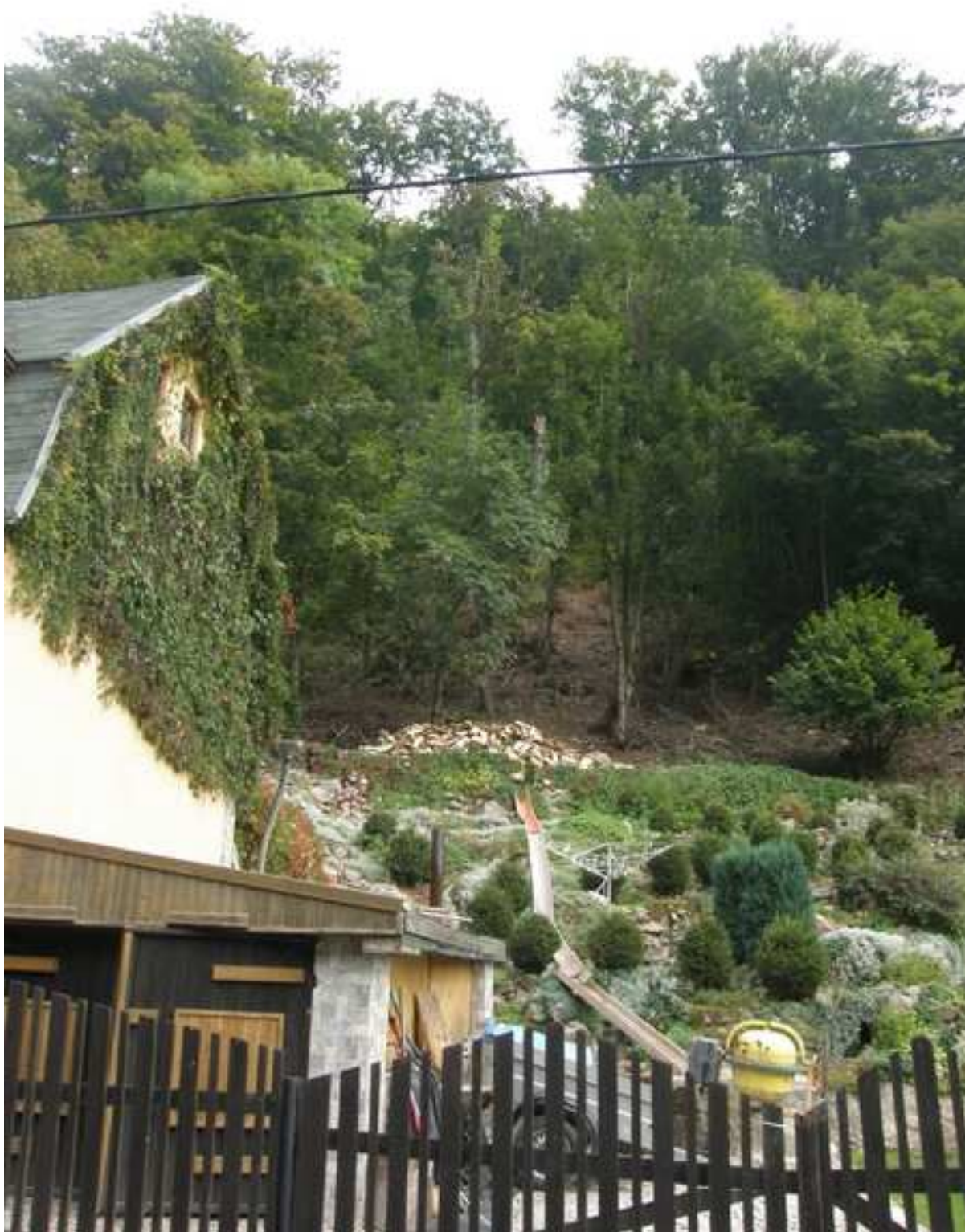
5 – nebezpečný svah