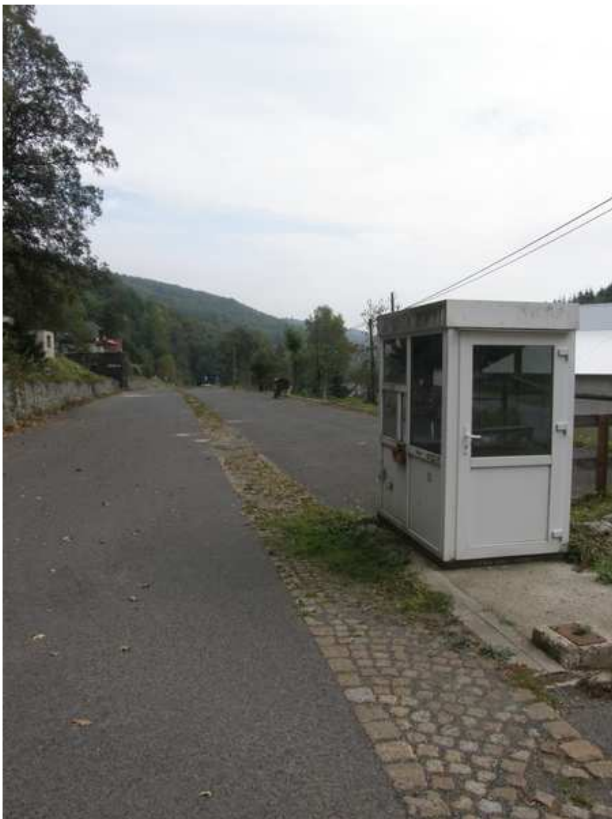
2 - parkoviště