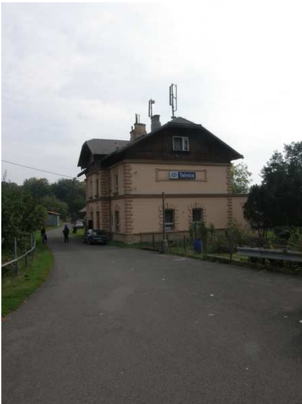
9 – vlakové nádraží