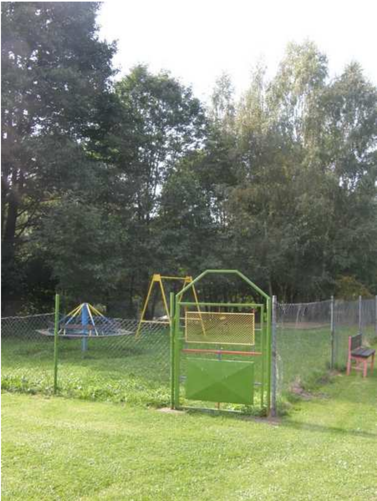
19 – dětské hřiště