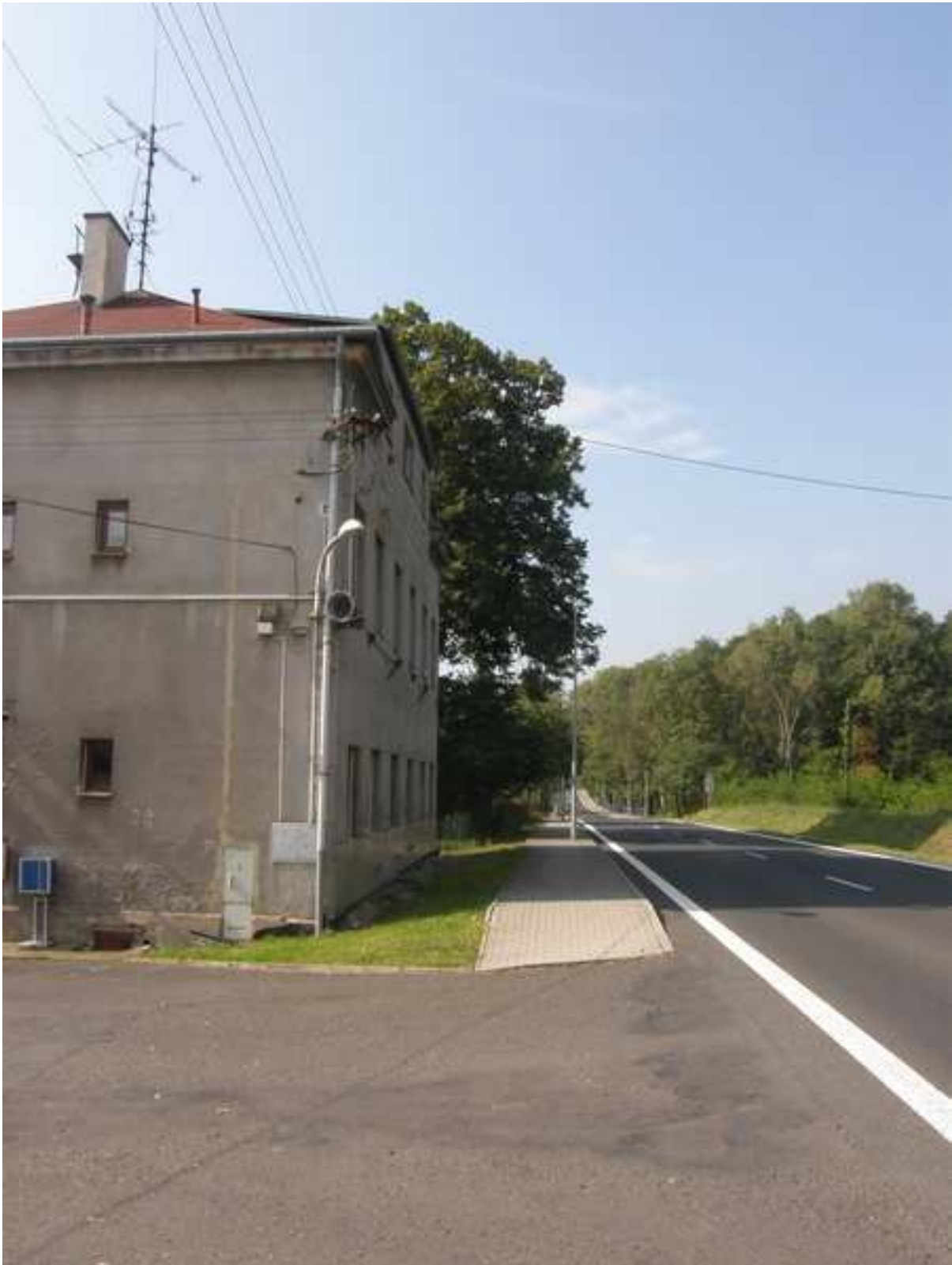
26 – odloučená část obce