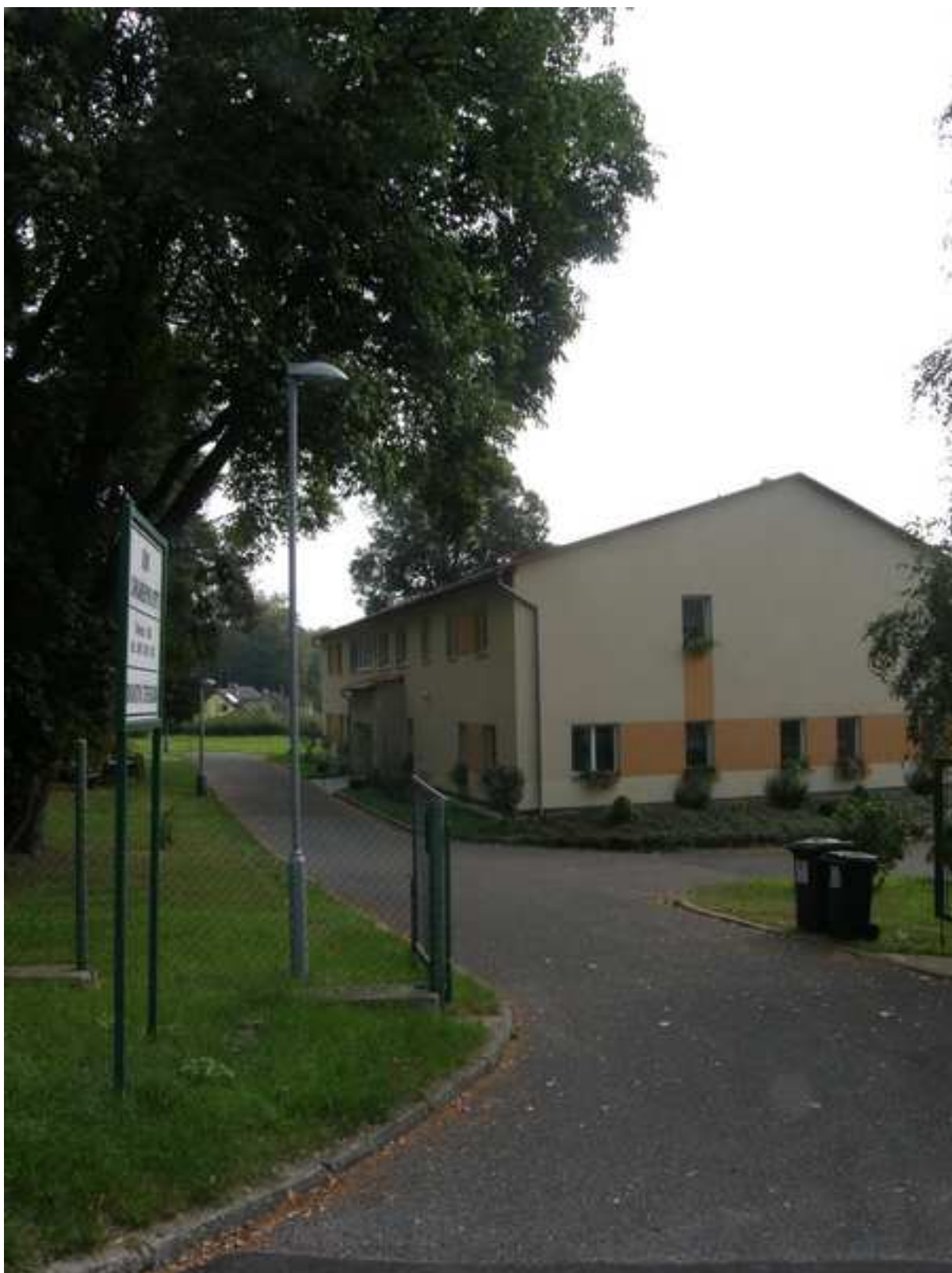
15 – občanská vybavenost