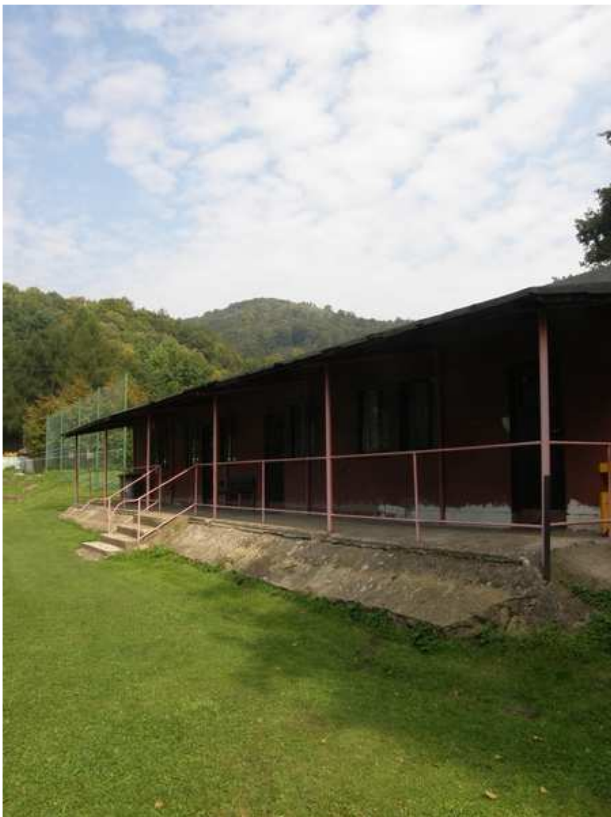
18 – šatny na fotbalovém hřišti