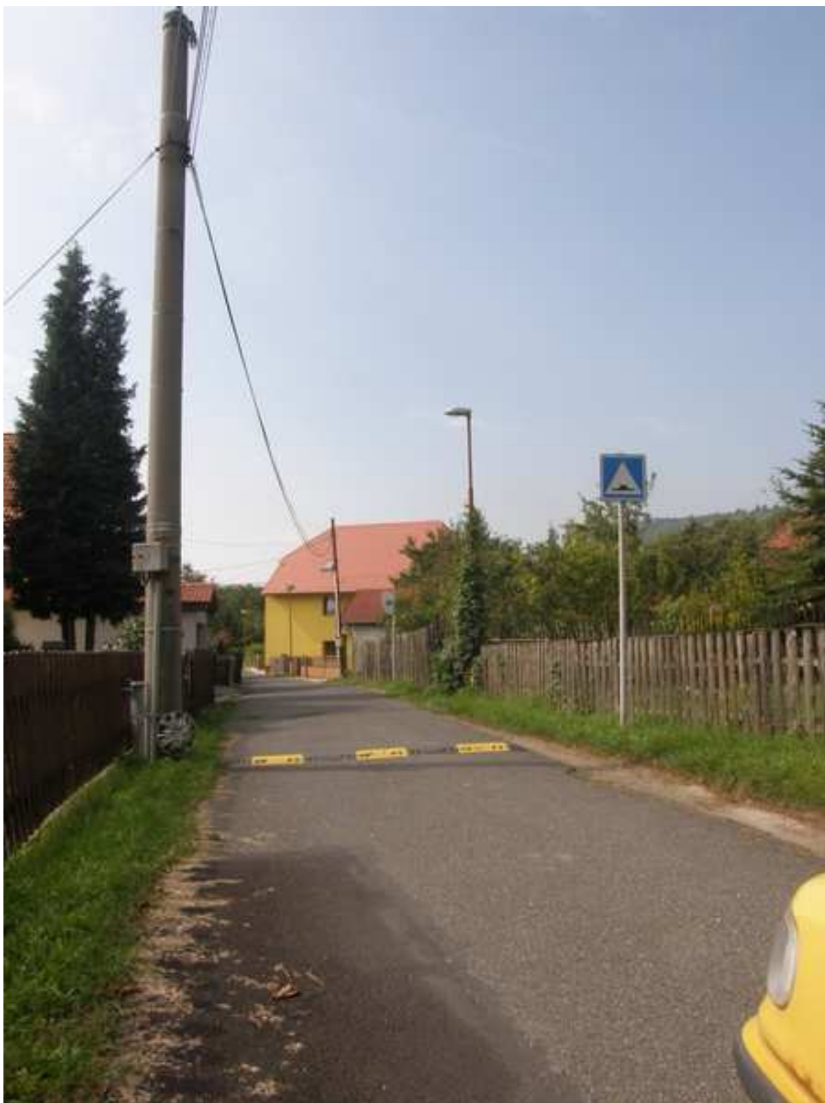
20 – dopravní retardér v intravilánu