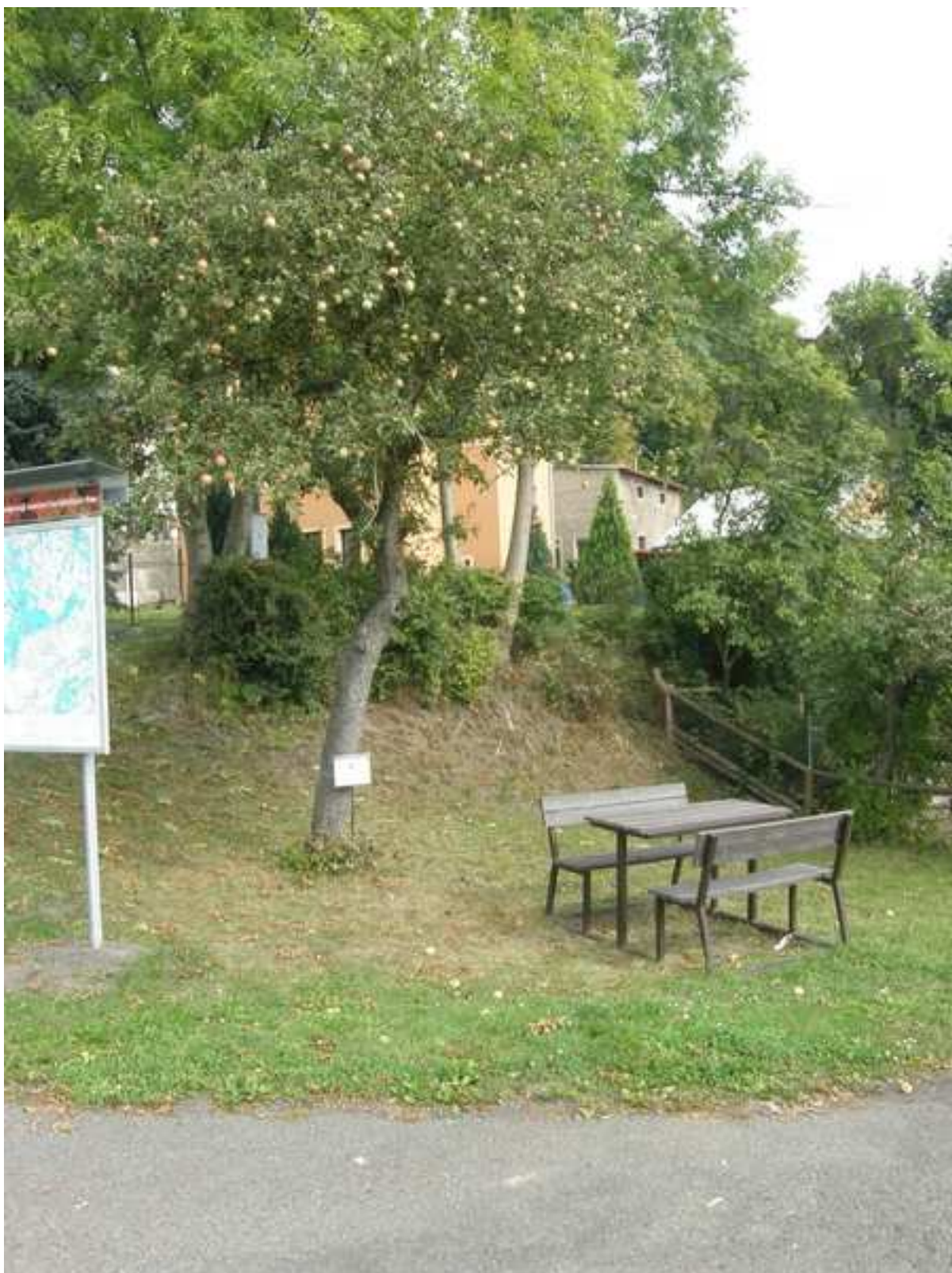
10 – prostor před nádražím