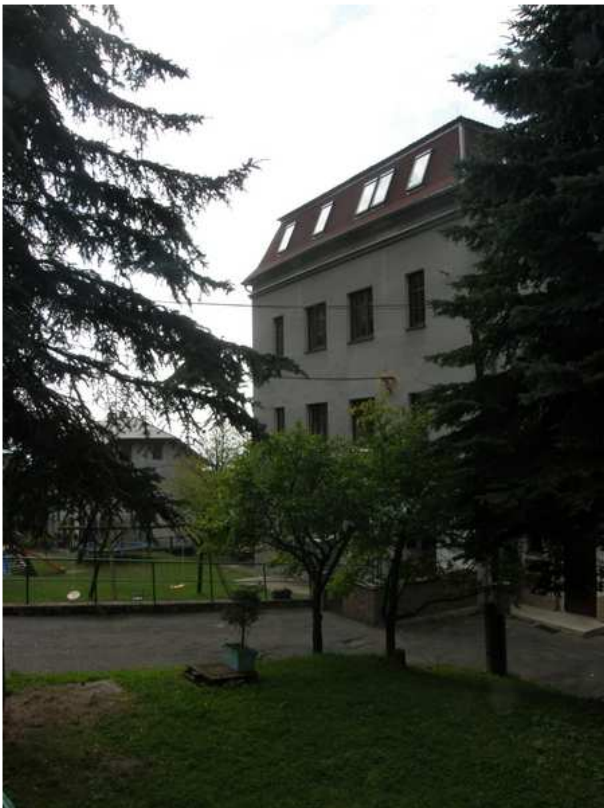
6 – mateřská školka