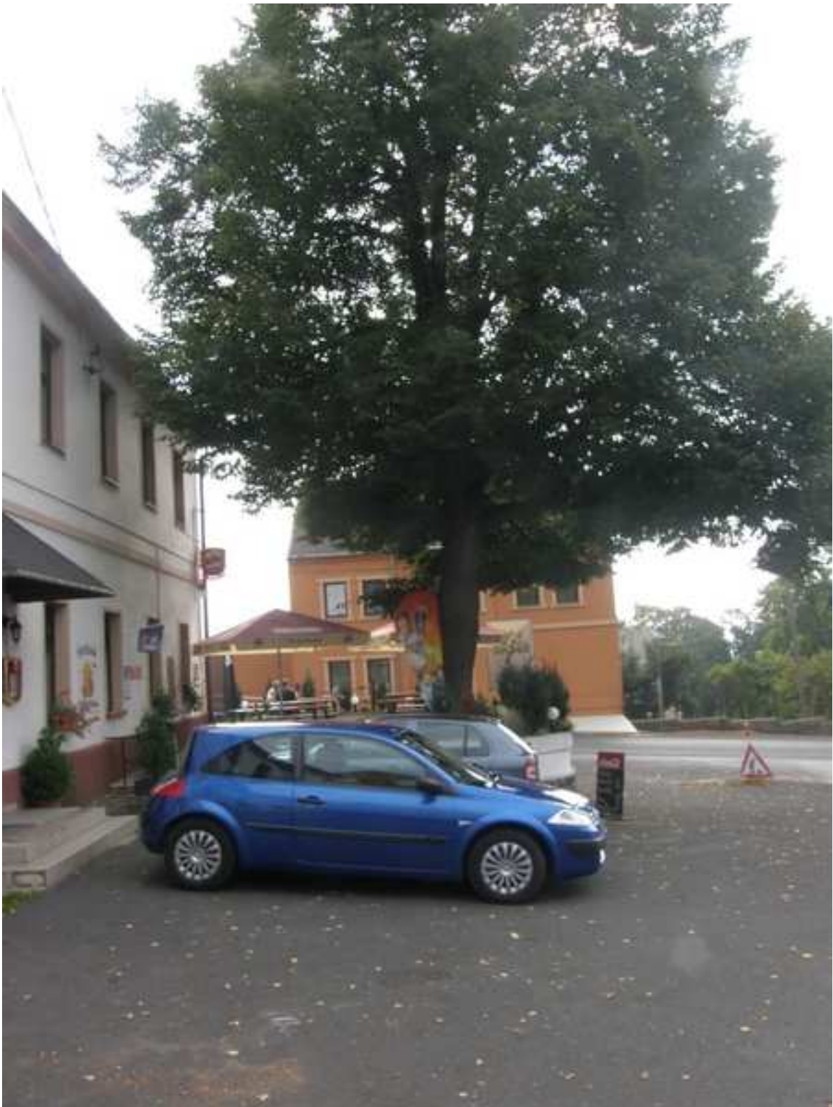
7 – občanská vybavenost