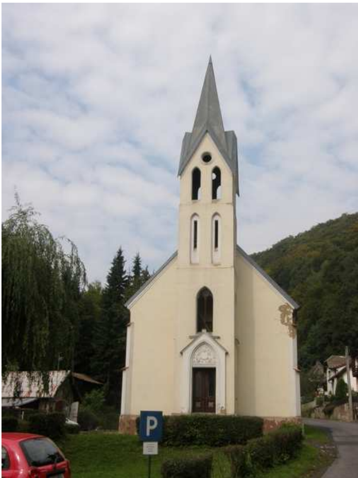
3 – historická památka obce