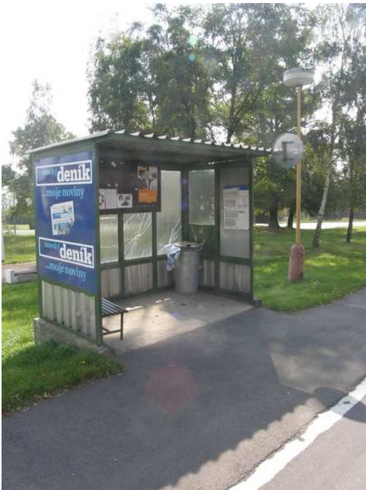
25 – problematická autobusová zastávka