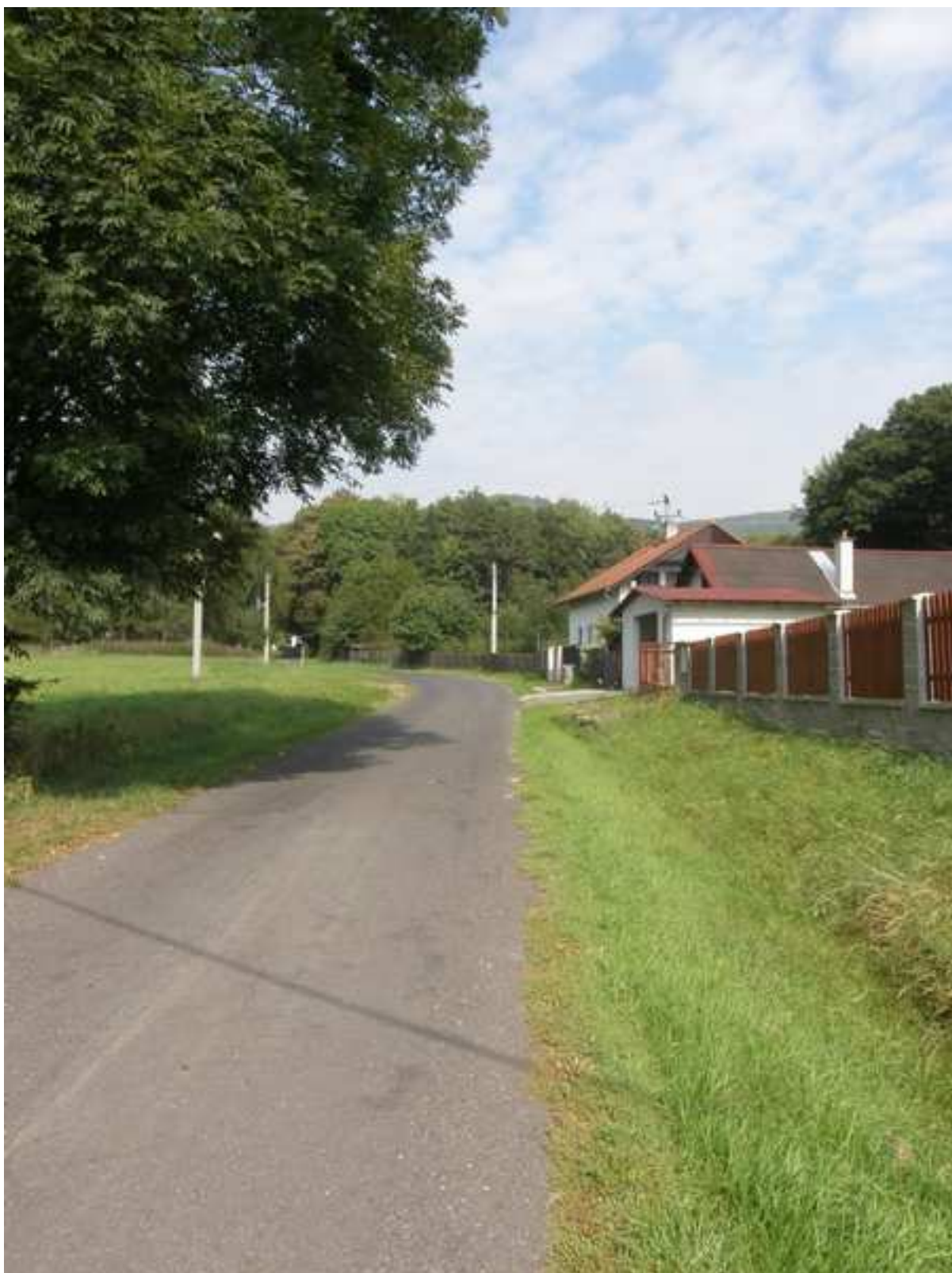
23– prostor pro územní rozvojové aktivity