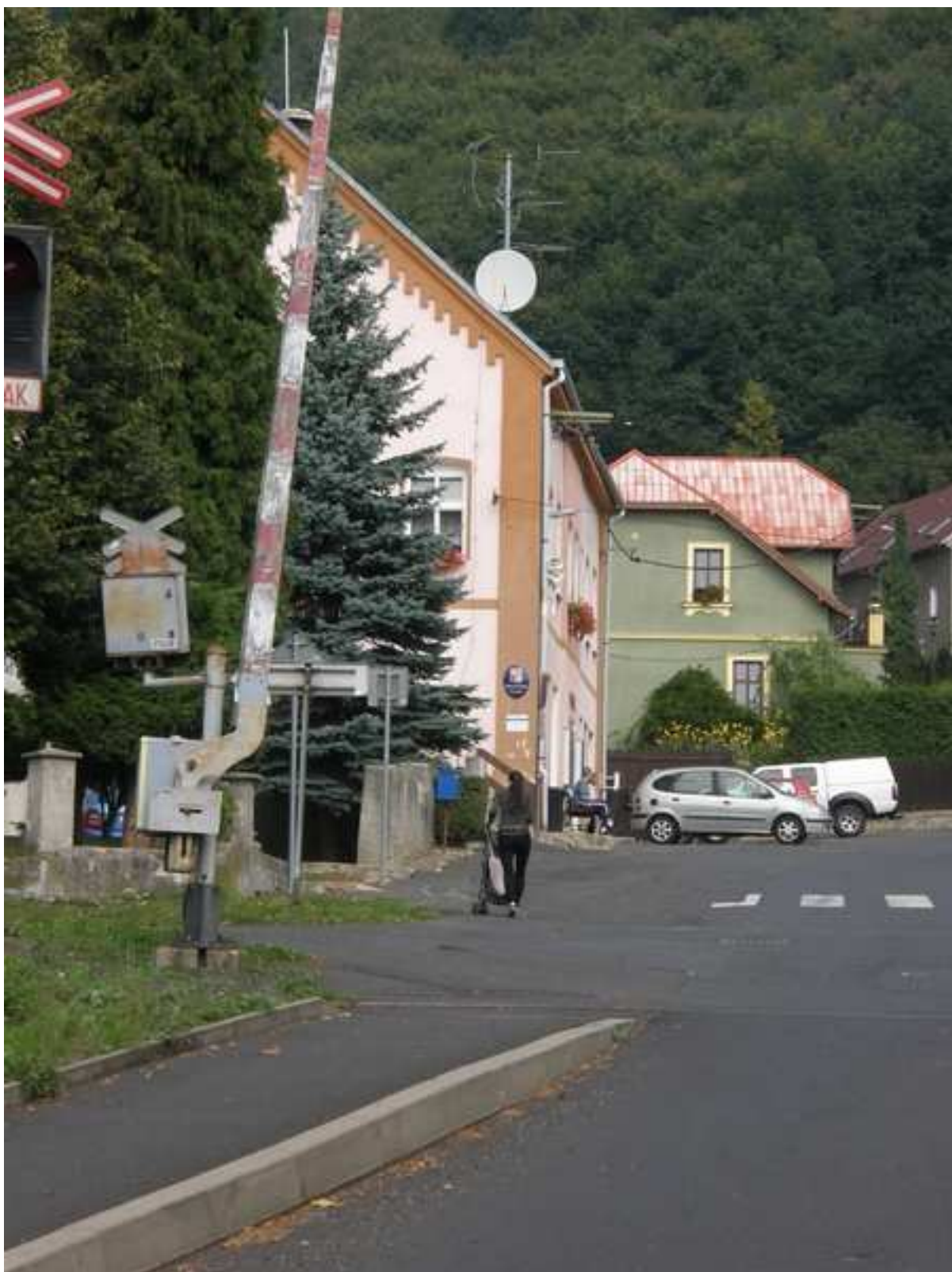
16 – konec chodníku před tratí