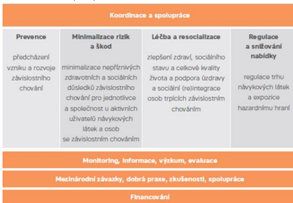
Obrázek 1: Struktura politiky v oblasti závislostí