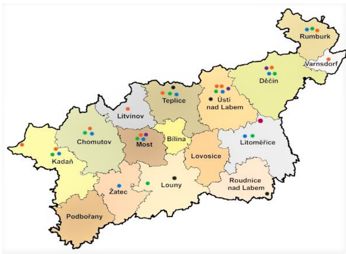
Obrázek 6: Grafické znázornění rozložení adiktologických služeb v Ústeckém kraji

Aktuální stav, potřeby a nedostatky v jednotlivých oblastech prevence jsou popsány v Akčním plánu v úvodních kapitolách zabývajících se současnou situací.