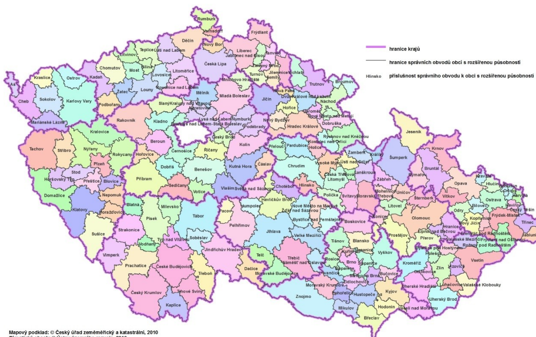
ÚZEMNĚ-SPRÁVNÍ ROZDĚLENÍ ČESKÉ REPUBLIKY K 1.1.2010