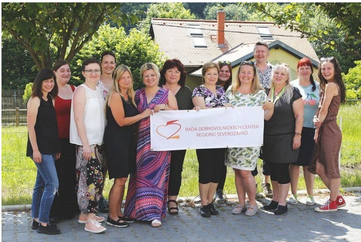
Obrázek 1: Fotografie zástupců členských organizací a hostů zasedání.