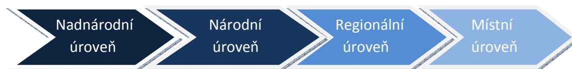
Obrázek 1: Schéma posuzování souladu se strategickými dokumenty na vyšší územní úrovni

V oblasti veřejné správy se v praxi setkáváme s širokou škálou strategických dokumentů na všech úrovních. Strategický dokument představuje každý písemný výstup, jehož obsahem je vymezení jasněho cíle spolu s určením způsobu jeho dosažení nebo plnění. Strategické dokumenty mají klíčový charakter pro závažná rozhodnutí dlouhodobého charakteru, jsou určující pro definování zásadních úkolů, delegování pravomocí a odpovědnosti a jsou podkladem při tvorbě dalších strategií a cílů v jednotlivých dílčích oblastech.