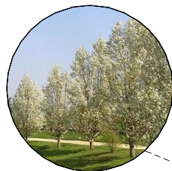
výsadba stromů podél komunikace