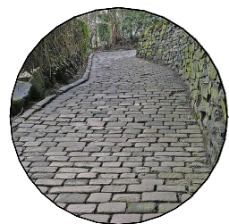
dlážděná pěšina, šířka 1,5m