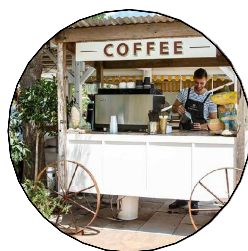
plocha pro sezónní bar