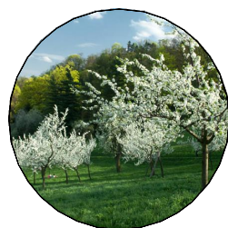
výsadba stromů podél cesty