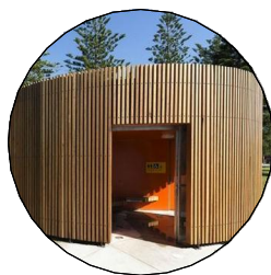
převlékárny, sprchy a wc