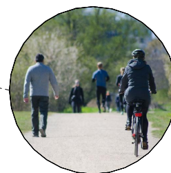
pěší + cyklostezka, šíře 3 m