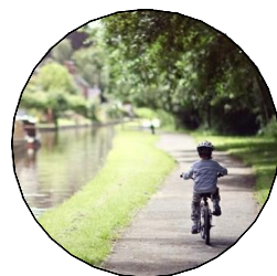
pěší + cyklostezka, šíře 3m