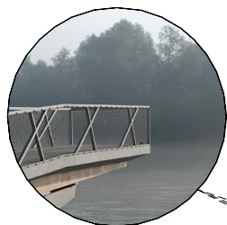
konzolové terasy s lavičkami