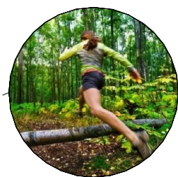
terénní běžecká dráha