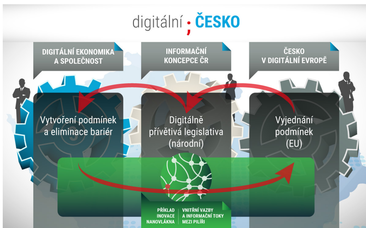
Obrázek 1 – Příklad informačního toku řízeného událostí

Jako praktický příklad lze uvést událost vzniklou z výsledku některé iniciativy v oblasti koncepce Digitální ekonomika a společnost – např. na základě (hypotetického) významného objevu aplikace oblasti nanovláken pro obranný průmysl. Taková iniciativa může vyvolat potřebu regulace na úrovni legislativy EU. Je tedy třeba využít silnou pozici ČR, kterou odborná výhoda českého objevu poskytuje k vyjednání optimálních podmínek regulace (oblast cílů koncepce Česko v digitální Evropě) a následně či souběžně harmonizovat národní legislativu v rámci příslušného cíle Informační koncepce a vytvářet podmínky v rámci realizace cílů pilíře Digitální ekonomika a společnost. Schematicky je tato situace naznačena na následujícím obrázku: