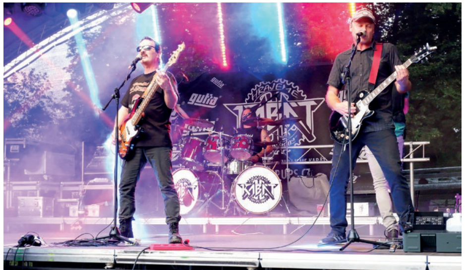
Projekt Letní Roudnice zaznamenal v loňském roce úspěch. Letní scénu na zámku navštívily tisíce lidí. Velký ohlas sklídl také koncert revivalové kapely Hrajame Kabát, který patřil k nejnavštěvovanějším akcím. Letos jsme je proto do Roudnice nad Labem pozvali znovu.

Z důvodu opatření covid-19 stanovených Českou republikou bude nutné dodržovat podmínky vstupu na akce. Aktuální podmínky najdete průběžně aktualizované na www.kulturnaroudnice.cz/ opatření. Pokud nemáte test ze zaměstnání nebo školy, neprodělali jste covid-19 nebo nemáte alespoň po první očkovací