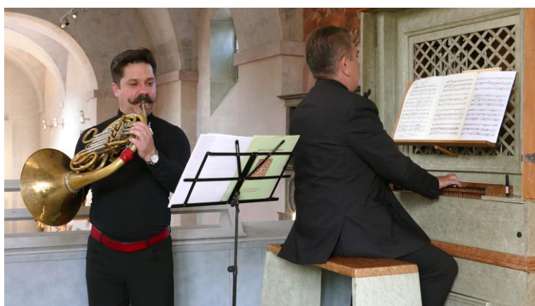
Den otevřených dveří památek koncert pro varhany a lesní roh