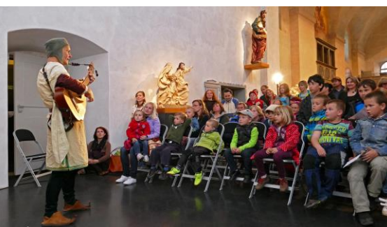
Muzejní noc 22. května 2015