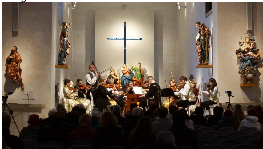
Zahájení turistické sezóny 1.4.2015: koncert souboru BONA NOTA