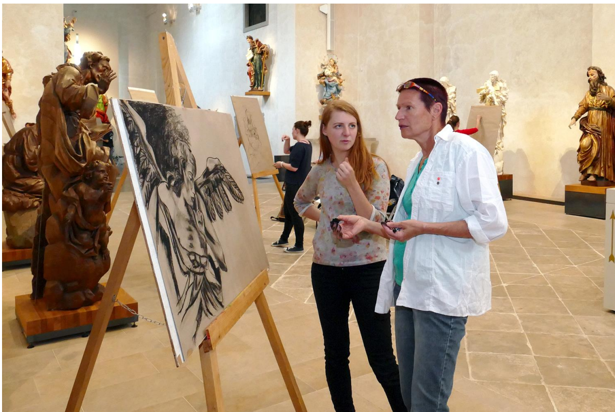
Letní výtvarný ateliér 13. – 16.7.2015