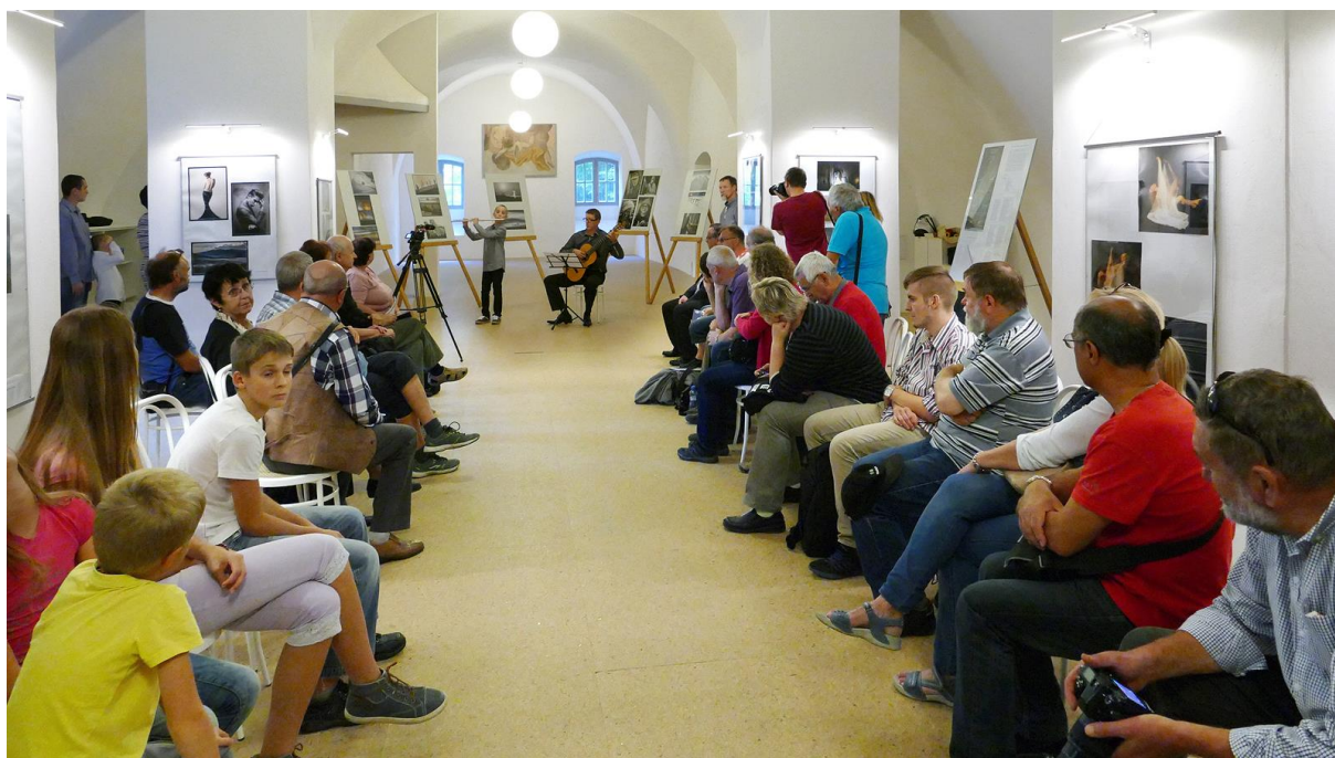
Den otevřených dveří památek 12.9.2015: vernisáž výstavy 53. českobudějovický okruh