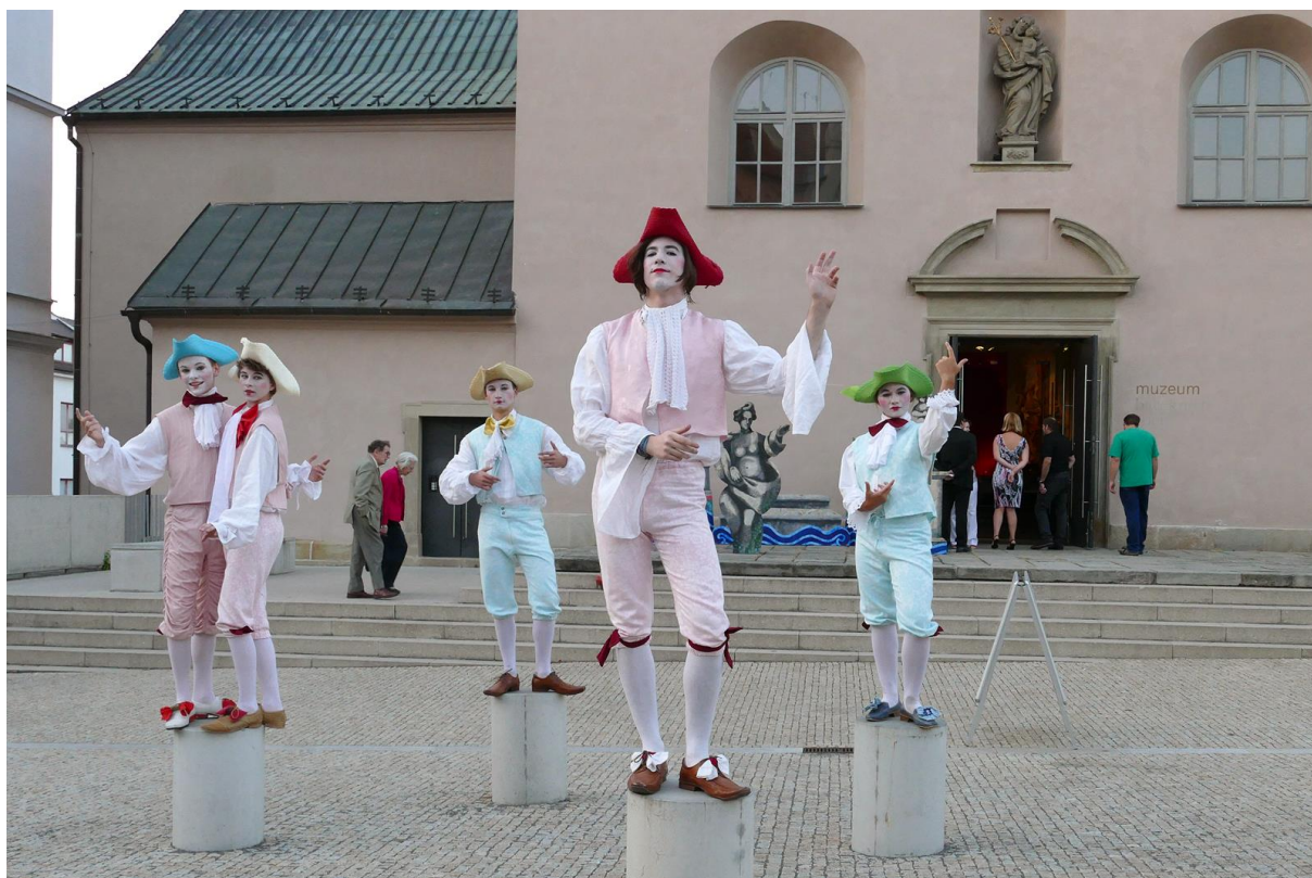
Letní barokní scéna 2016 20.-22.8.2015