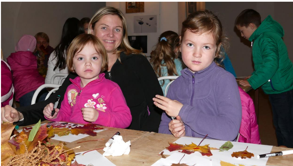
Dušíčkové loučení s turistickou sezónou 31. října 2015 : výtvarná dílna a představení modelu města