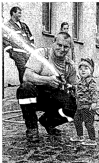
Děti se ne chvíli staly hasiči.