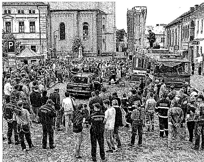
Návštěvníci shlédli ukázkou vyproštění osob z vozu.