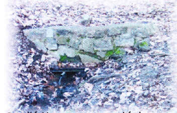
Srnčí Kroupova studánka