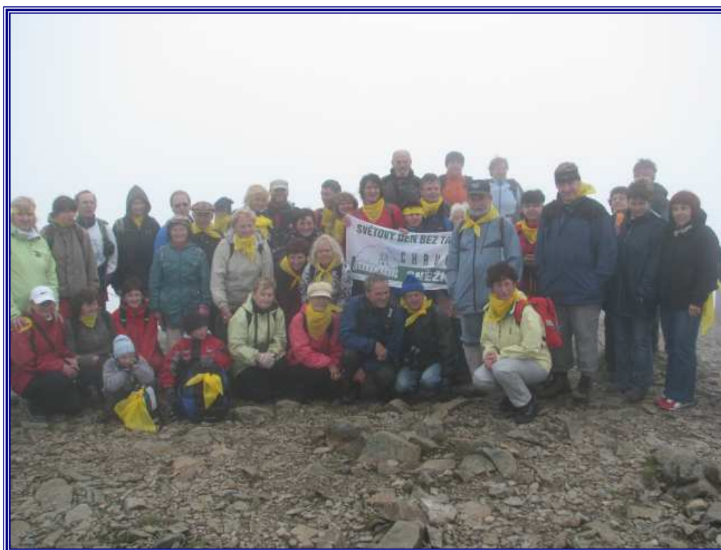
Společné vrcholové foto