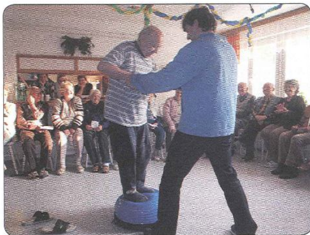
Náplň jednoho ze setkání – udržení rovnováhy a další motorická cvičení

Plánované navazující aktivity: Rádi bychom požádali o další grant a věnovali se sociálním vztahům seniorů a mládeže se zaměřením na témata našich ŠVP (páchání protispolečenské činnosti na seniorech, seznamování seniorů s určitými nestandardními situacemi), na cvičení jednoduchých modelových situací a na ukázky sebeobraných situací vhodných pro seniory. Rádi bychom pokračovali v nácviu dalších psychomotorických cvičení a her, které prokazatelně napomáhají seniorům při zvládnání běžných denních úkonů, napomáhají ke zlepšení jejich soběstačnosti (např. při zapínání knoflíků, oblékání, zavazování tkaniček, konzumaci jídla, používání drobných předmětů denní potřeby apod.), a současně tak přispívají ke zlepšení kvality života seniorů. Pokud by se nám nezdařilo získat další finanční podporu, rádi bychom i v tomto případě nabídli pomoc domovu při organizování a zajišťování podzimního sportovního dne.