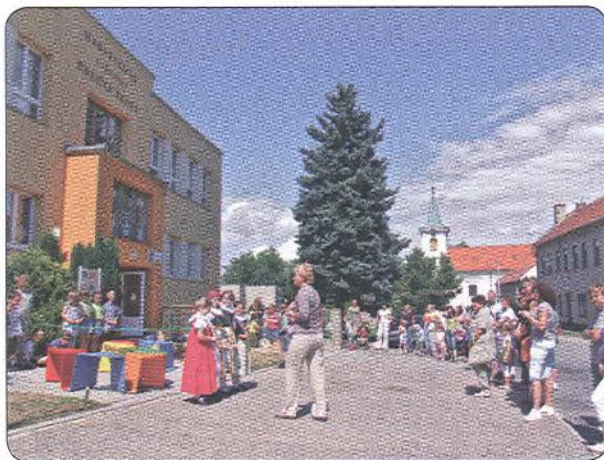
Slavnostní otevření prostoru původní předzahrádky školy

Plánované navazující aktivity: Prostor je každodenně využíván žáky při čekání na autobus a dále při pravidelných akcích pro veřejnost. Protože výsledky projektu se zamlouvají veřejnosti i vedení obce, řešíme možnosti úprav dalších prostranství v okolí školy. V samotném prostoru žáci umístili informační cedulky k jednotlivým druhům keřů a prostor je využíván ve výtvarné výchově i v jiných předmětech. O předzahrádku dále společně pečujeme.