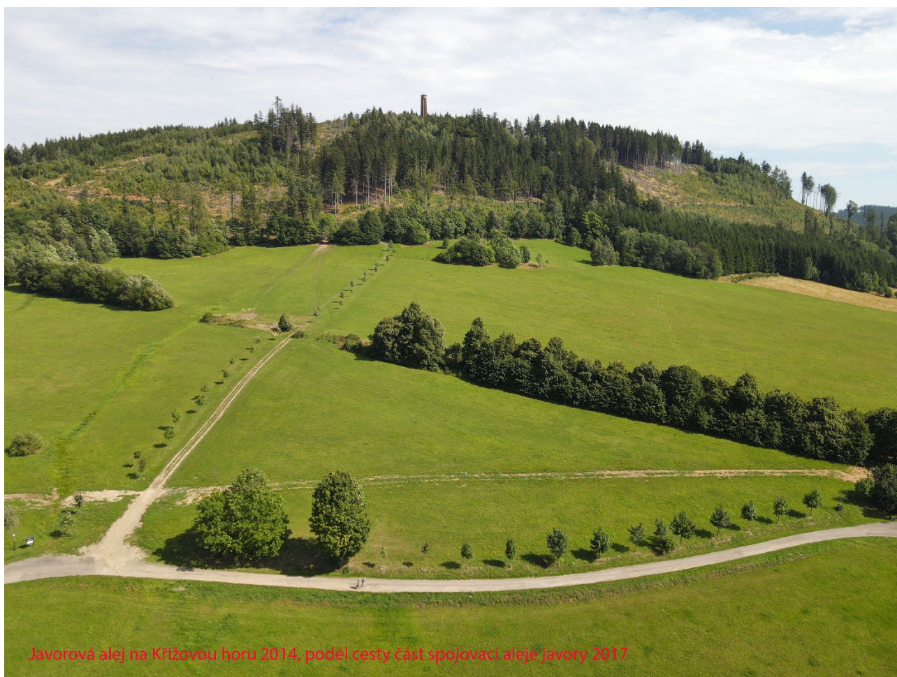
Javorová alej na Křížovou horu 2014, podél cesty část spojovací aleje javory 2017

Obec se celkově věnuje péči o zeleň nejenom v obecním majetku. Vlastníme také plán údržby, provádíme tomografie a ošetření i neobecních stromů.