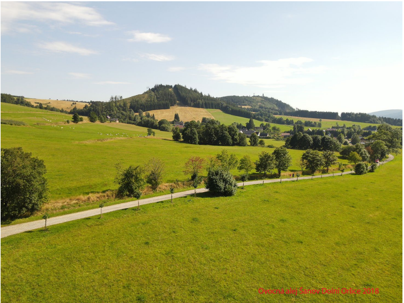
Ovocná alej Šanov Dolní Orlice 2018