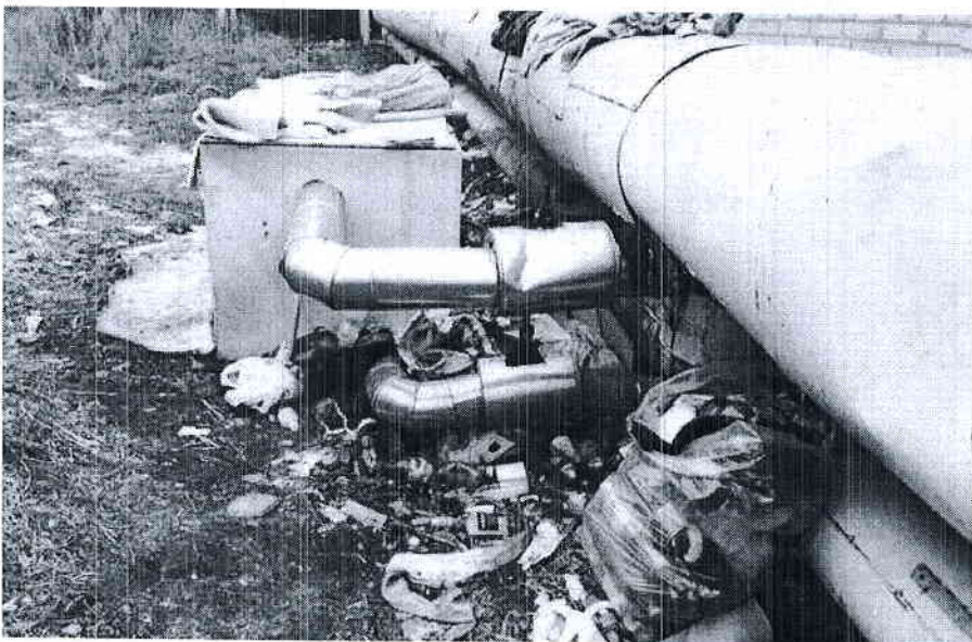
Lokalita, kde bezdomovci pobývají, jsou často plné odpadu

PROJEKT „PODPORA SOCIÁLNÍ PRÁCE V OBCI S ROZŠÍŘENOU PŮSOBNOSTÍ HODONÍN“ JE SPOLUFINANCOVÁN Z PROSTŘEDKŮ ESF PROSTŘEDNICTVÍM OPERAČNÍHO PROGRAMU ZAMĚSTNA- NOST A STÁTNÍHO ROZPOČTU ČR.