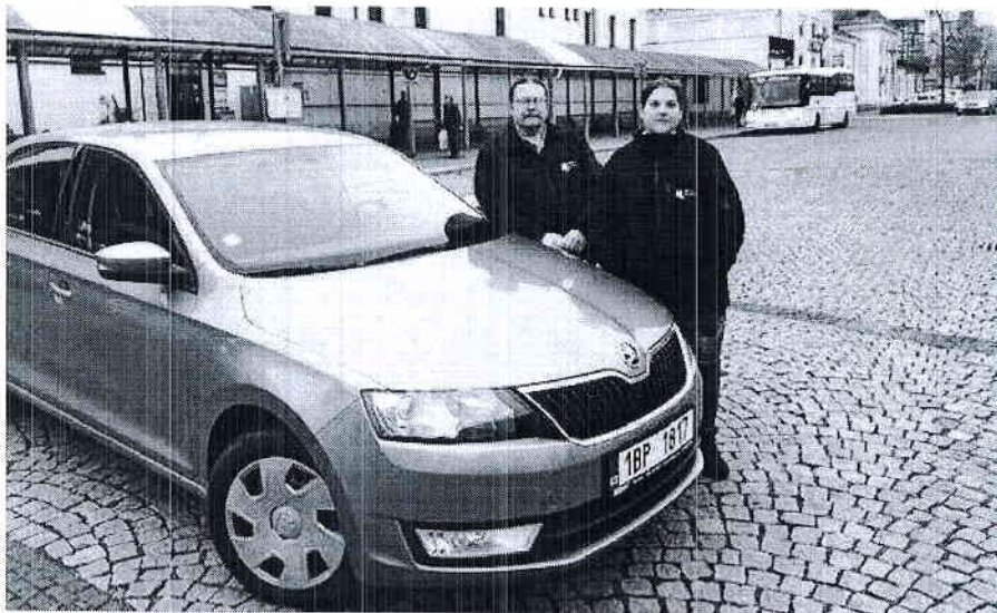
Problematiku osob bez přístřeší řeší terénní sociální pracovníci městského úřadu

Velmi dobrá a zároveň záhadná otázka. Většina osob je zaevidována na ÚP a pobírají dávky hmotné nouze. Tato dávka je ještě rozdělena na finanční hotovost a stravenky, za které si mohou nakoupit jídlo, oblečení, drogerii nebo léky. Ti, kteří nemají tyto dávky a jsou bez finančních prostředků, si vždy nějak poradí. Mají kamarády, se kterými tráví