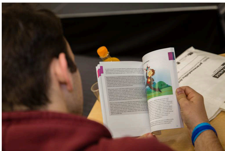
Hosté dostali knihu o práci na dálku