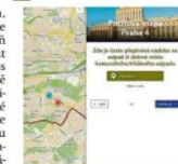
Spendlíky POCIŤOVÁ MAPA

V mapě je osm otázek týkajících se celoměstských témat. K odpovědím mohou lidé přidat i komentáře. Výsledky z mapy využije město, jednotlivé radnice, ale i jeho organizace, například Technická správa komunikací či městská policie. Zkušenost s podobným projektem má mimo jiné Praha 10. Na rozdíl od dosavadních magistrátních aplikací se zaměřením na nahlášení akutních problémů, jako jsou třeba výmoly v silnicích nebo popadané větve, cílí pociťová mapa na dlouhodobá témata a problémy. Národní síť Zdravých měst, se kterou město na tvorbě mapy spolupracuje, chce po skončení pilotního projektu v hlavním městě využít zkušenosti v dalších krajích. čtk