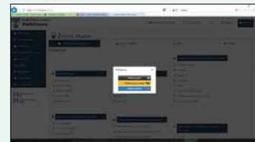
Spuštění Portálu občana města Pelhřimov je v souladu se záměry státu v oblasti elektronizace veřejné správy. Jed-