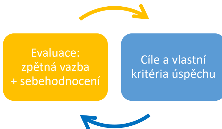
Obr. 4 Schéma opakujících se fází nikdy nekončícího procesu evaluace

Jednotlivá kola a fáze celého procesu tedy můžeme shrnout takto: