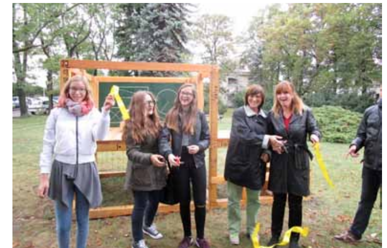
Studenti ZŠ Stoliňská rozhodli, že část rozpočtu má být využita na realizaci projektu Matematická kostka.

Modelů zapojení škol do participativního rozpočtování je celá řada. Důležité je, jaké peníze se rozdělují, kdo na procesu participuje nebo jaká instituce jej organizuje (škola, školní obvod,