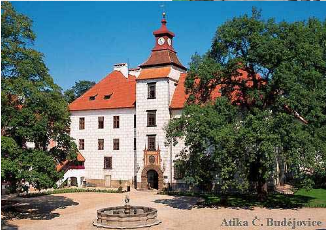
Atika Č. Budějovice