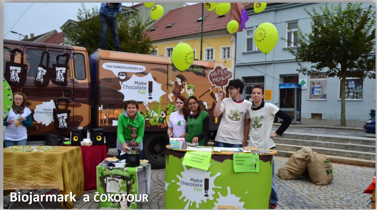
Biojarmark a ČOKOTOUR