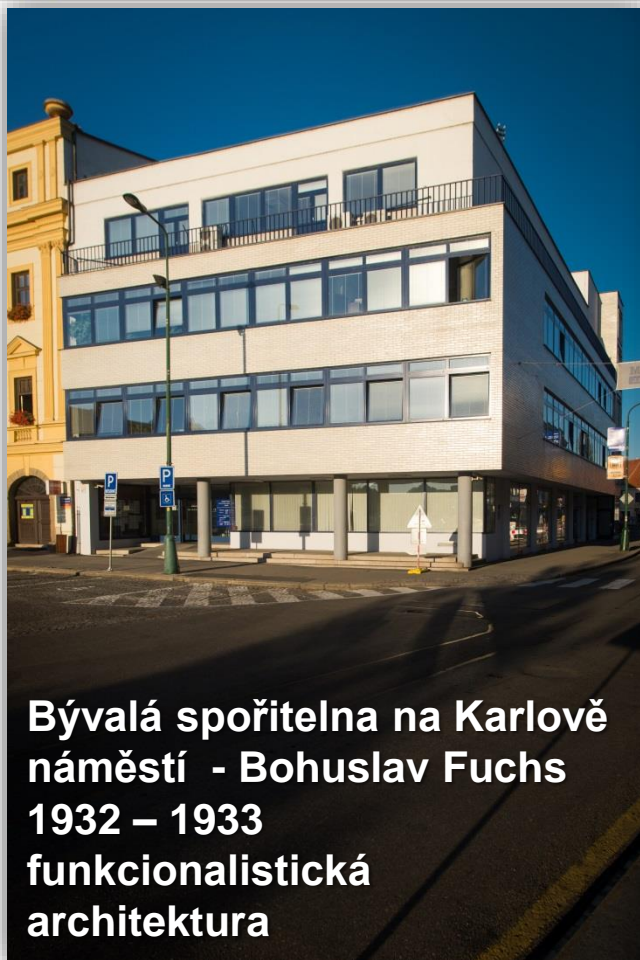
Bývalá spořitelna na Karlově náměstí - Bohuslav Fuchs 1932 – 1933 funkcionalistická architektura