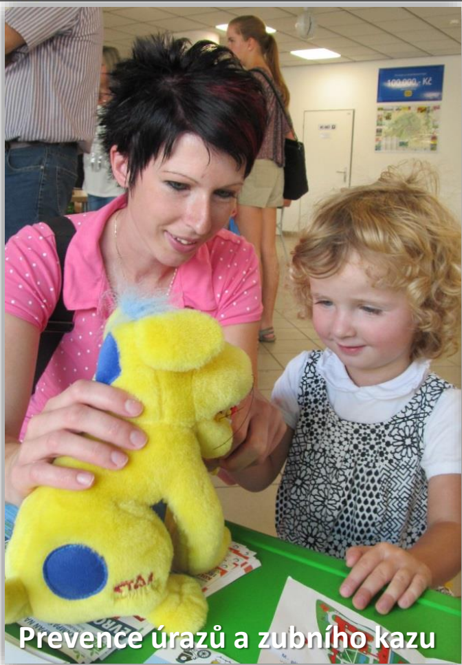
Prevence úrazů a zubního kazu