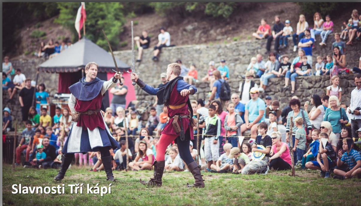
Slavnosti Tří kápí