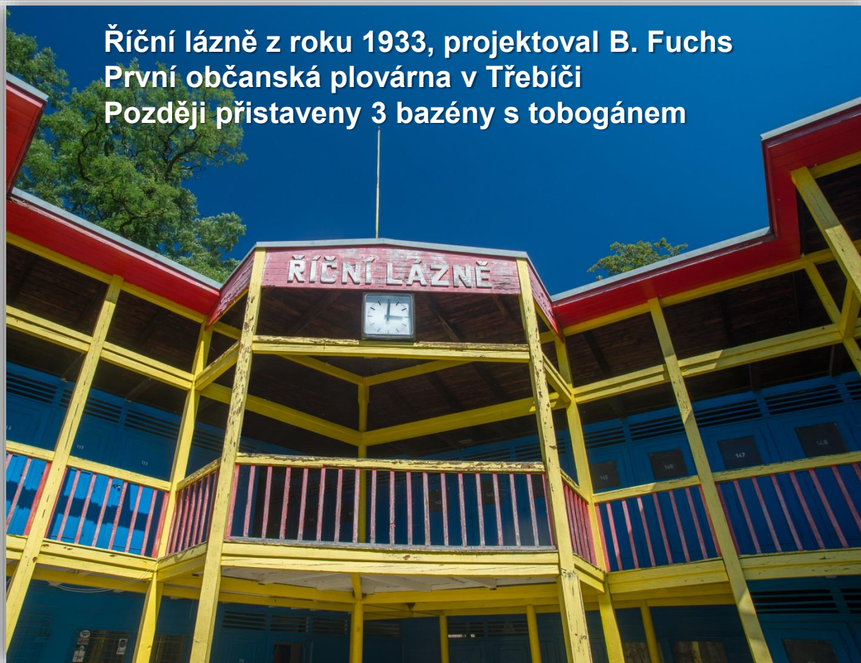
Říční lázně z roku 1933, projektoval B. Fuchs První občanská plovárna v Třebíči Později přistaveny 3 bazény s tobogánem