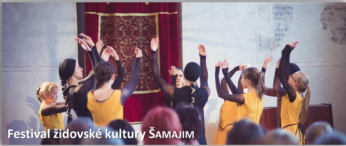
Festival židovské kultury ŠAMAJIM