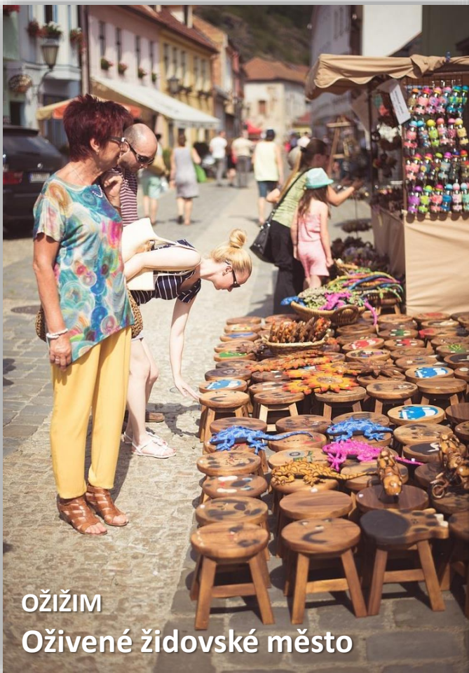
oŽIŽIM Oživené židovské město