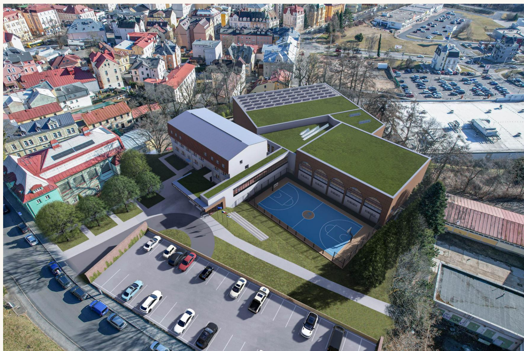
Vizualizace · ateliér (placeholder).

Multifunkční sportovní hala s tribunou pro 800 diváků a zázemím pro mládežnické kluby — vlajková loď naší kandidatury na European Town of Sport.