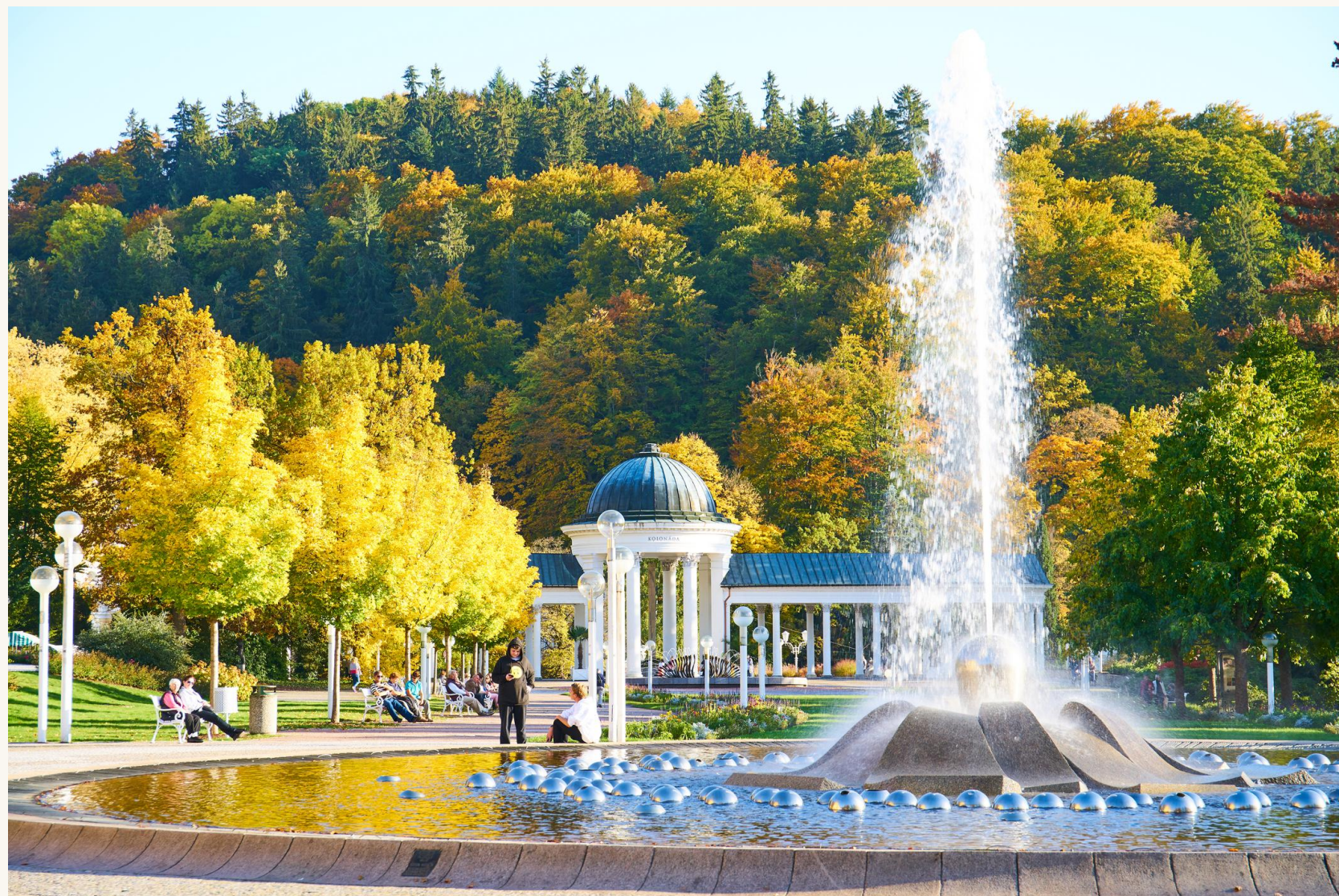
Zpívající fontána, slavnostní obnova, květen 2022.

Restaurování ikonické fontány z roku 1986 v centru kolonády — replika čerpadel, nové LED osvětlení, digitálně řízené hudební partitury.