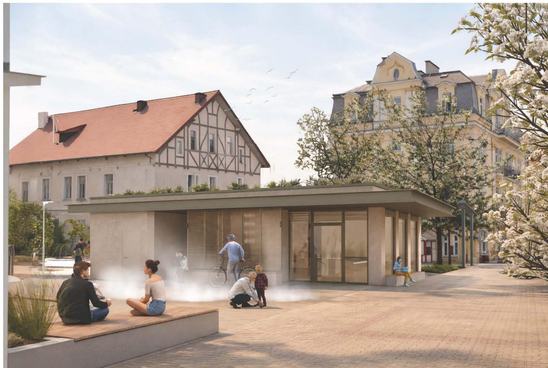
Revitalizace Městské tržnice - Mariánské Lázně

Stálé tržiště s regionálními producenty v sousedství parku — místo, kde se potkávají lázeňští hosté s místními občany.