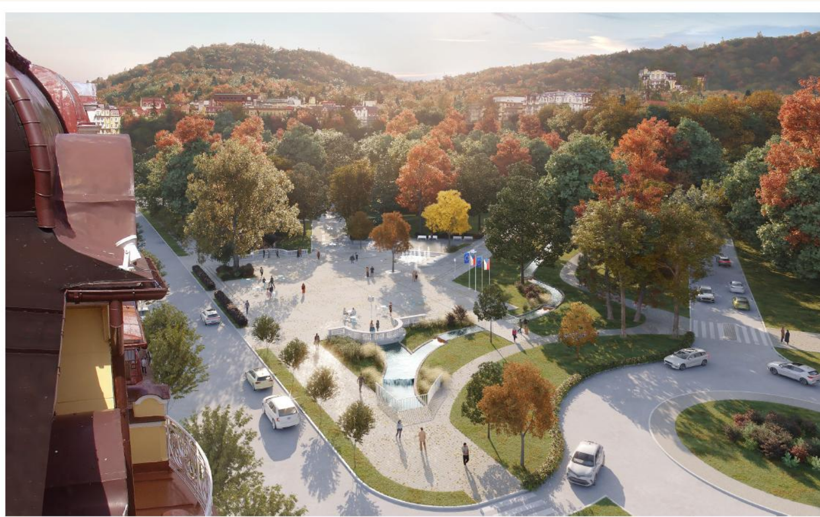
Studie revitalizace centra (placeholder).

Návrat centra městu — pěší zóna na Hlavní třídě, obnovené Mariánské náměstí, vodní prvky a nová stromořadí v duchu Skalníkovy parku.