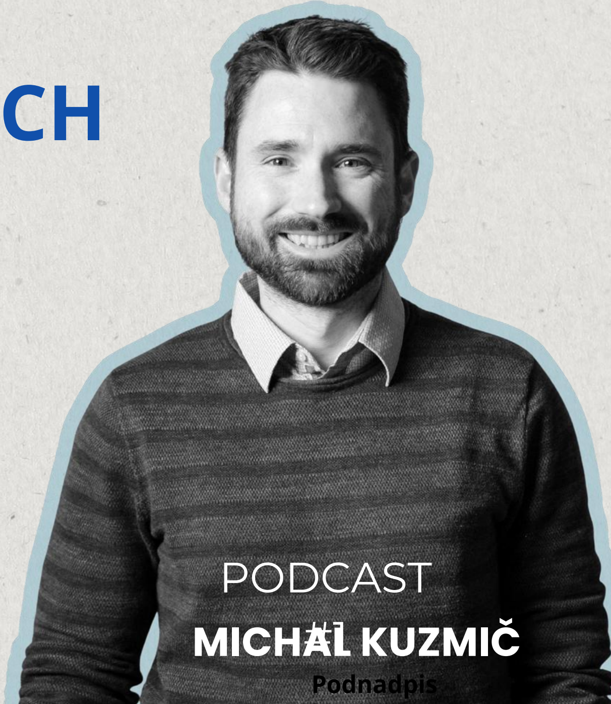
PODCAST MICHAĽ KUZMIČ