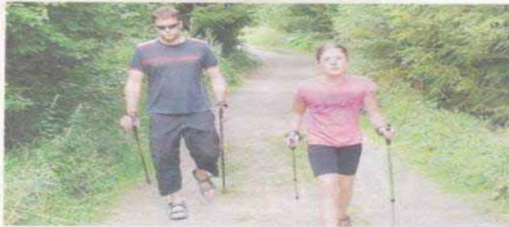
MUŽI A MLADÍ LIDÉ SI VĚTŠINOU MYSLÍ, ŽE CHŮZE S HOLEMI JE DOBRÁ TAK AKORÁT PRO „STARÉ A NEMOCNÉ“. KDYŽ SI NORDIC WALKING VYZKOUŠEJÍ V PRAXI, KÝVAVÍ PŘEKVAPEMÍ

Text a ilustrační foto: Lenka Schnalová Redakčně zkráceno