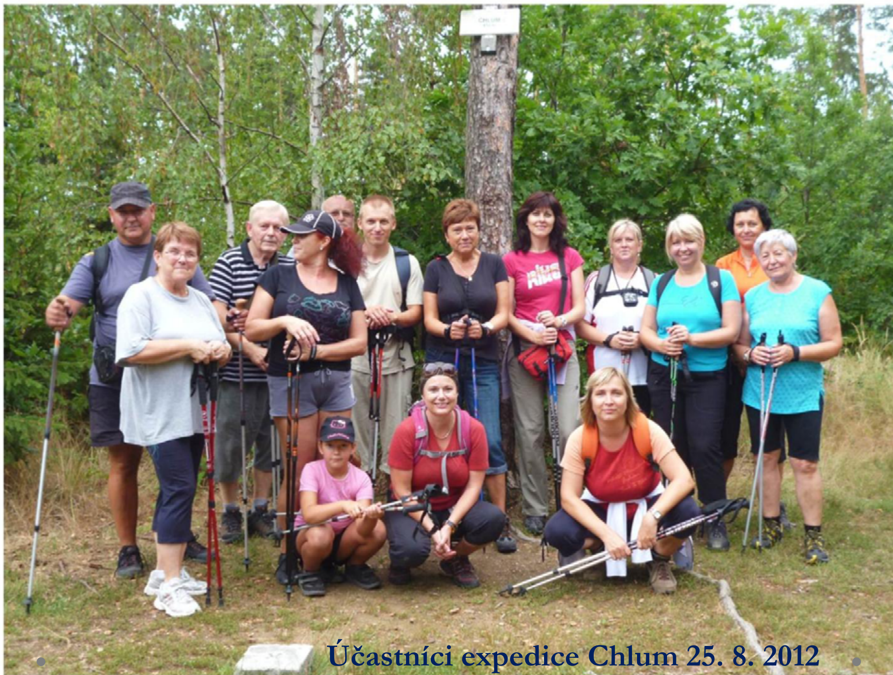
• Účastníci expedice Chlum 25. 8. 2012 •