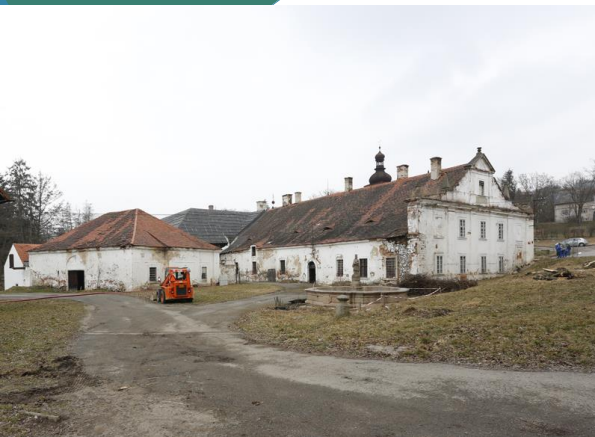
Plasy, klášter – PLK Jablonec n.Nisou Vrkoslavice, vodojem – LBK