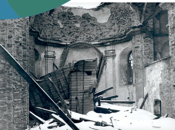
Kostel Neratov – KHK Fara Nové Sedlo – ÚK