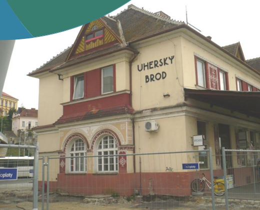
Uherský Brod, ZLK Český Brod, STK