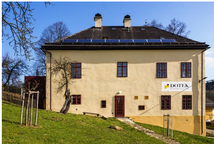
Dolní Maršov - KHK Skalná - KVK